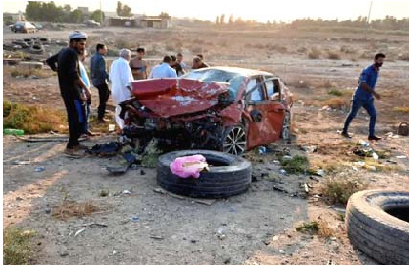
حادث: مركبة محطمة نتيجة حادث سير في بغداد

بحسب ما نشرته الجريدة العراقية، فقد حوّل القضاء يدين موظفتين لإختلاسهما أكثر من ستة مليارات دينار من أموال المؤسسة التي يعملان فيها. وقد حوّل القضاء يدين موظفتين لإختلاسهما أكثر من ستة مليارات دينار من أموال المؤسسة التي يعملان فيها. وقد حوّل القضاء يدين موظفتين لإختلاسهما أكثر من ستة مليارات دينار من أموال المؤسسة التي يعملان فيها.