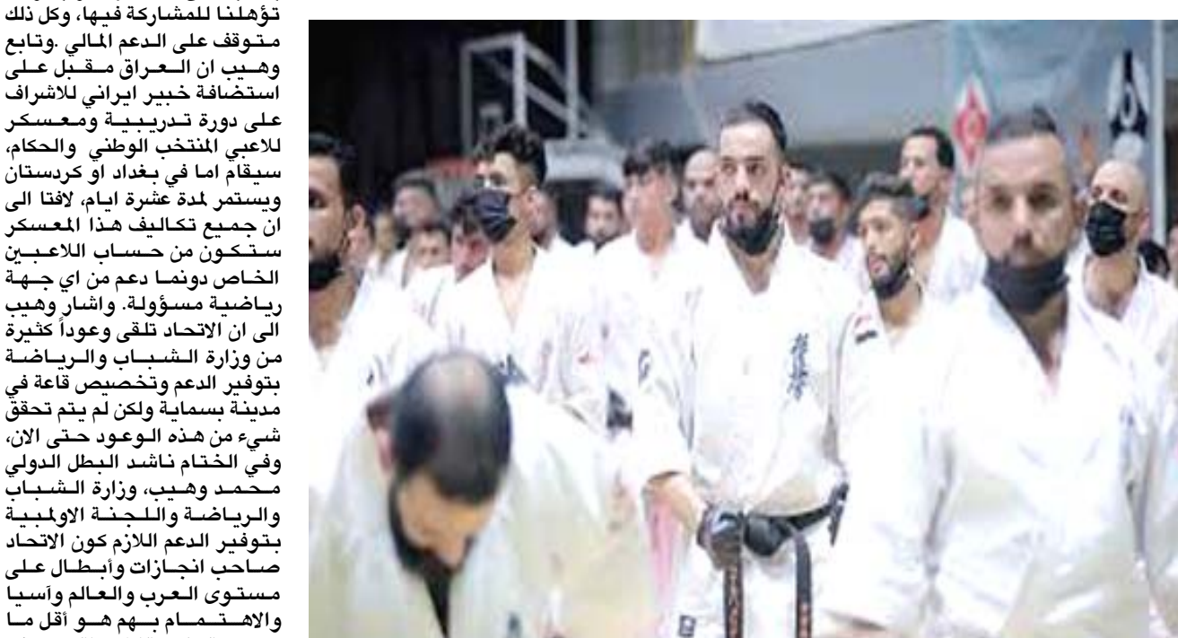
لاعب منتخب الكيوكوشنكاي

بغداد- الزمان باتت مشاركة العراق في بطولة العرب للكيوكوشنكاي والمؤهل انطلاقها منتصف شهر تشرين اصحاب الانجازات المحلية