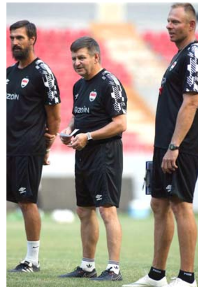
الكادر التدريبي للمنتخب الأولبي