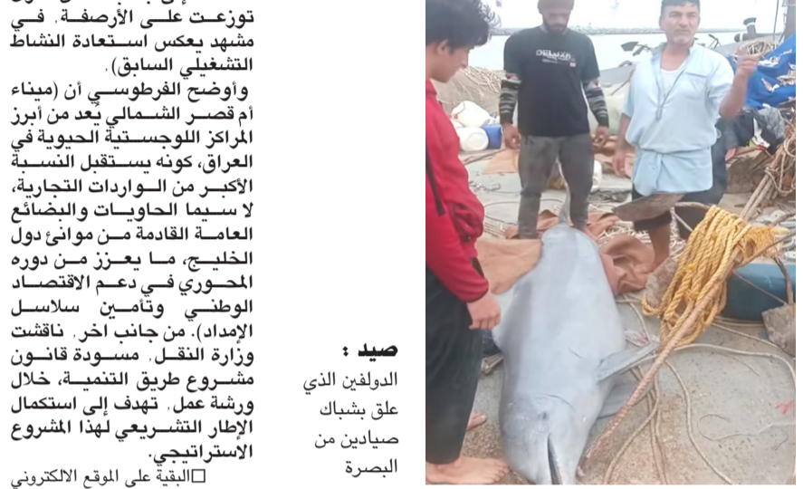
صيد : الدولفين الذي عثر عليه في خور عبد الله بالبصرة

البصرة - أمجاد ناصر يكون مستهدفاً بشكل مباشر، حيث أكد أحد الصيادين أنه تم العثور عليه، بالصدفة، إلى جانب الأسماك داخل الشباك. وأوضح الصيادون أنهم (بذلوا) جهداً كبيراً لرفع الدولفين من الشباك بسبب حجمه. صيد اعتيادية، في حادثة لافتة للانتباه، تداولها ناشطون على نطاق واسع، إذ اشتعلت دواغش في مناطق متفرقة من البلاد. وأكد بيان للجهاز لثقته (الزمن) أمس إن (قوة من) الجهاز القت القبض على أحد العناصر في بغداد، بينما تم اعتقال آخر في الأنبار، وثالث في السليمانية بالتنسيق مع الجهات المختصة، إضافة إلى منته أحر في ديالى.