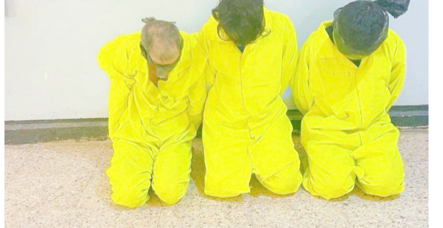
شبكة: عناصر شبكة مخدرات في قبضة الامن

محافظتي بابل والبصرة. وقالت المديرية في بيان تلقته (الزمان) أمس إن (بجهود استخبارية استثنائية وبمعلّتين منفصلتين، تمكنت مديرية شؤون المخدرات في بابل والبصرة من تفكيك شبكتين