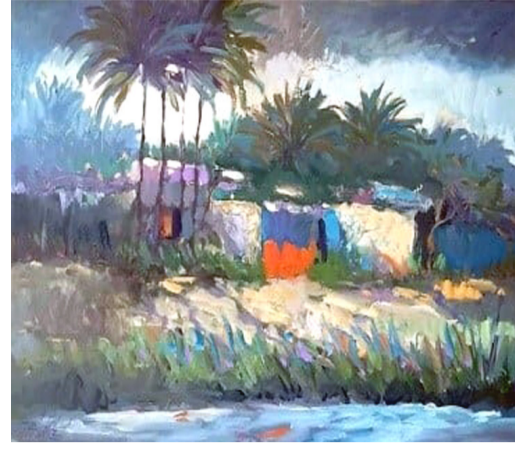
تشكيل - لوحات بريشة فراس النجار