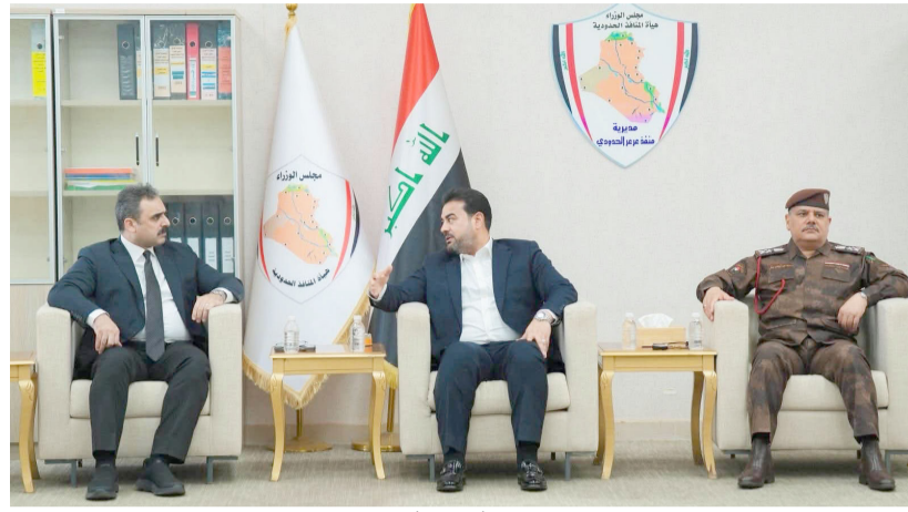
اجتماع: محافظ الأنبار عمر مشعان ترأس اجتماعاً موسعاً في منفذ عرعر بحضور رئيس هيئة المنافذ الحدودية

لموسم الحجاج، برعاية الهيئة العامة للحج والعمرة، وبمشاركة واسعة من القيادات الدينية والإدارية. وأكد محافظ النجف، يوسف كناوي، خلال المؤتمر أمس (دعم ادارة المحافظة الكامل للجهود التنظيمية، مشيداً بجهود العتبة العلوية في تطوير العمل الإرشادي والخدمي، بما يتحسس إيجابيا على مستوى الخدمات المقدمة للجهود، لافتاً إلى أن (الجهود الصحية والأمنية والخدمية كافة، تضمن راحة الحجاج). من جانب آخر، أطلقت الحكومة، حملة ضخمة مرافقة شملت أعمال الاستعداد وتحسين البيئة في منفذ عرعر، ضمن مساعي توفير أجواء مريحة وبمكثاة هذه الشعيرة الدينية وعزز من صورة التنظيم والإدارة على المستوى الوطني).