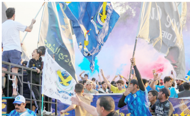
جماهير القوة الجوية

قرار لجنة الانضباط في الاتحاد العراقي لكرة القدم بحرمات جماهير القوة الجوية من حضور المباريات على أرضه. البقية على الموقع الالكتروني لجريدة (الزمان)