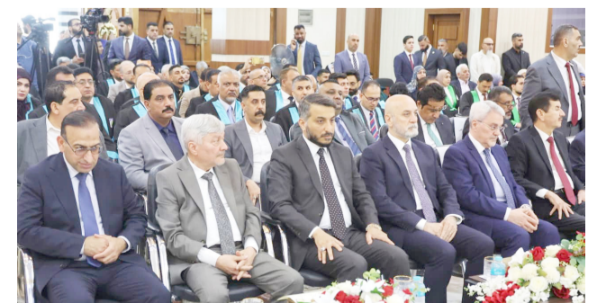
دفعة: لقطات من احتفالية تكريم خريجي الدفعة الخامسة من طلبة معهد العلمين للدراسات العليا