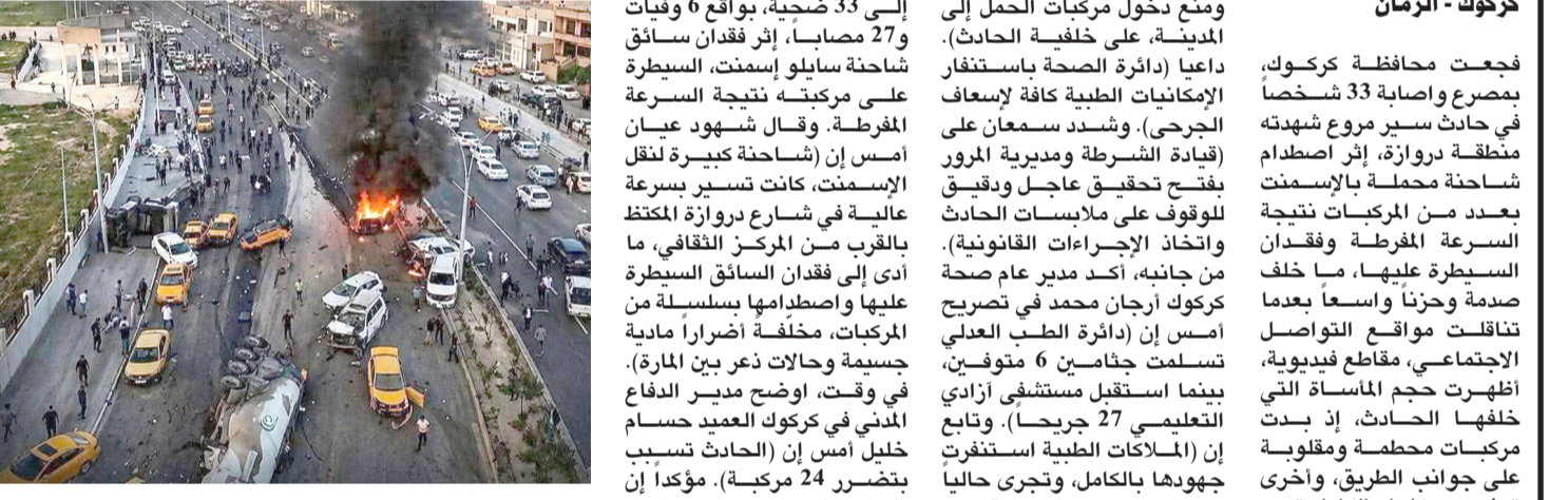
حادث : عشرات المركبات المحترقة نتيجة حادث مروع في كركوك