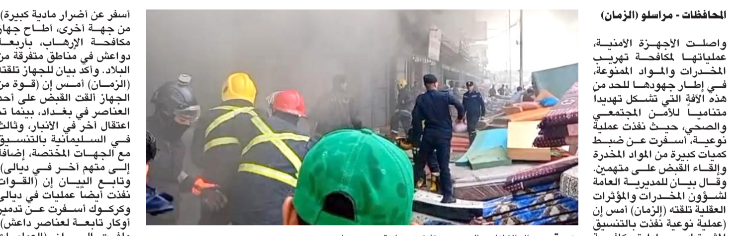
حريق : رجال الاطفاء يعالجون حريقاً قرب ساحة عدن ببغداد

ضمن ناحية العبارة). مضيقاً عن (العملية جاءت استناداً إلى معلومات استخباراتية دقيقة، وبعد استحصال الإذن القضائي، حيث ضبطت الأدوية مخفية بطريقة احترافية داخل حمولة من الأواني المنزلية ومغطاة بغطاء مشمع لغرض التمويه). وأشار إلى أنه (تمت إحالة المركبة والمضبوطات مع المتهمين إلى الجهات المختصة لاتخاذ الإجراءات القانونية اللازمة). من جانبها، أعلنت هيئة المنافذ الحدودية، ضبط خمس حاويات معدة للتهرب في منفذ ميناء أم قصر الشمالي. وقال المتحدث باسم الهيئة علاء الدين القيسي في بيان تلقته (الزمن) أمس إن (المديرية تمكنت وبعد استحصال موافقة قاضي محكمة تحقيق أم قصر، من ضبط خمس حاويات تحتوي دراجات نارية مختلفة الأشكال والأحجام ممنوعة من الاستيراد ومعدة للتهرب).