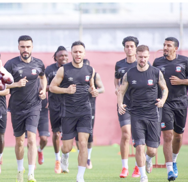
تدريبات: فريق زاخو يجري تدريباته لمواجهة دوري الخليج