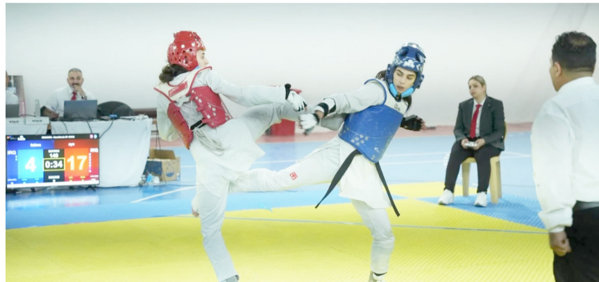
تايكواندو: منافسات التايكواندو للنساء في كركوك

استمرارية هذا التفوق ويُعد هذا الإنجاز دليلاً على التطور المتواصل للتايكواندو في المحافظة، مشيراً إلى أن كركوك باتت تمتلك طاقات واعدة، خاصة في فئة النساء، وقادرة على تمثيل المحافظة على المحافل الخارجية. دليل التطور