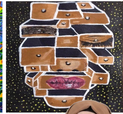
تشكيل: لوحات بريشة آلاء عبد الكريم