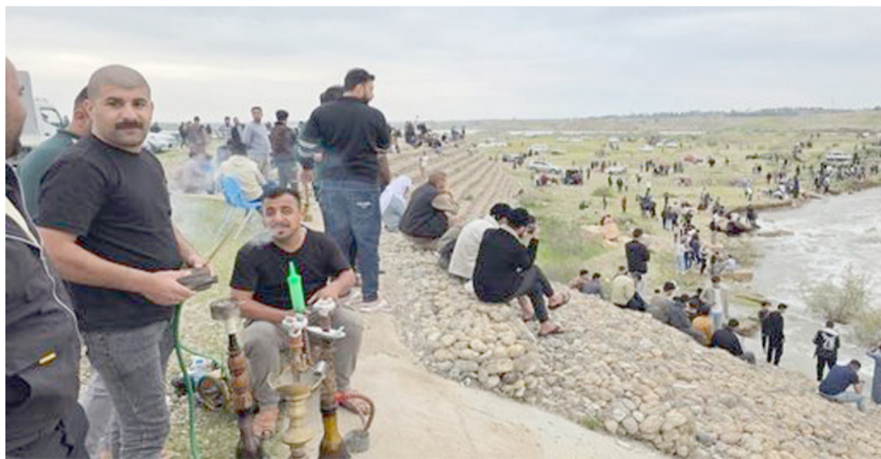
أقبال : سدة الصدور تشهد اقبالاً من المواطنين

وأكد الكروي ان (إنتاج معامل الغاز في وضمان وصول المادة بشكل عادل) .