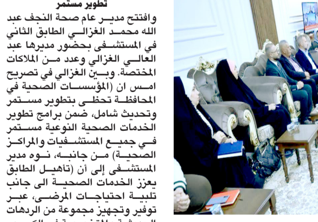
لقاء؛ محافظ النجف يلتقي وفداً إيطالياً متخصصاً