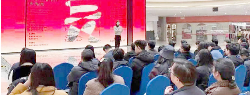
معرض: طلبة تربية القاسية خلال مشاركتهم في المعرض الدولي الرابع في الصين

من العقد الثالث، المزمع إقامته خلال تشرين الأول المقبل، يذكر ان (المذكرة تضمنت تنظيم وإقامة ودعم المؤتمرات والندوات وورش العمل و الدورات التدريبية، إلى