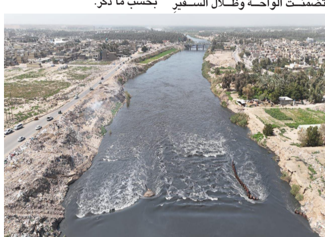
تلوث؛ نهر دجلال بعد معالجة التلوث النقطي

والكوثر. كما جرى تجهيزها بمرافق خدمية و مساحات خضراء، لتكون متنفساً ترفيهياً للعوائل النجفية. هذه المشاريع باتت ضمن توجهات إدارة المحافظة لتعزيز جمالية المدينة، وتوفير بيئة ترفيهية آمنة للمواطنين. مشيراً إلى أن (مجموع المتنزهات التي تم افتتاحها بفضاء الكوفة، وصلت إلى 31 متنزهاً. تشكل إضافة نوعية للبنية التحتية) بحسب ما ذكر.