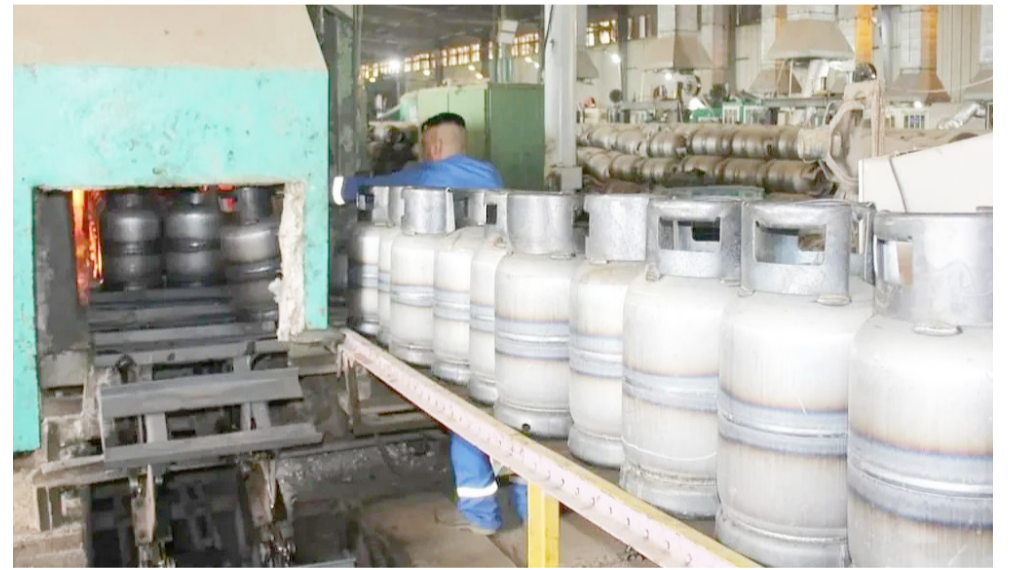
غاز : أسطوانات الغاز في معمل اللانثان