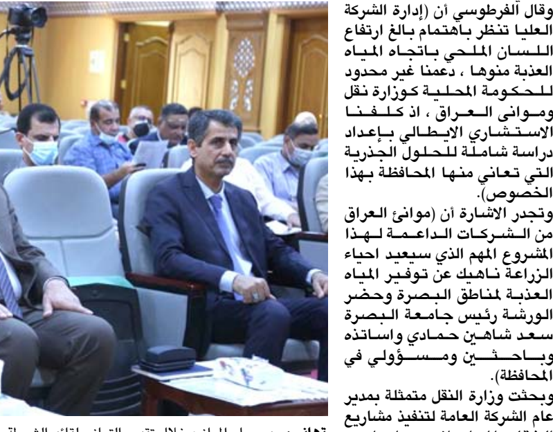
تهاني: مدير عام الموائئ خلال تقديم التهاني لقائد الشرطة

وقال الفرطوسي ان (إدارة الشركة العليا تنظر باهتمام بالغ ارتفاع اللسان المحلي باتجاه المياه العذبة نموها ، دعماً غير محدود للحكومة المحلية كوزارة نقل وموائئ العراق ، إذ كلّفنا الاستثماري الإيطالي بإعداد دراسة شاملة للحلول الجذرية التي تعاني منها المحافظة بهذا الخصوص). وتجدر الإشارة ان (موائئ العراق من الشركات الداعمة لهذا المشروع المهم الذي سيعيد احياء بان يعم الأمان على عراقنا الحبيب وذلك بتطافير جميع الجهات الخيرة والقوات الأمنية التي قدمت وتقديم التحضيات خدمة لعراقنا الحبيب من جانبه قدم قائد شرطة البصرة شكره وامتحانه للمدير العام لموائئ العراق متمنيا للشركة وموظفيها المزيد من التقدم