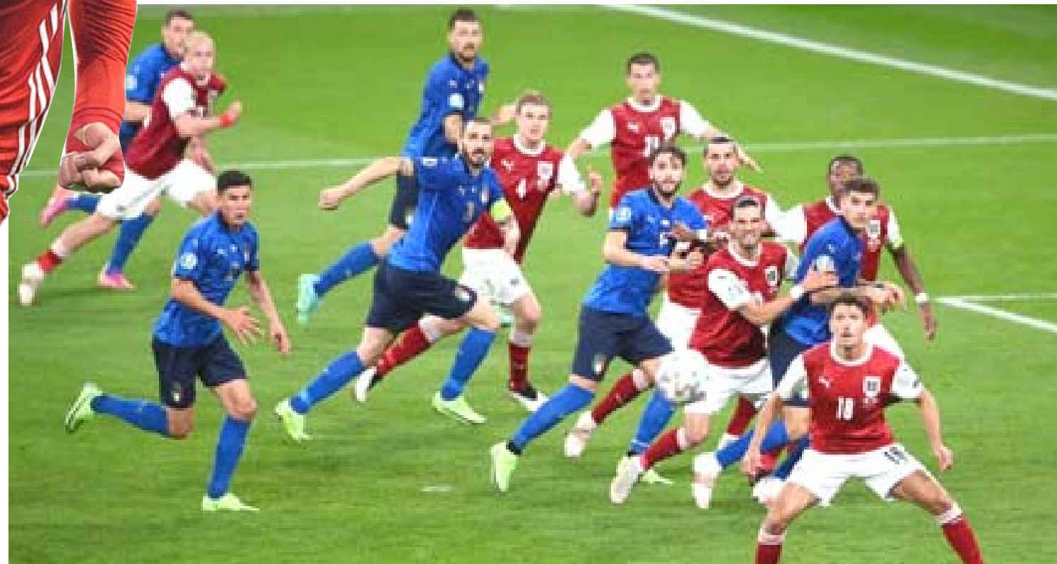
تأمل: منتخب إيطاليا يتأهل بصعوبة إلى الدور المقبل في منافسات يورو