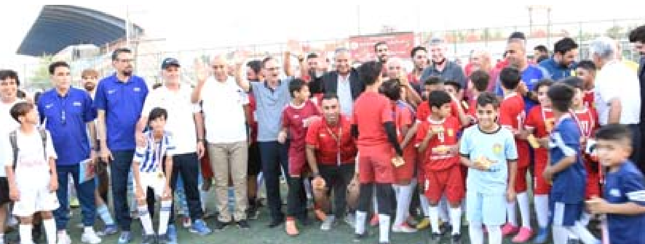
فئة 6: جانب من احتفالية التطيعة لفئة البراعم

عجابه بالدروس العلمية التي تقدم للشباب وتطبيقها بشكل سليم وسلس.