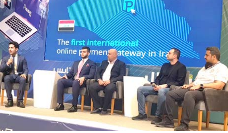
ندوة: جانب من ندوة اطلاق مشروع دفع الفواتير

التجارة الإلكترونية في العراق يقف عند معقبات مهم في عملية التطور ونحن في الشركة نشعر باننا محظوظون لأن نكون جزءً من هذه الرحلة مع رواد الأعمال). وتابع أنه (برغم امتلاكنا منظورا عالميا ، إلا أننا نفكر ونصرف بشكل محلي في كل سوق ندخلها بفضل قدراتنا على فهم منتجات الدفع التي تقدمها وتفصيلها لتلائم إحتياجات كل سوق محلية)، وأضاف (نحن عازمون على أن نستمر بالابتكار بهدف ردم الهوة الشريكة ، ومرونة أكبر في قبول المدفوعات عن طريق ماستر كارد وغيره من البطاقات المحلية المعروفة، وأشار الجوف الى ان (سوق