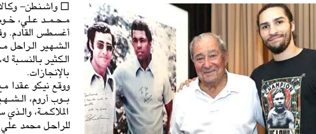
رحيل: عائلة الملاكم محمد علي كلاي

واشنطن- وكالات: أعلن حفيد أسطورة الملاكمة محمد علي، خوضه أول نزال احترافي يوم 14 أغسطس القادم. وقال نيكو علي والوش، حفيد الملاكم الشهير الراحل محمد علي، إن نزاله القادم يعني الكثير بالنسبة له، ويعد امتداداً لإرث جده الحافل بالإنجازات. ووقع نيكو عقداً مع شركة توب رانك، المملوكة من بوب اربينا في ميدان الترويج لنزالات الملاكمة، والذي سيق له الإشراف على 27 نزالاً للراحل محمد علي. واعتبر الشاب البالغ من العمر 20 عاماً، النزال القادم، مسؤولية كبيرة لا يمكن الاستخفاف بها، لان كثيرين سينظرون إليه باعتباره