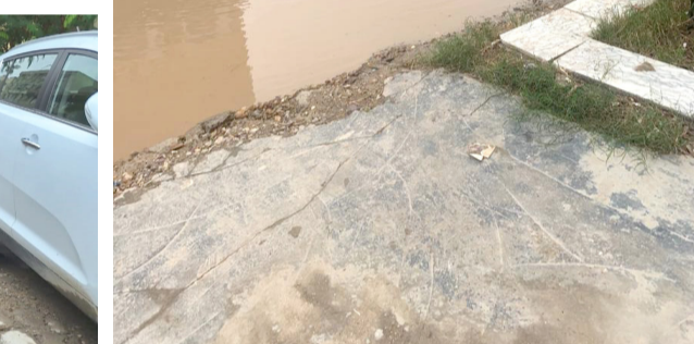
غرق: شوارع تغرق في مناطق من بغداد