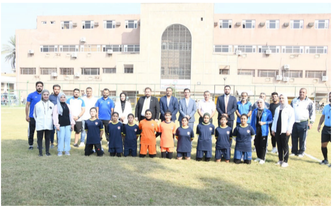
افتتاح: افتتاح البطولة الرياضية بكرة القدم في الجامعة التكنولوجية