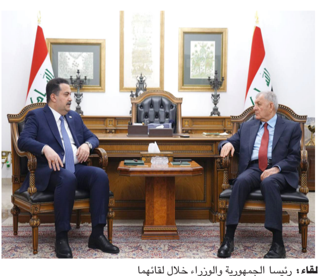
لقاء: رئيسا الجمهورية والوزراء خلال لقائهما

بغداد - ندى شوكت شدد رئيسا الجمهورية عبد اللطيف جمال رشيد ومجلس الوزراء محمد شياع السوداني، على أهمية إجراء انتخابات مجالس المحافظات وتوثير المستلزمات نجاحها وقال بيان تلقته (الزمان) امس ان (الجانبين بحثا خلال اللقاء الذي جمعهما في قصر بغداد ، آخر التطورات على الصعيد الوطني والدولي، وسير التحضيرات والتهيئة لانتخابات مجالس المحافظات المقررة في كانون الأول المقبل، إذ جرى التأكيد توصية المجلس الوزاري للاقتصاد بشأن مشروع اكمال تمويل مشروع التكسير بالمعامل المساعد المتعددة عليه من شركة مصافي الجنوب مع شركة بابانية)، وتابع ان (المجلس وافق على نقاد متكررة تفاهم بين وزارة الكهرباء والاساسية وسير تنفيذ البرنامج الحكومي في مختلف المجالات والصعد. وقال بيان امس ان