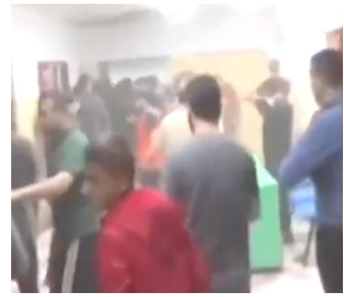
اقتحام: لقطات تلفزيونية لاحتحام القوات الإسرائيلية مستشفى الشفاء.