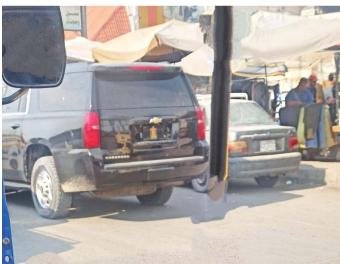
المرور مع التحية: هذه المركبة التي تحمل شعار الجمهورية بدلاً من الرقم المروري القانوني، من المسؤول عنها إذا وقع حادث أو طارئ؟ الصور تم التقاطها من مواطن حريص في الساعة العاشرة وأربعين دقيقة في بغداد.