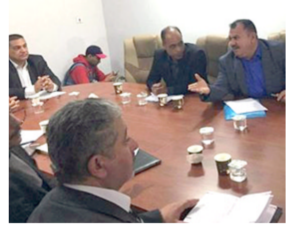
جانب من المؤتمر الفني لدوري الدرجة الأولى لكرة القدم

□ مدن - رويتزن: يعتقد بوريس بيكر، مدرب الصربي نوناك ديوكوفيتش السابق، أن موريا شارابوفا قدفت ثمن خطأها، وتستحق فرصة ثانية عندما تعود إلى منافسات التنس في نيسان، بعد انتهاء إيقافها مدة 15 شهراً، بسبب المنشطات. وسقطت شارابوفا، الحائزة على 5 ألقاب في البطولات الأربع الكبرى، في اختيار للكشف عن سادة ميلدونيوم المحظوظة في بطولة أستراليا المفتوحة 2016، وعاقبها الاتحاد الدولي للتنس بالإيقاف لعامين. وقصفت محكمة التحكيم الرياضية الدولية الامة الروسية بواقع 9 أشهر في تشرين الأول الماضي، ما يعني أنها باتت حرة في العودة إلى التنس اعتباراً من 26 نيسان، وقال بيكر، الحائز على بطولة ويمبلدون 3 مرات، إن قرار السماح لشارابوفا بالعودة إلى