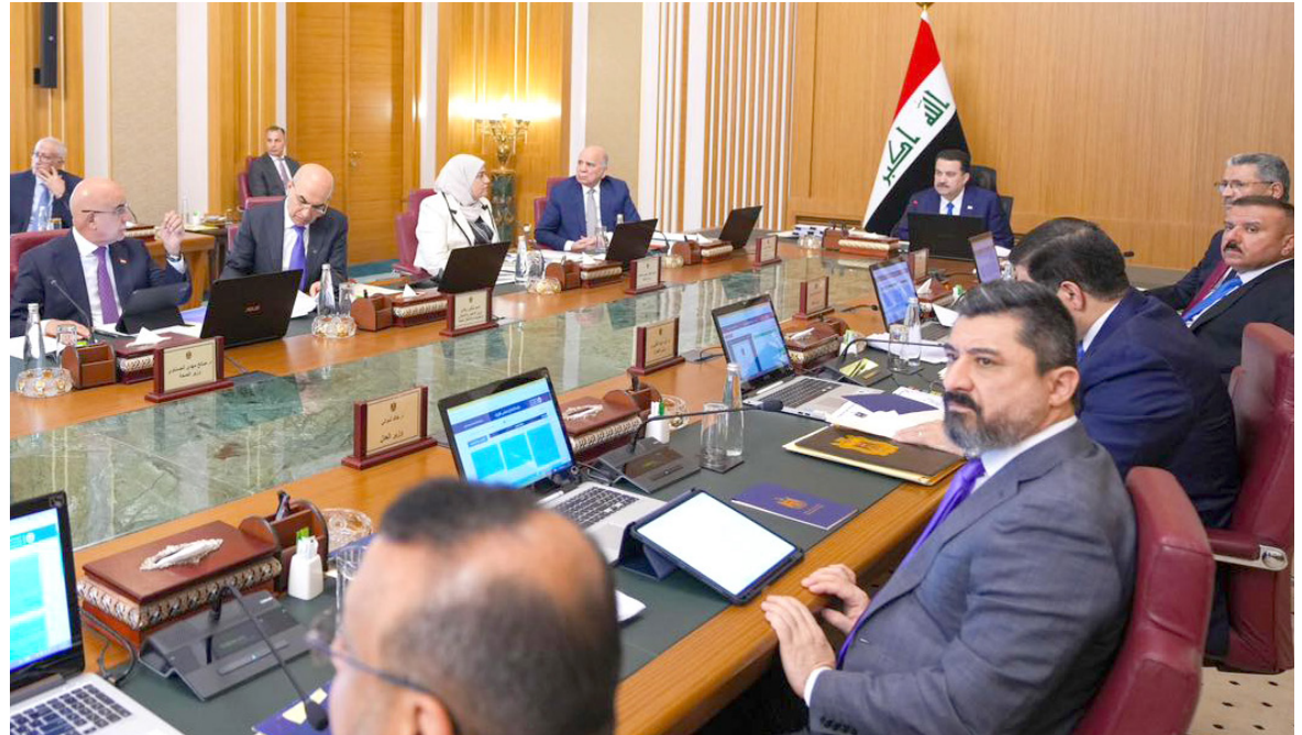
اجتماع : مجلس الوزراء يجتمع الثلاثاء لبحث جدول الاعمال

عادت مخصصات الخدمة الجامعية إلى الواجهة مجدداً، بعد إن أجرى مجلس الوزراء، تعديلاً على قراره رقم 40 لسنة 2026، يقضي بمنحها للمتفرغ بحسب الحاجة الفعلية وحجبها عن غير المستحقين، حيث انار سخط حملة الإلقاب، الذين اعتبروا هذا التعديل مساساً بمستحقاتهم وحقوقهم المكتسبة منذ سنوات. وأكد حملة الإلقاب