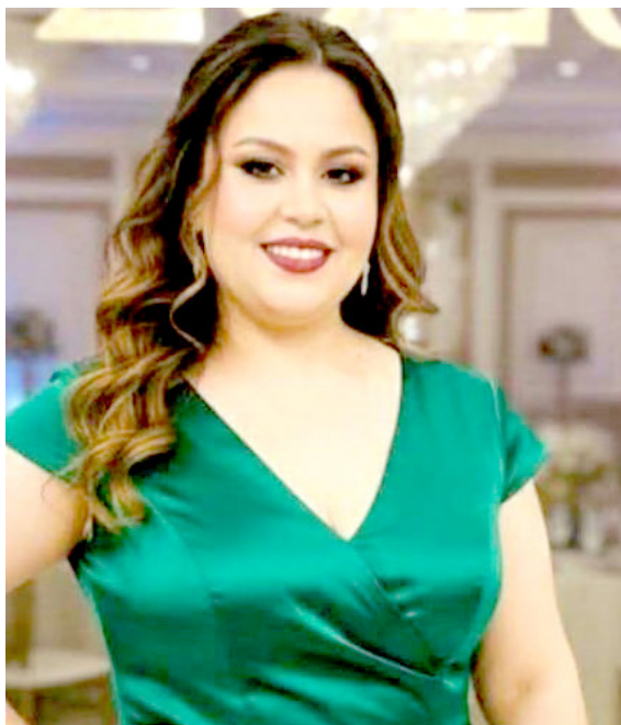
معتبرة أن التفاعل الحي معيار النجاح الأصديق. وعن الأغنية بانها الوقوف أمام الجمهور، حين تردد القاعة كلمات الأغاني،

العراقية ترى أنها أقل تداولاً من الأغنية الشرقية رغم امتلاكها حساً مرهفاً ولحناً قوياً وأداءً مميزاً، ما يمنحها مكانة خاصة في الذاكرة العربية. ويتبدى رأياً متوازناً تجاه موجة الأغاني الحديثة، معتبرة أنها تهيمن على السوق اليوم، لكن المطلوب أن تحمل رسالة فنية لا مجرد إيقاع سريع، وتختتم حديثها بالتأكيد أن حلمها الاستمرار وتمثيل تونس في المحافل العربية والدولية، ويكشف مسار عبيد عن ظاهرة أوسع داخل الغناء المغاربي، حيث يعود جيل شاب إلى المدرسة الكلاسيكية بعد سنوات هيمنة الإيقاع التجاري، مستفيداً من المنصات الرقمية التي أتاحت للأصوات المحافظة على الطرب أن تجد جمهوراً جديداً خارج حدود الجغرافيا. وفي هذا السياق لا تبدو تجربة عبيد مجرد محاولة فردية، بل جزءاً من موجة تعيد تعريف الذاتية، وتوازن بين إرث أم كلثوم ومتطلبات الاستماع السريع في عصر البث الفوري.