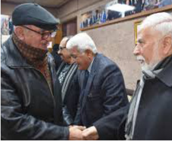
محطات : مسيرة بيات مرعي غنية بالمحطات المضنية

فترات انتعاشة هذا النوع الذي اعتمد على استقطاب فنانسي العاصمة دون الاعتراف بأن مطربة الحي لا تطرب فكانت أغلب العروض القامة في مسارح المدينة تعتمد تقديم اعمال فكرية سطحية مؤنثة بنكات ساذجة تخدم فئة محددة كالشباب والمراهقين فحسب واما في فترة التسعينيات التي كانت خاضعة ايضا لفترة حصار تجسّد في المدينة مسرح ما يسمى بمسرح الفقير والذي يعتمد بالدرجة الاساس على امكانية الممثل بديل ان احد الاعمال التي قدمت باطار هذا المسرح جسدت بلا اي ديكور وهذا ما اتاح لي تاليا ان استبقيت اعمالا لفرقتي (علامات) من وحي هذا المسرح واشترك باحداها وهي مسرحية الشوط السابع في مهرجان مسرح بلا انتاج الدولي الذي اقيم في مصر وبالتحديد بمدينة الاسكندرية عام 2019 وتلت على تاليفا واخراجا .