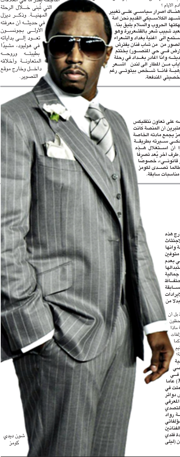
شون ديدى كوزم

□ لوس انجلوس -وكالات - شهدت هوليود خلال السنوات الماضية حالة من الشد والجذب بين النجمين فين ديزل ودوين «ذا روك» جونسون، وهما من أبرز أبطال سلسلة الحركة الشهيرة Fast & Furious. الخلاف لم يكن خفياً، بل تابعتها وسائل الإعلام والجمهور عن قرب نتيجة التوتر الذي ساد أجواء العمل في تلك الفترة، حيث ظهرت اختلافات واضحة في طريقة إدارة المشاهد والتعامل مع متطلبات الإنتاج وتوزيع المساحات الفنية على الشاشة، ما انعكس لفترة على العلاقة الشخصية بين النجمين. ورغم تلك الأجواء المشحونة التي رافقت تعاونهما في السلسلة، فقد بدأت الخلافات تتراجع تدريجياً، وظهر ذلك وفقاً لموقع البوابة بعد مشاركة ذا روك في فيلم Fast X، الأمر الذي اعتبره المتابعون مؤشراً واضحاً على عودة الود واستعادة الروح المهنية بين الطرفين. الطهور المفاجئ لجونسون في الجزء الأخير حمل رسالة غير مباشرة للجمهور بشأن الأبواب لم تُغلق تماماً أمام التعاون و تعزز ذلك بشكل أكبر عقب طرح فيلم Smashing Machine، حيث وجّه فين ديزل رسالة علنية عبر حساباته على مواقع التواصل الاجتماعي عبّر فيها عن تقديره الكبير لزميله، مؤكداً أن الهدايا الحقيقية في حياة الفنان ليست الجوائز أو الأعمال الناجحة بقدر ما هي العلاقات التي تُبنى خلال الرحلة المهنية. وذكر ديزل في حديثه أن معرفته الأولى بجونسون تعود إلى بداياته بطيئته وروحته المتعاونة وأخلاقه داخل وخارج موقع التصوير.