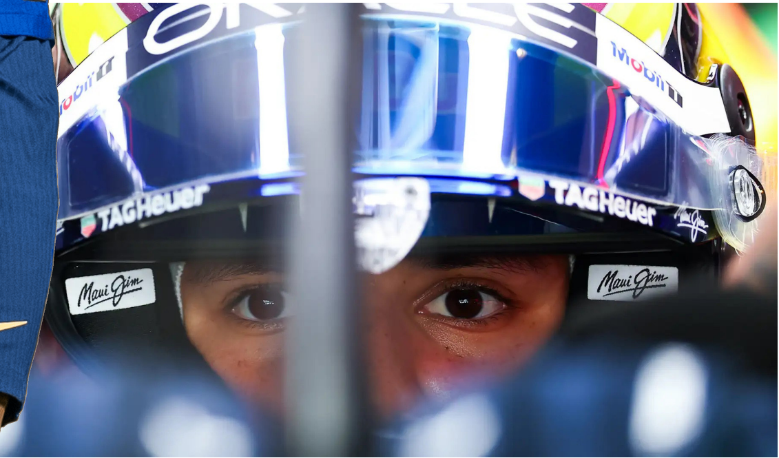
بطل: سائق ريد بول الجديد يبدى حمسه لمزاملة بطل العالم