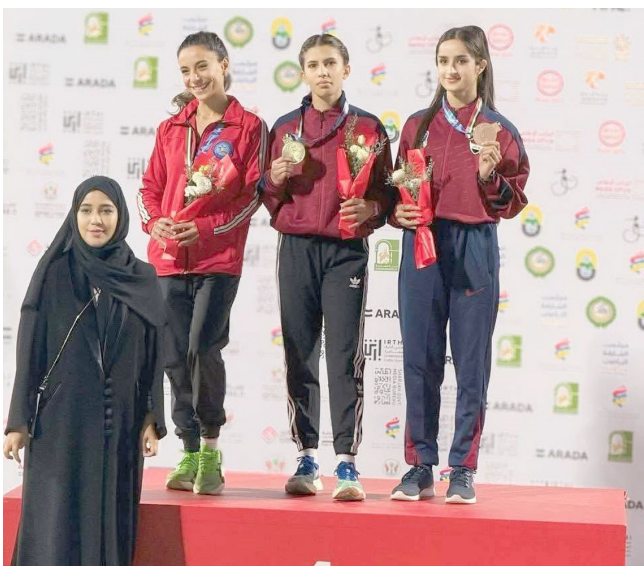
تتويج. جانب من تتويج نادي الفتاة في دورة الاندية بالشارقة