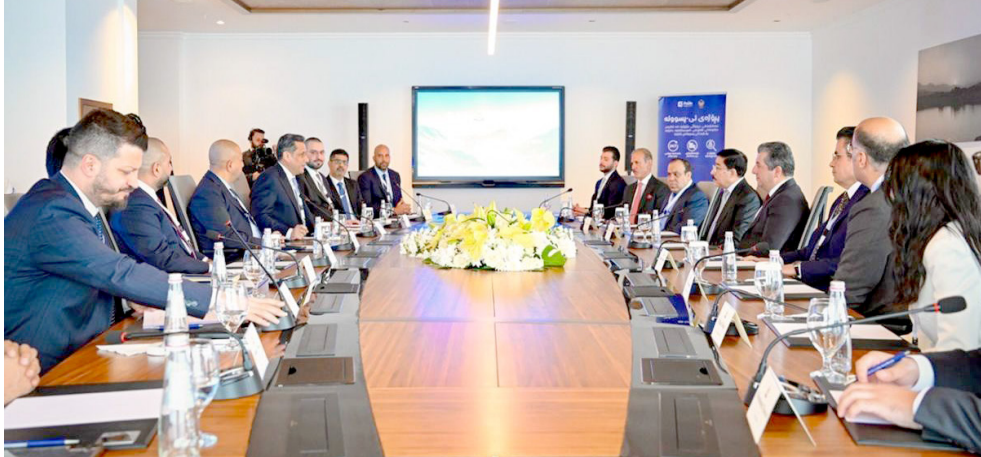
ر : ال

أربيل - فريد حسن من المقرر ان يكون قد اجتمع امس اجتمع رئيسي الحزب الديمقراطي الكردستاني (البارتسي) مسعود البارزاني، مع رئيس الاتحاد الوطني الكردستاني (اليكتي) بافال الطالباني في أربيل، لحسم منصب رئيس الجمهورية.