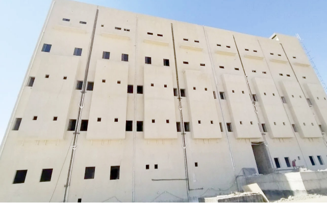
مستشفى : توقف العمل في مستشفى ديالى الحكومي

الثاني من العام الجاري، متأثرة بجروق بليغة غطت معظم أنحاء جسدها)، وتابع البيان إن (الحكم بحق المدان صدر استنادا لأحكام المادة 406 على واحد من قانون العقوبات رقم 111 لسنة 1969 المعدل). وفي محافظة الأنبار، أصدرت محكمة جنابات (الحكم بحق المدان إيع، لـ لمدة ثلاث سنوات بحق مدانة من جريمة يعمل طبيباً، عن جريمة قتل زوجته الطيبية بعد حرقها داخل مركبتها)، وأشار إلى إن (الجاني أقدم في منتصف شهر كانون الأول من العام الماضي على سكب مادة اللترزين على زوجته وهي داخل مركبتها، ثم أضرم النار فيها عمداً، وبرغم محاولات إنقاذها، فارقَت الحَـيَـاة عليها الحياة مطلع شهر كانون