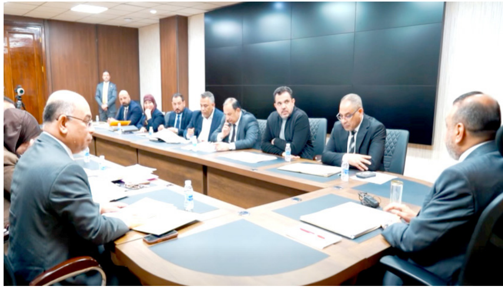
اجتماع : وزير التربية يترأس اجتماعاً للمصادقة على منح الملاكات التدريسية استحقاقاتهم المالية

قسي مندر صادق وزير التربية وكاللة، احمد الاسدي، على منح 1562 من الملاكات التربوية استحقاقاتهم المالية، ضمن صندوق التربية المركزي، وذلك ضمن تخصيصات الصندوق لشهري كانون الثاني وشباط في إطار دعم المواطنين التربويين المستحقين. وذكرت وزارة التربية في بيان تلقته (الزمان) امس ان (المصادقة شملت التصويت على 1543 حالة خاصة بعمليات جراحية، إلى جانب سبع حالات استثنائية، وحالتي دعم للإبداع، فضلاً عن خمس حالات حريق، ومثلها حالات زواج.