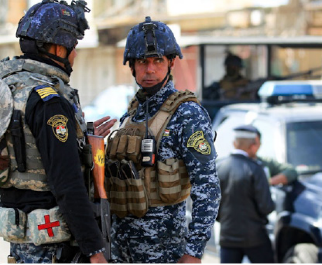
واجب: قوات أمنية في مهمة نوعية

قرار قاضي محكمة تحقيق نينوى المختصة بقضايا النزاهة، حيث تمكن فريق من مديرية تحقيق نينوى من ضبط الموظف بعد إقدامه على تسلم مبلغ مالي مقابل وعد بإصدار أمر نقل لموظف يعمل في إحدى الدوائر الحكومية.