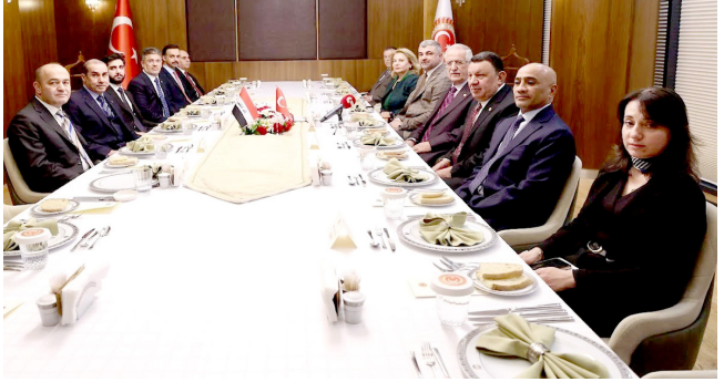
لقاء : سفير العراق لدى أنقرة خلال لقائه رئيس مجموعة الصداقة البرلمانية

مشيراً إلى ان (الاستثمار في التقنيات الجيومكانية والمبن الذكية يمثل أحد أهم ركائز التنمية المستدامة، وتأتي هذه التقنيات كحلقة وصل بين القطاعين العام والخاص، مما يساهم في تعزيز النمو الاقتصادي، وتحسين الخدمات، بما يساهم في تحقيق التنمية المستدامة في العراق).