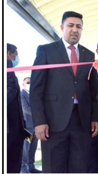
افتتاح؛ محافظ بغداد يفتتح مدرسة في حي الجامعة

بغداد- قصي منذر افتتح محافظ بغداد محمد جابر العطا عدد من المدارس النموذجية في منطقتي حي الجامعة وشارع فلسطين بسعة 8 أصفاء، وهددة إنجاز قياسية ونقل بيان تلقته