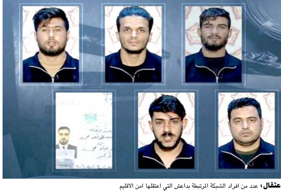
اعتقال: عدد من افراد الشبكة المرتبطة بداعش التي اعتقلها امن الاقليم

اربيـل- فريـد حسـن كشف رئيس حكومة اقليم كردستان العراق مسرور البارزاني، عن تفاصيل جديدة بشأن الشبكة المرتبطة بتخفيف داعش التي فككتها قوات الامن الكردية. وقال بارزاني في بيان (بعد عملية أمنية دامت اشهرا تمكنت قواتنا من احباط مخطط ارهابي في اربيل والذي تم وضعه في سوريا وتم توجيه الأوامر بتنفيذه للمجموعة الإرهابية التابعة لتخفيف داعش والتي هي حاليها رهن الاعتقال وتخص للتحقيقات)، وأكد مجلس امن اقليم كردستان، اعتقال شبكة تضم عدداً من عناصر تنظيم داعش قال إنهم كانوا يخططون لتنفيذ هجمات إرهابية في الإقليم، مضيفاً تسجيلات لاعتراقاتهم قال بعضهم فيها إنه نسق مع اشخاص من تركيا وأنهم استخدموا الأراضي السورية والإيرانية للنقل.