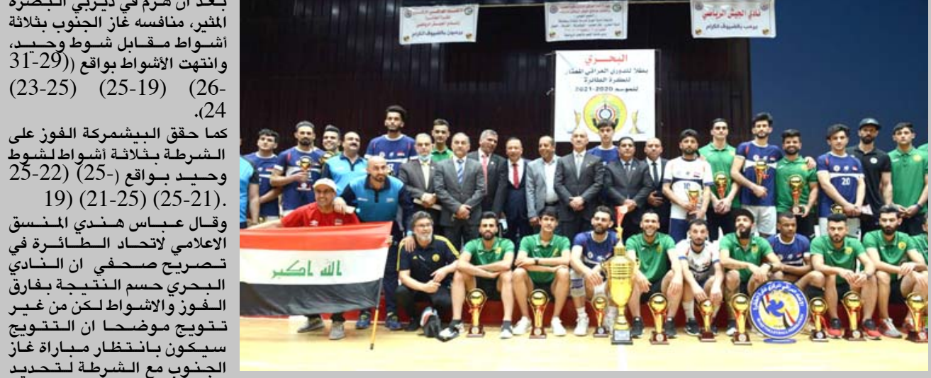
إحتفال: جانب من إحتفال فريق البحري بنبيل لقب دوري الطائرة

بغداد - الزمان شارك وزير الشباب والرياضة عدنان درجال الاحتفالية التي اقامها اتحاد كرة الطائرة بعد حسم فريق البحري للقب وحل