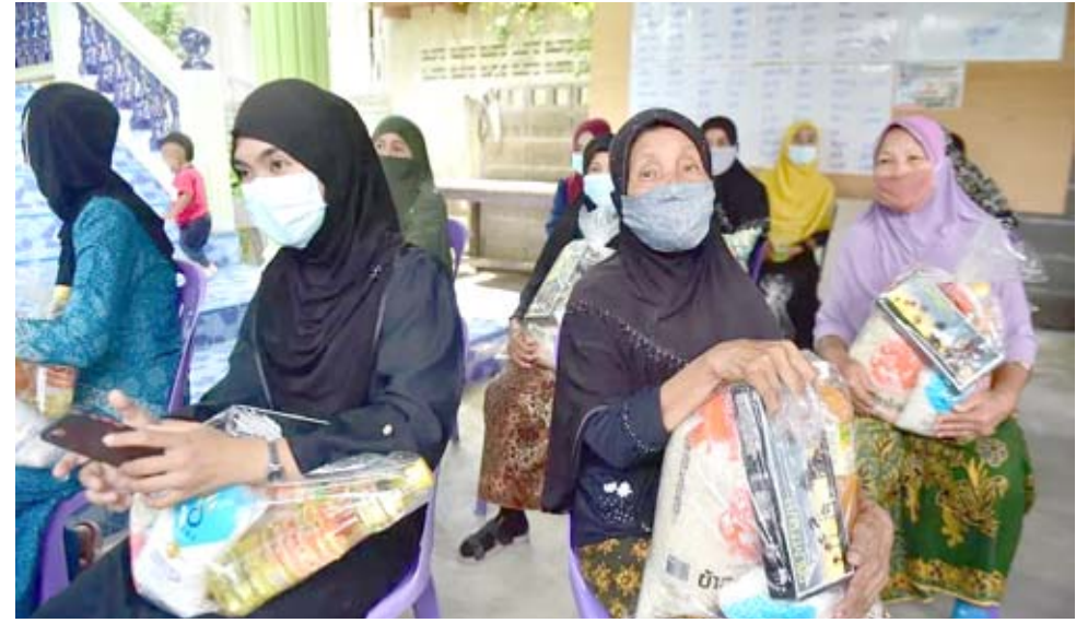
مواد غذائية: نساء مسلمات في تايلند يتسلمن مواد غذائية قبل حلول الشهر الفضيل

مانريد قوله الآن، هو أن مسيات عودة داعش لازالت قائمة، والناس الذين عاشوا أسوأ الظروف الحياتية والمعيشية والانسانية لازلوا يعانون، هناك الالف المهجرين من ديارهم يسكنون الصحراء والبادية، ولم تعالج قضيتهم بشكل منطقي ومعقول، والذين يتحدثون باسم المهجرين في السلطة ويجلس النواب هم هم نفس اللغة الخطابية ونفس السلوك الاتهامي، لكنهم يعيدون عن معاناة هؤلاء البشر وهم بالآلاف، وهناك اعداد من المهجرين لا احد يعرف مصيرهم، ورويا كارونا بات يدخل الي خيم المهجرين، يعطي تصور بأن اللاوعي لازل يخيم على اصحاب القرار في الكتل والأحزاب والحكومة، وإن استمرار التقاضي مع معالجة هذه المسألة الهامة، يعني ذلك شتتا أم بيتنا عودة داعش أو أي سمي اهرابي آخر، وهذا لا يعني إن هؤلاء الناس مهينون لذلك، فهم أكثر من غيرهم احترقوا بنيران الأرهاب، وإنما مانعنية، إن هذا الوضع المناسوي يشكل ارضية خصبة لداعش ولكل المتصدين بالعراق كوطن ووحدة جغرافية، الأهم في هذا الوقت كي لا تختلط الأوراق، البدء بحل قضية المهجرين وعودتهم لديارهم، وما أهله الحياة هو عندما يمنع الانسان من داره واهله