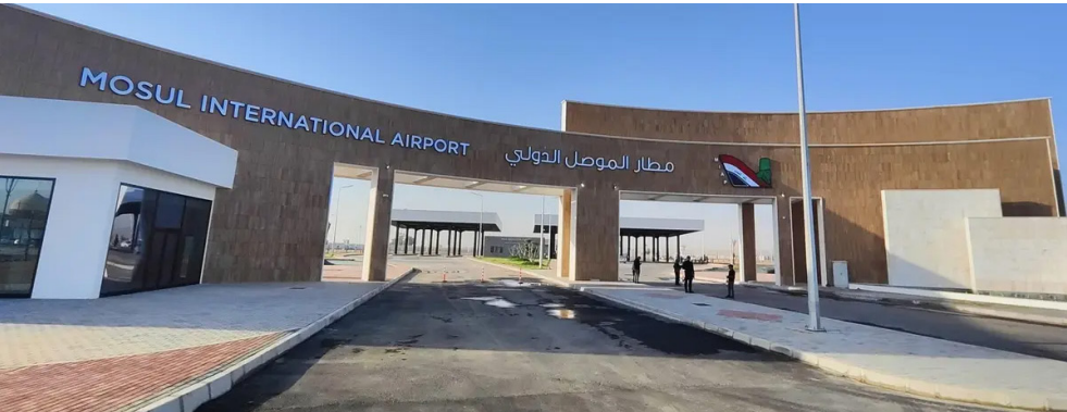
حجم : مطار الموصل بحلته الجديدة

في الحياة مثالي الكامل. نحن نعمل بكل جهدنا وإصرارنا، لكننا بحاجة إلى دعم أهالي نينوى لمطاميرهم عن السفر من خلاله. الرحلات حاليا مقصورة على العاصمة بغداد، وقد علمنا على تسهيل إجراءات السفر، فالسفر يخضع لتفقيض واحد فقط قبل الإقلاع، وهو أسهل بكثير مقارنة بالمطارات الأخرى التي تفرض ثلاث عمليات تفقيش قبل الصعود للطائرة.