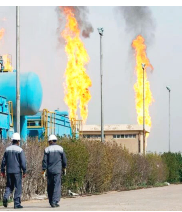
حرق: أحد مصافي النفط يحرق الغاز المصاحب مما يسبب التلوث

أعلنت هيئة التراث في ميسان بأن قسمها إجراء كشف موقعي لعدد من المواقع الأثرية بناحية المشرّح 22كم عن العمارة وقال أعلام الهيئة للزمان ان هذا الإجراء جاء بتوجيه من رئيس الهيئة العامة للآثار والتراث علي عبيد شلغم مششيرا الى ان ملاكات مفتشة آثار وتراث ميسان اجرت كشف موقعي مشترك بالتعاون مع قسم شرطة حماية الآثار والتراث ميبنا الى انه تشمل عدد من المواقع الأثرية في ناحية بشوش، وهي: تل محبط، تل أبو المشرّح، تل العيلة، بناحية المشرّح – بازركان بغية توثيق المواقع الأثرية ومتابعة إجراءات حمايتها والإطلاع على واقعها الحالي، بما يسهم في الحفاظ على الإرث الحضاري ومنع أي تجاوزات أو أضرار محتملة. وأكد الاعلام الى ان مفتش آثار الآثار والتراث ميسان تاتي ضمن خطة متابعة مستمرة للمواقع الأثرية وبالتنسيق مع الجهات الأمنية المختصة، لضمان حمايتها والحفاظ عليها من أي تجاوزات.