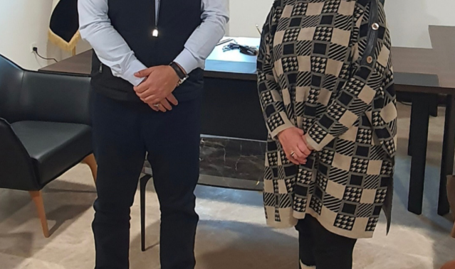
حديث : مدير مطار الموصل يتحدث إلى (الزمان)

لا يوجد عمل يخلو من التحديات، ولا شيء يخلو من التحديات.