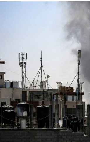
غارة «الدخان» الصاعد جراء غارات إسرائيلية على رفح بجنوب قطاع غزة

قواتهم ومؤسساتهم في المؤسسات الحكومية. وتعتبر المفاوضات، وصولا إلى وقوع مواجهة عسكرية قبل التوصل إلى إتفاق جديد. وفي القدس أعلن الجيش الإسرائيلي صباح أمس الجمعة أنه شن ضربات خلال الليل على «مناخية أشخاص» وقتل ثلاثة منهم في منطقة رفح بجنوب قطاع غزة، وذلك في ظل وقف إطلاق النار في القطاع.