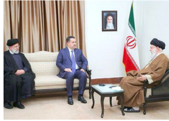
استقبال : المرشد الإيراني يستقبل رئيس الوزراء في طهران

المساعدات لغزة). كما التقى السوداني، المرشد الإيراني علي الخامنئي وإشار بيان تلقته (الزمان) امس إلى ان (اللقاء بحث تطورات الأوضاع في غزة). ووصل السوداني إلى العاصمة الإيرانية طهران امس في زيارة اقليمية لبحث التعاون على القطاع. واستقبل السوداني في وقت سابق من جولته التي بدأها امس وزير الخارجية الأمريكي انطوني بلينكن الذي وصل بغداد في زيارة جوبت برفض شعبي في ساحة التحرير. وقال بلينكن انه (عقد اجتماعا جيدا ومثمرا وصريحا مع السوداني ، ركز على نقطتين أولهما إعادة تأكيد التزامنا بشرائكتنا مع العراق، والهجما غير مقبولة على الإطلاق التي تستهدف قواتنا ،حيث سنتخذ كافة