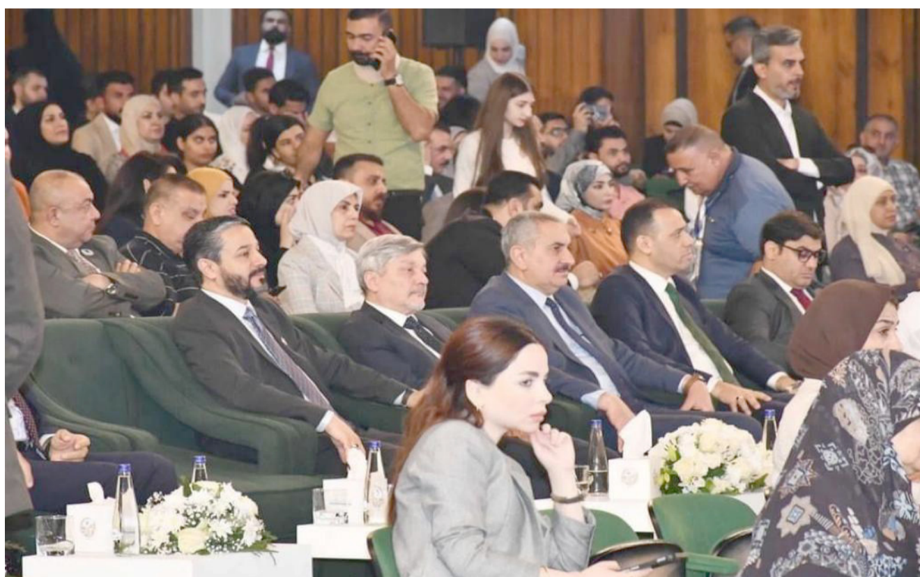
جلسة وزير التعليم يحضر الجلسة الثانية في جامعة بغداد

الإحساء، جامعة الملك فيصل، غرفة الإحساء، المؤسسة العامة للري، مكتب وزارة البيئة والمياه والزراعة، فرع وزارة التجارة، شرطة الأحساء، المركز الوطني للنخيل والتمر، الهيئة العامة للغذاء والدواء، تجمع الإحساء الصحي (، والتي نفذت خطتها لتنظيم المزارع وفق اليات متبعة تم من خلالها تفويج المركبات ودخولها إلى ساحة المزارع والتأكيد على التعبئة في العيوات الخرونية المطابقة لمعايير صحة البيئة، إضافة إلى اختيار عينات عشوائية لفحصها بمختبر الجودة من قبل لجنة مبدئية متخصصة بفحص التمر وتحديد المستوى لها .