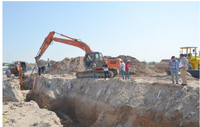
مشروع، جانب من مشروع الخط الناقل

معالجة الفيضانات كما هناك الكثير من الخطوط الناقلة غير مفعلة، واكد الوائلي، ان المحافظة عالجت البنى التحتية في منطقة الجديبات خلال العام الماضي، لإنهاء معاناة الفيضان والغرق خلال مساطق الأمطار، لافتا الى (وضع خطة لحل مشكلة حي الامير الذي يعاني من مشكلة تصميمية بسبب شارع 100 الذي يعتبر