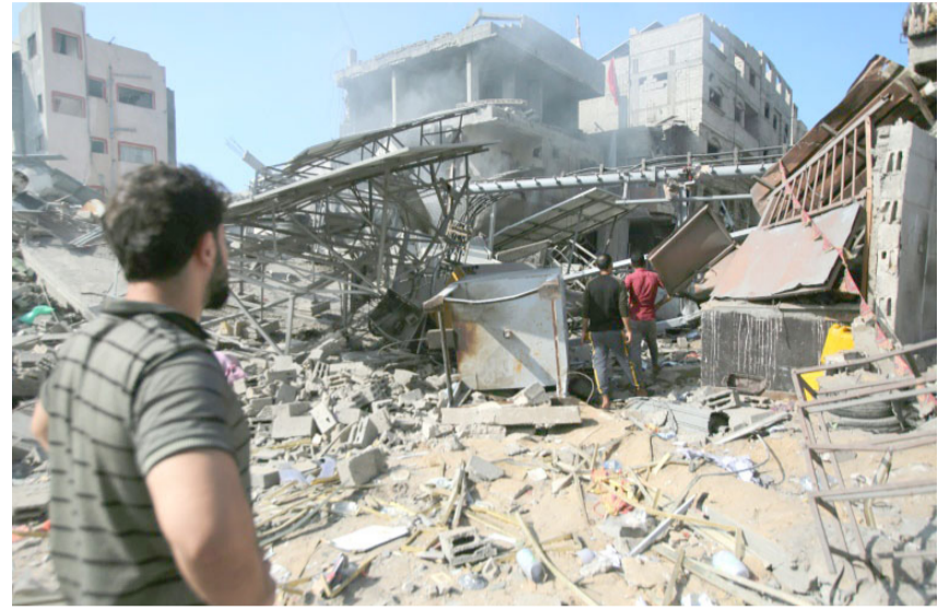
دمار: اثار الدمار الذي لحق المباني المدنية في غزة بالقصف الجوي الاسرائيلي

طلبت إسرائيل باتخاذ تدابير لتقليل الخسائر بين المدنيين في غزة، ومضى إلى القول (اهمية الوصول إلى هذات إنسانية مؤقتة في غزة). فيما دعت فرنسا إلى هدنة إنسانية فورية للحرب بين إسرائيل وحماس. وطالبت وزيرة الخارجية كاترين كولونا بعد اجتماع مع نظيرها القطري محمد بن عبد الرحمن بن جاسم آل ثاني في الدوحة إن (هدنة إنسانية فورية ومستدامة واثمة ، ويجب أن تكون قادرة على أن تؤدي إلى وقف لإطلاق النار)، وأشارت إلى أن (بلادها تعمل على اعتماد نص بهذا الصدد في مجلس الأمن التابع للأمم المتحدة، التي تقسم بشأن هذا الموضوع منذ بداية الحرب).