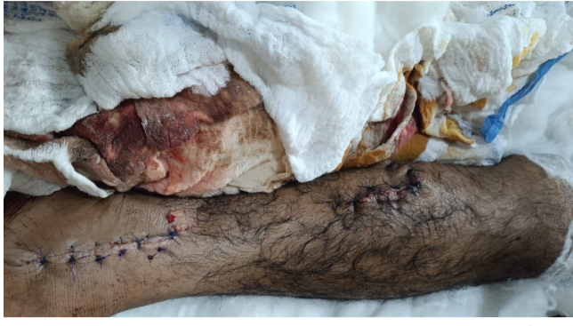
جراحة الساق المصابة بعد اجراء العملية الجراحية

الغزالي : تم اصلاح الانسجة و العضلات و الاوتار بنجاح و بوقت قياسي ، في عمليات الطوارئ في مدينة الصدر الطبية . أكد الفريق الطبي المشترك : ان العمليات تمت بنجاح كبير و الرجل المصاب الآن بحالة جيدة و لا توجد اية مضاعفات ، و تم نقله الى غرفة العناية المركزة تمهيدا لنقله لدرجة جراحة الكسور . وقدموا شكرهم الى الكوادر الطبية و الجراحية و كوادر التخدير و الكوادر التمريضية و الصحية و الخدمية المشاركة ، و كل من ساهم في إنجاح هذه العملية الكبيرة .