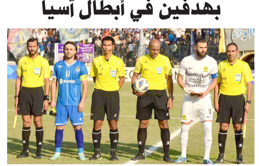
طاقم : قائدا الفريقين يتوسمان طاقم التحكيم في مباراة اربيل