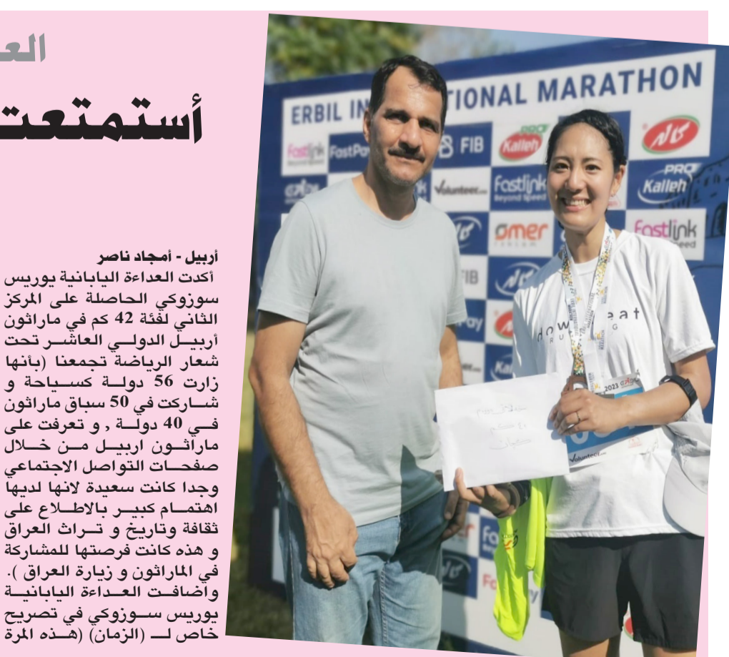
أربيل - امجد ناصر أكدت العداة اليابانية يوريس سوزوكي الحاصلة على المركز الثاني لفئة 42 كم في ماراثون أربيل الدولي العاشر تحت شعار الرياضة تجمعنا (بانها زارت 56 دولة مسيحية وشاركت في 50 سباقاً ماراثون في 40 دولة ، و تعرفت على ماراثون اربيل من خلال صفحات التواصل الاجتماعي وحدا كانت سعيدة لانها لديها اهتمام كبير بالاطلاع على ثقافة وتاريخ و تراث العراق وهذه كانت فرصتها للمشاركة في الماراثون و زيارة العراق ) . وأضافت العداة اليابانية يوريس سوزوكي في تصريح خاص لـ (الزمان) (هذه المرة

خلال الترويج وهذا ما شاهده من خلال مشاركاتي العديدة في اغلب السباقات في العالم ، ومع هذا انها تجربة جدا جميلة لتواجدي هنا وحصولي على المركز الثاني لفئة 42 كم و مشاهدة بعض المناطق في العراق و اتمنى المشاركة في السباقات القادمة وهذا الموعد سيصادف مع موعد زوجي لذا احاول المجيء مع زوجي للمشاركة) . ونشرت العداة اليابانية يوريس سوزوكي على حسابها بالانستغرام عدد من الصور والفيديوهات عن مشاركتها و تجوالها في عدة امكان في اربيل وخاصة في قلعة اربيل و شارع الاسكان و التصوير