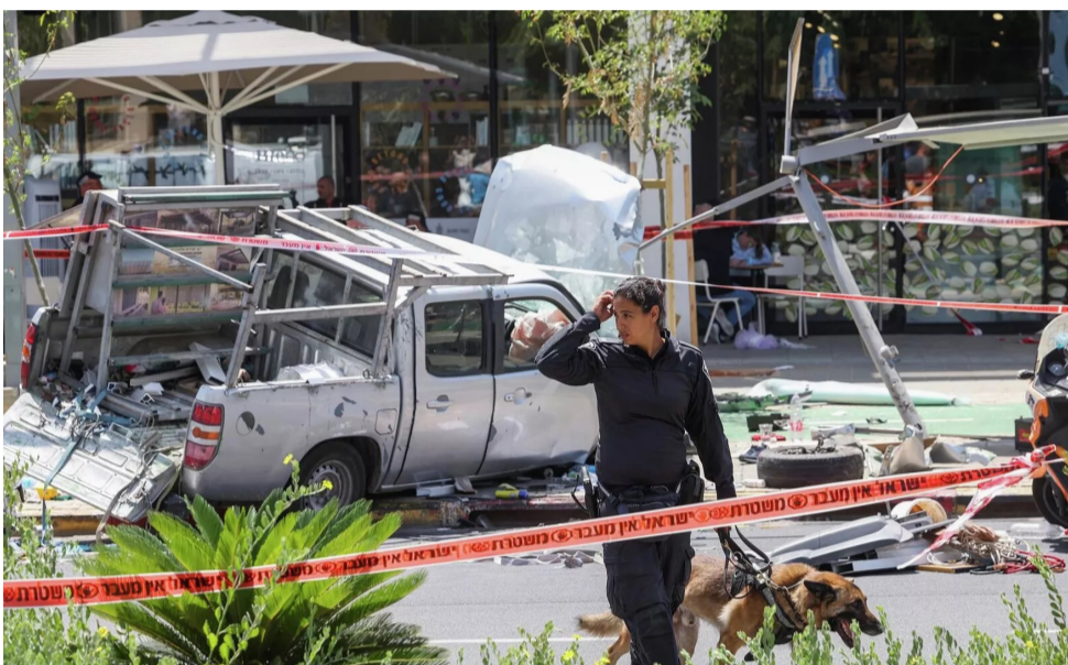
شرطة الشرطة الاسرائيلية تنتشر في موقع الحادث

قتل فلسطيني في القدس الشرقية طعنا بسكين قرب محطة وقود. ومنذ بدء الحرب في السابع من تشرين الأول/أكتوبر حذر هجوم غير مسبوق حركة حماس داخل إسرائيل، تصاعدت وما زالت الشرطة تضرب طوقا أمنيا في المنطقة التي وقع فيه الهجوم فيما توجه رئيس الشرطة الأقل بنيان جنود أو مستوطنين إسرائيليون وفق وزارة الصحة