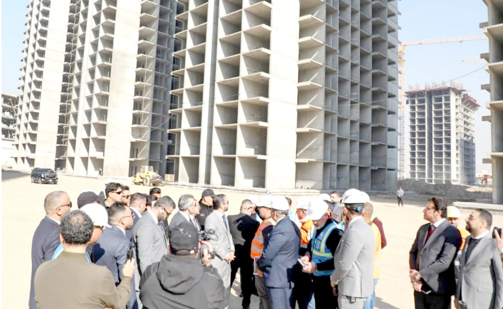
جولة : وزير التعليم العالي خلال جولته في مشروع مدينة الأخوة السكنية

وقال العبودي خلال مؤتمر امس (الشروع بإجراءات التنسيق مع المصرف العقاري والمصرف العراقي للتجارة، لتأمين القروض المصرفية اللازمة للتدريسيين والموظفين الراغبين بالتسجير على الوحدات السكنية ضمن المشروع). مبينا ان (مشروع مدينة الأخوة السكنية يتضمن نحو 22 ألف وحدة سكنية موزعة بين 254 نباية، وفق رؤية تخطيطية متكاملة تراعي الجوانب السكنية والخدمية والبيئية، بما يحقق بيئة معيشية متكاملة تلبي احتياجات المتنسيبين وتسهم في تعزيز الاستقرار الوظيفي