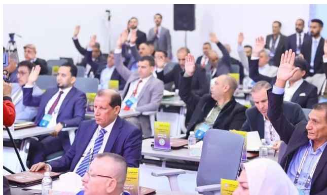
هيئة: اجتماع سابق للهيئة العامة في اتحاد الكرة