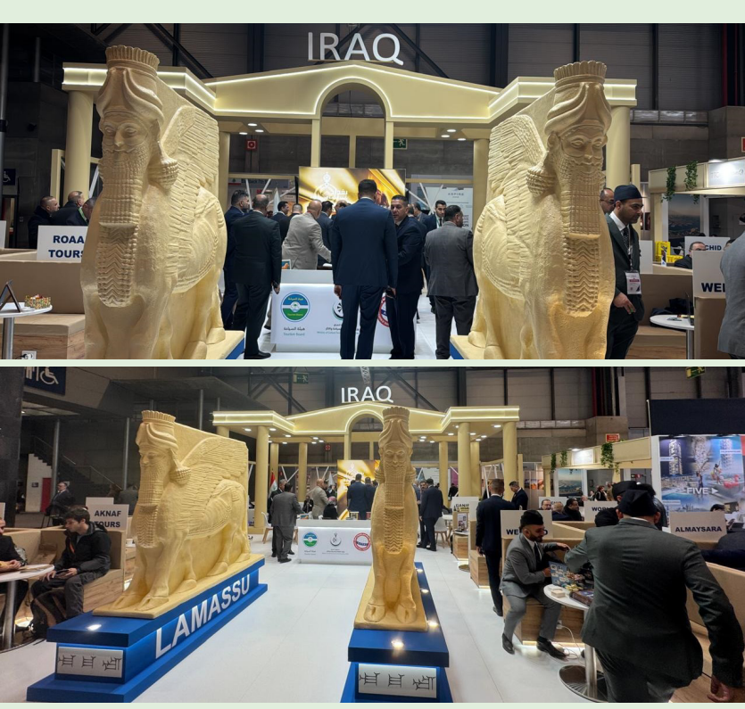
معرض: شركات عراقية بمعرض سياحي دولي