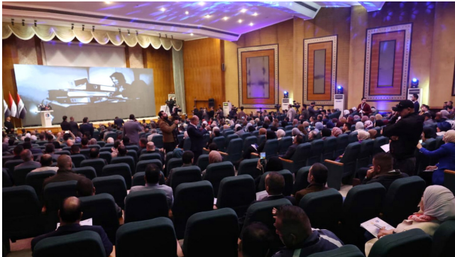
احتفال: جانب من احتفال الوزارة بالمشروع