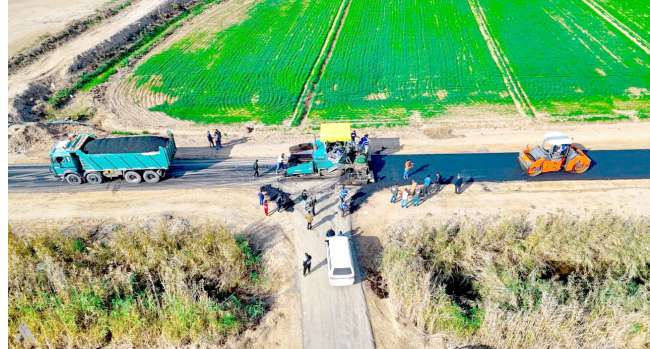
اكساء : ملاكات امانة بغداد تنجز اكساء شوارع في قضاء المدائن

اكساء شوارع واضاف البيان ان (الأعمال شملت ايضا إنجاز اكساء شوارع منطقة الخنساء ومدخلها الرئيسي، وإكساء الطريق المقد من مدرسة التقى الابتدائية . وصولا إلى سوق الكسرة في مركز القضاء، وفق المواصفات الفنية المعتمدة). وأكد العطاوي (استمرار المحافظة بتنفيذ مشاريع