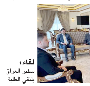
لقاء: سفير العراق يلتقي الطلبة