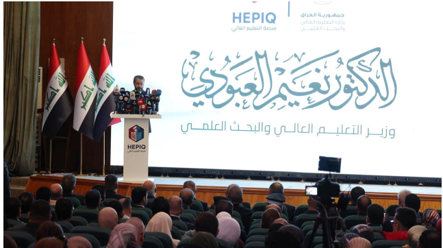
كلمة: وزير التعليم يلقي كلمة خلال إطلاق مشروع الحوكمة الرقمية الشاملة

عدد من المؤسسات التعليمية)، وستشهد توسيع نطاق الحوكمة الرقمية لتشمل خدمات إضافية، وتطوير البنية التحتية التقنية، وبناء قدرات الملاكات البشرية عبر برامج تدريبية متخصصة، بما ينسجم مع توجهات الحكومة في التحول الرقمي وبناء مؤسسات