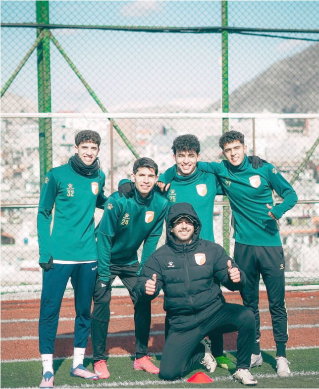
تدريبات: فريق الكرة يجري تدريباته استعدادا لمواجهة دوري النجوم

بقية الخبر على الموقع الالكتروني لجريدة (الزمان)