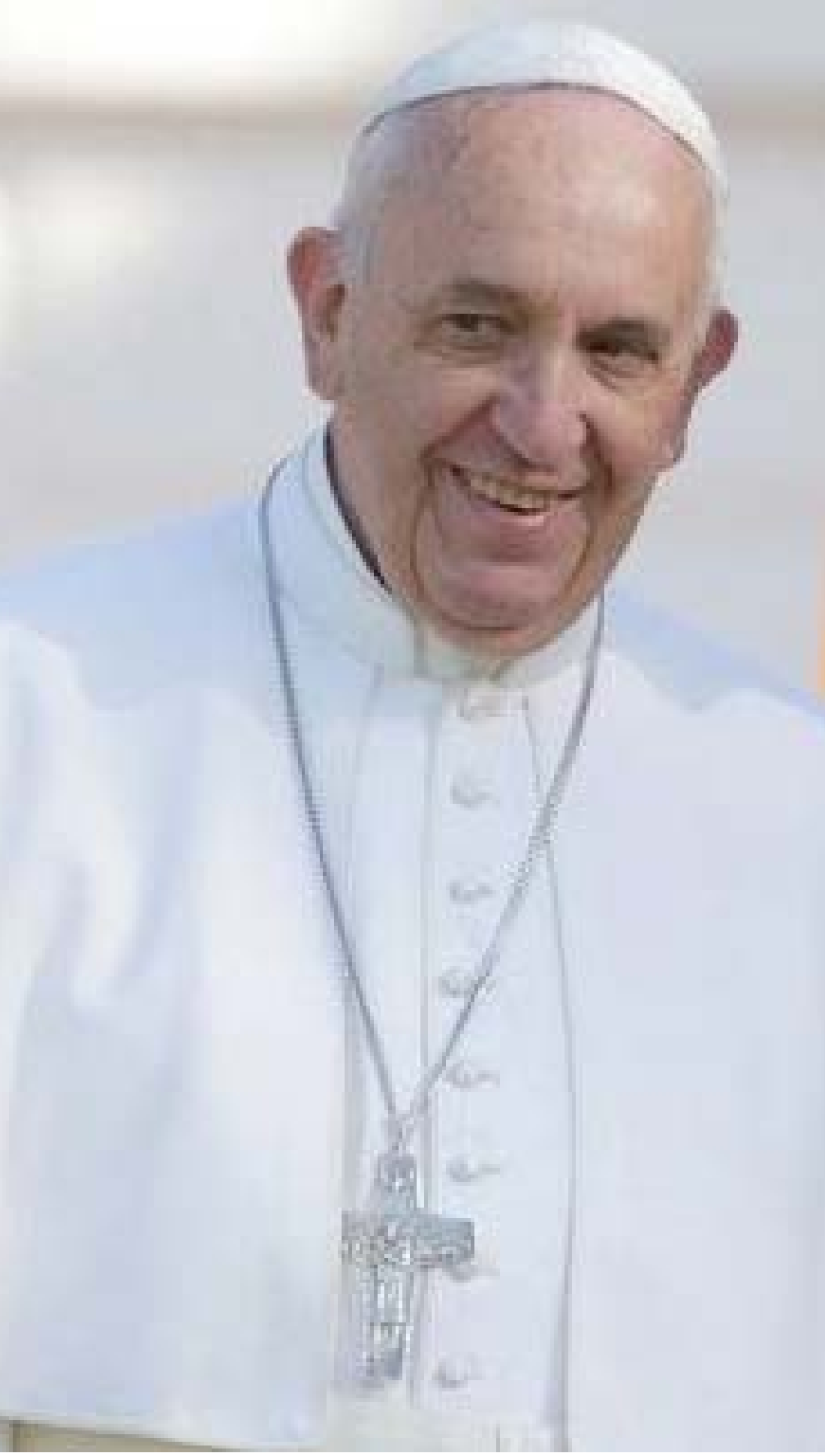
البابا فرانسيس في طريقه إلى العراق