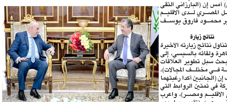
السيسي في دعم القضية الكردية لقاء: رئيس اقليم كردستان خلال لقائه سفير مصر في اربيل

وتعزيز الاستقرار الإقليمي). وكان البارزاني قد زار العاصمة المصرية القاهرة خلال الشهر الماضي، وأجرى مباحثات مع السيسي، تناولت سبل تعزيز العلاقات الثنائية بين كردستان ومصر.