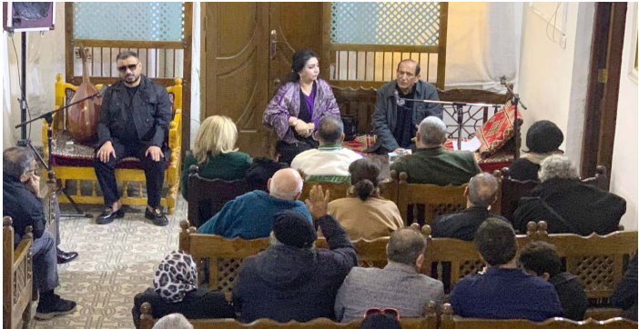
استذكار: لقطات من جلسة استذكار سامي كمال

إلى سوريا، قضى فيها عدة سنوات كانت محطاته الغنائية في المنفى. التقى خلالها برؤسائه كمال السيد. كوكب حمزة، المطرب فلاح صبار، وآخرين ليا أسسوا من جديد فرقته الموسيقية والغنائية (فرقة بابل الغنائية) وكانت صوتا عراقيا مهما. قدم سامي كمال لهذه الفرقة العديد من الأغاني (البحر، البحر، البحر) (رحل سامي كمال لكن صوت العذب سيبقى يروي حكاية وطن، وبرحبته أنطوت صفحة من الفن العراقي الأصيل، وادعا يامن غنت للحب والوطن. وسبقني أغانيك صوتنا في الغربة). وتخللت الجلسة تقديم مجموعة من أغانيه (وهي: بين جرفين العيون) و (راح يا رايح وين) و (أجرح صويحب) واداه المطربون. مؤيد محسن حسن بريس-منزل كاظم وماضي على الجلسة أجواء الحنين حيث استعاده الحضور ذكرى سامي كمال وحضوره الفني الغنائي، كذلك قدم عدد من الحضور مداخلات وشهادات عن شخصيته الراحل سامي كمال، وانشائته مستذكرين مواقف عديدة له وتأثيره الفني والفكري على الأغنية العراقية.