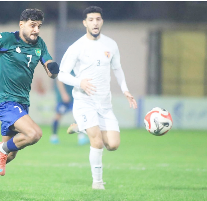
مواجهة: احدى مواجهات فريق النفط في دوري المحترفين

الفريق للمنافسة التي تسير عكس الرغبة و سيكون امام مواجهة ضيفه زاخو المصمم على تخطي المهمة ولا يريد ان يتأخر مرة أخرى للعودة لمسار التناحي والمنافسة بعد اربع جولات بدون فوز والتراجع الى المركز العاشر وافقد لتقديم الاداء حتى في ملعبه لكنه يمتلك حوافز اللعب ويأمل عودة عناصر الغائبة المهمة لخلف الاسباب لدعم قدرات الفريق والعمل على تفادي التراجع و اعادته للطريق الصحيح وإيقاف الكهرياء وازال النجف يعيش كبوة المشاركة منذ البداية وسط إنتقادات جمهوره الذي يشعر بالحزن لما يمر به الفريق الذي لم يتمكن من تغير البداية الضعيفة واتساع المشاكل الادارية والمالية قبل تغير ادارة النادي وتشكيل مؤقتة برئاسة مدرب النادي السابق هاتف شرمان على امل انقاذ الفريق الذي استمرت معاناته وافقد السيطرة على مبارياته في اسوء نسخة لكن مهم ان تتمكن الإدارة المؤقتة في إعادة والملة الشئات وتاهيل الفريق ودعم وترتيب صفوفه بلاعين من خلال الانتقالات الشتوية وجعل الفريق منافسا ولو من بعيد قبل فوات الاوان النجف يضيف نطف ميسان في اسوء احواله وهو الاخر يحاول محو تعثره والتطلع إلى الفوز الثاني بعدما فشل في تحقيقه في ملعبه ويحاول استغلال واقع النجف لتحقيق نتيجة إيجابية بعد خسارة سبع مباريات قبل ان تتعقم المشاكل ويقدف فرصة البقاء. ويريد ثالث عشر المبناء مصالحة جمهوره وتصبح الأمور بعد ثلاث خسارات وتعادل وبدون فوز من اربع جولات وارتفاع شعور غسب وتوتر جمهوره ما يضع الفريق تحت الضغط ويأمل ان يلعب ويفوز وتفادي اي نتيجة غير ذلك امام ضيفه الزمان. بقية الخبر على الموقع الالكتروني لجريدة (الزمان)