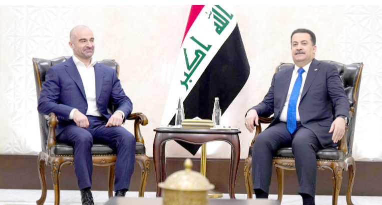
استقبال: رئيس الوزراء خلال استقباله رئيس حزب الاتحاد الوطني

وتعزيز الاستقرار الإقليمي). وكان البارزاني قد زار العاصمة المصرية القاهرة خلال الشهر الماضي، وأجرى مباحثات مع السيسي، تناولت سبل تعزيز العلاقات الثنائية بين كردستان ومصر.