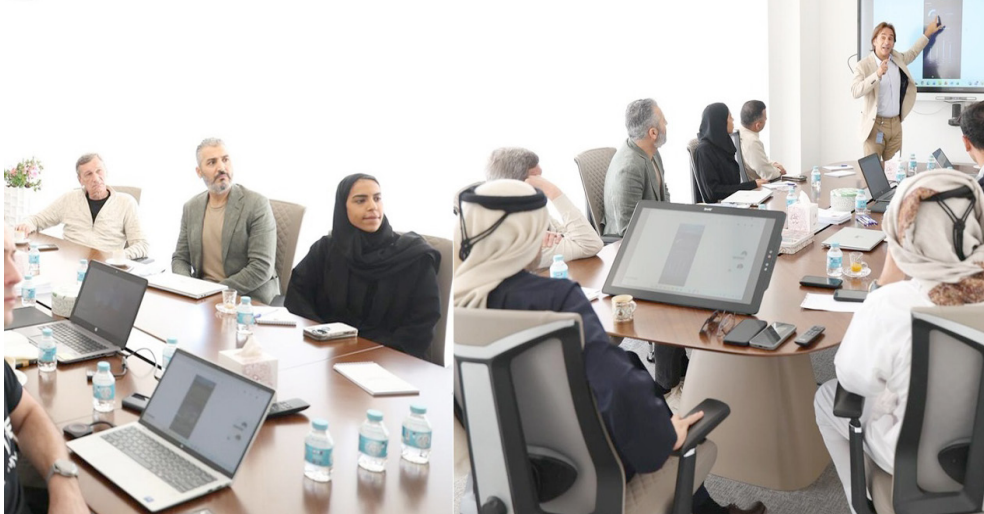
حكam : ورشة لتقييم وتحليل اداء حكام كرة القدم

مشاركة العراق وتناول الموضوعات البات إعداد مناهج متكاملة تراعي خصوصية البرامج التدريبية والفنية للرياضيين الأولمبيين الذين تم اختيارهم لتمثيل العراق في هذه الاستحقاقات