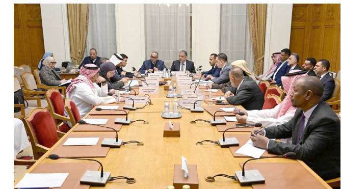
شباب: اجتماع وزراء الشباب العرب في القاهرة

بغداد - الزمان تراس وزير الشباب والرياضة أحمد المبرقع، اجتماع لجنة الرياضة في مجلس وزراء الشباب والرياضة العرب، بوصفه رئيساً للجنة، ونائباً لرئيس المكتب التنفيذي، وأقيم الاجتماع اليوم الاثنين في القاهرة ضمن أعمال مجلس وزراء الشباب والرياضة العرب. وجرى خلال الاجتماع استعراض خمسة عشر مشرعاً تتعلق بالبطولات الرياضية وإقامتها في مختلف