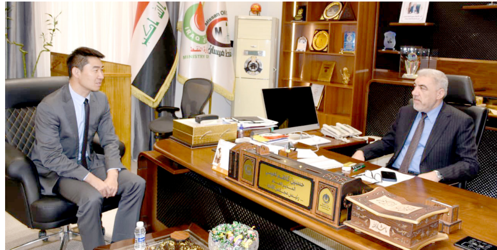
مباحثات: مدير عام شركة نفط ميسان يبحث مع رئيس شركة بتروايجنا الصينية ملف توسيع التعاون

ملاكات الشركة في تحقيق قفزات نوعية بمعدلات الإنتاج. مؤكدة (دعمها الكامل لجميع الخطوات الرامية إلى الارتقاء بمستوى الأداء المؤسسي، وتعظيم موارد ميسان وعموم العراق). وأشارت الشركة في بيان امس الى ان (الزيارة تأتي في إطار تعزيز التواصل مع المؤسسات التشريعية والرقابية، لتعزيز مسيرة التنمية في المحافظة).