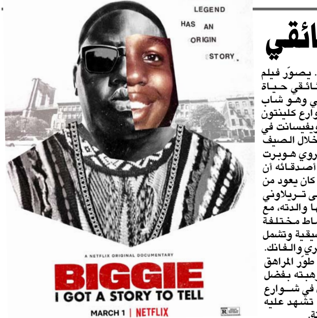
EVERY LEGEND HAS AN ORIGIN STORY.

وفاز عدد من الممثلين السود الأبرياء بجوائز، بينهم الأمريكي تشادويك بوزمان الذي توفي في اب الفاتح جراء إصابته بالسرطان، إذ مُنح جائزة أفضل ممثل في فيلم