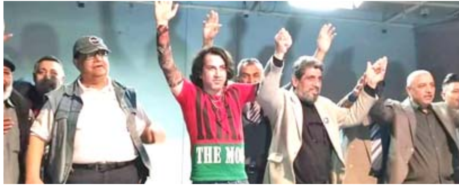
مسرحية: فريق عمل مسرحية (الطموح) يحيي الجمهور في نهاية العرض