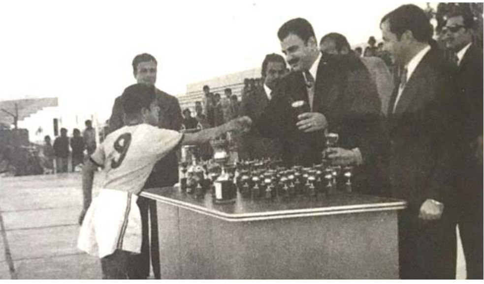
جوائز: توزيع جوائز نشاط رياضي في كربلاء، عام 1975