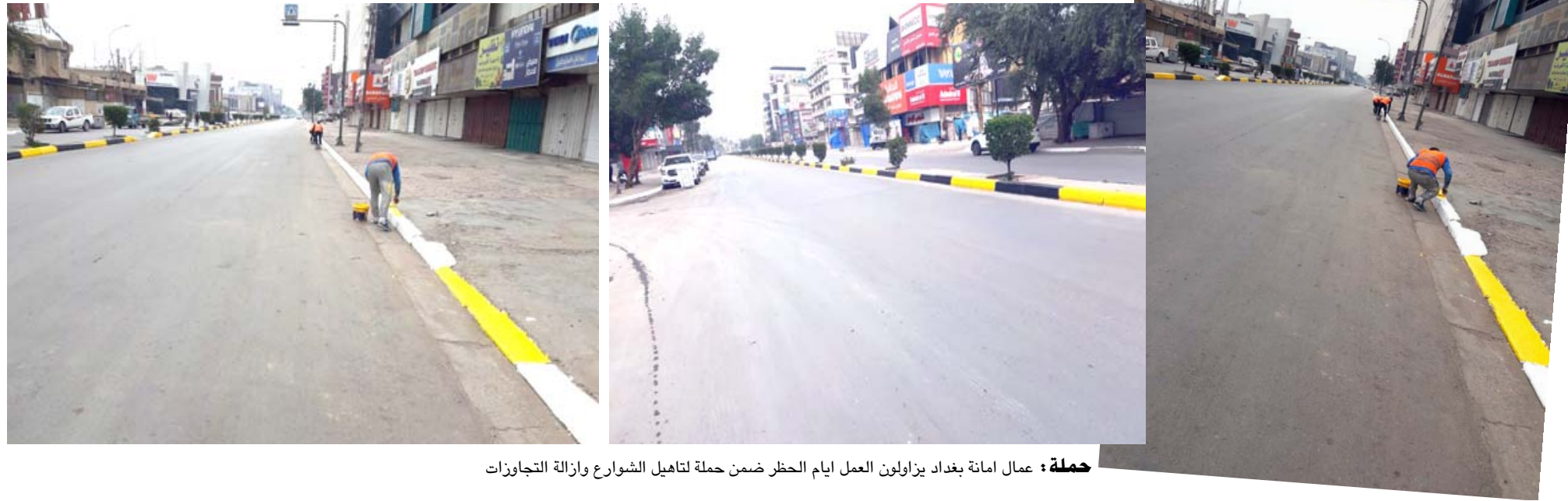
حملة: عمال امانة بغداد يزيلون العمل ايام الحظر ضمن حملة لتجميل الشوارع وازالة التجاوزات