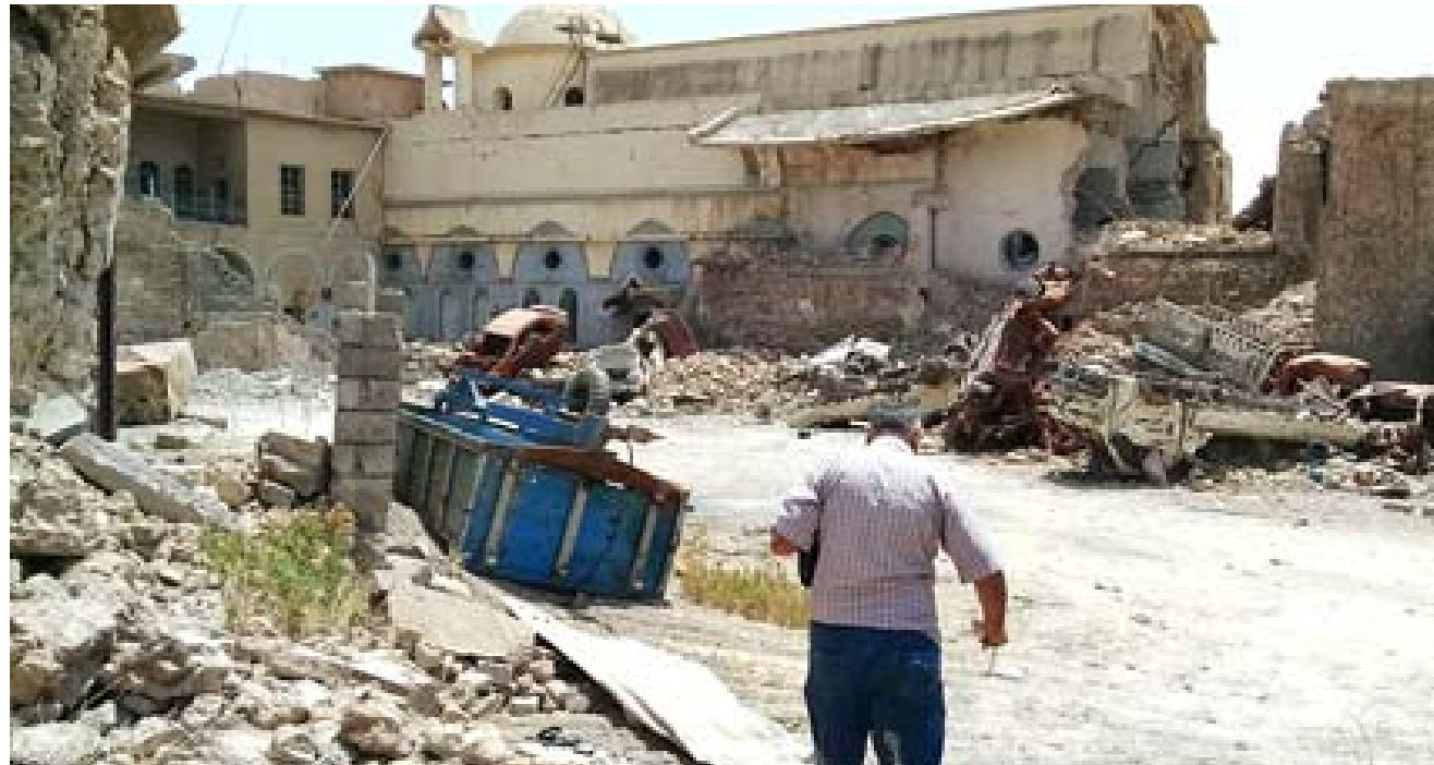
دمار: آثار دمار خلفتها الحرب ضد داعش في الموصل

تستعد منطقة حوش البيعة في الجانب الايمن من مدينة الموصل وبالقرب من المدينة القديمة لاستقبال بابا الفاتيكان في زيارته المرتقبة للعراق في الخامس من الشهر الحالي اذ تدير هذه المنطقة كاحدى المحطات التي يقصدها البابا لضماد جراح الحرب التي تكثرت بطرد عناصر داعش من المدينة بينما ما زالت ندوب الحروب ماثلة على جدرانها وبواباتها اضافة للعبارات التي خطها عناصر التنظيم على الجدران. وتنطوي المنطقة التي تتخذ من الكنائس عنوانا لها حيث يطلق عليها حوش البيعة او ما يقابلها بفناء الكنيسة اضافة الى ان البيعة تبدو مرادفة لكلمة الكنيسة لكن ذات اصل سرياني بمعنى البيضة وتتخذ هذه الرمزية اشارة الى انه مثلما يقف الصوص البيضة ليخرج منها في ولاة لحياة جديدة هكذا خرج يسوع المسيح من القبر تماما كدلالة على تلك الكلمة بكل ما تحمله من دلالات واشارات .. وتبدو المنطقة كمرجع ذات اضلاع متساوية وفي كل ضلع تستقر كنيسة لها دلالاتها وتاريخها العريق الذي تستند عليه حيث تبدو اقدم تلك الكنائس هي كنيسة الطاهرة التي كانت اصلا تتبع كنيسة السريان الارثوذكس قبل ان تؤول عابديتها بفرمان عثمانى لصالح كنيسة السريان الكاثوليك والتي وجدت في القرن السابع عشر الميلادي منمنقة من الطائفة الاولى لكنها بدأت تتبع بابا الفاتيكان بمعزل عن كنيسة السريان الارثوذكس التي تنتمي لطيريك الكنيسة ومقره في سوريا وخضرت الكنيسة التي تحمل تسميتها الرسمية بكونها كنيسة المحبول بها بلادس خلال عمليات طرد داعش الاخيرة خصوصا وان