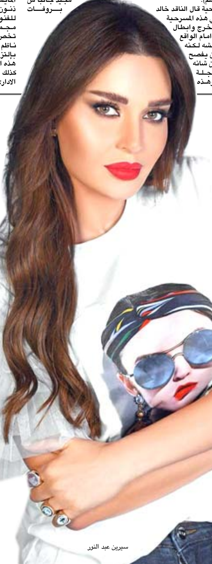
سيرين عبد النور