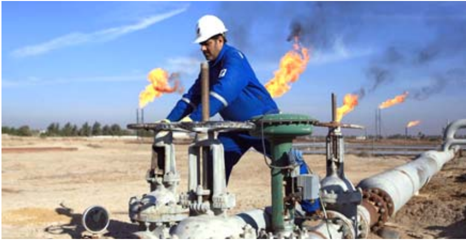
جنوب : حقل نفطي في جنوب العراق

يومياً. ورجح رئيس استراتيجية الأسواق العالمية في أكس، ستيفن أنيس، (استمرار ارتفاع أسعار النفط). ومن المقرر أن يجتمع مستشارو النفط الأعضاء في أوبك في الرابع من آذار المقبل لبحث القيود على الإمدادات بعد نישان المقبل.