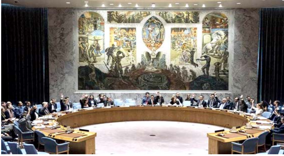
قاعة مجلس الأمن الدولي

جرية قتل خاشقجي، وفي حين أن الإدارة الأميركية الجديدة تلوح بتدابير عقابية، إلا أنها لم تؤكد حتى الآن ما إذا كانت جاهزة للذهاب بعيدا إلى حد فرض عقوبات على ولي العهد السعودي، وقال الناطق باسم وزارة الخارجية الأميركية نيد برايس للصحافيين إن التقرير "خطوة مهمة باتجاه الشفافية والشفافية كما في غالب الأحيان، هي عنصر للحصول على معلومات عن تلك الجريمة، كما أهمية ملف حقوق الإنسان.