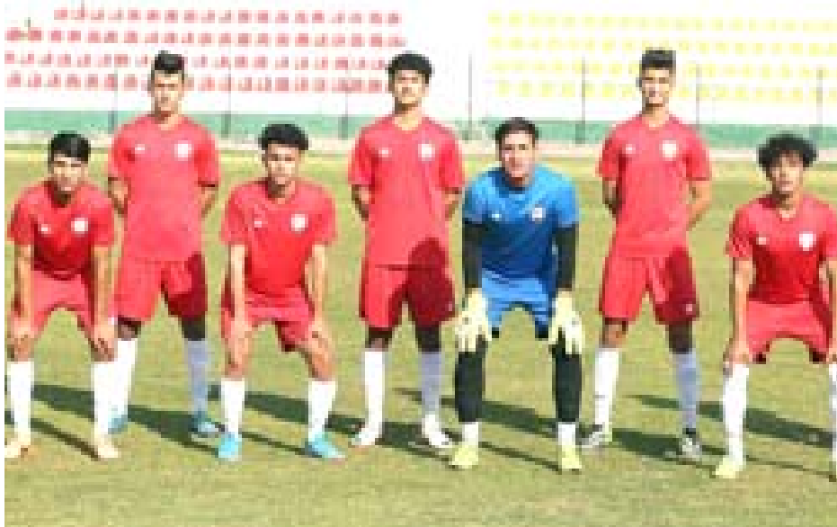
منتخب الناشئين بكرة القدم