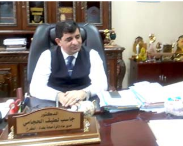
مدير عام صحة الكرخ يتحدث لـ (الزمان)