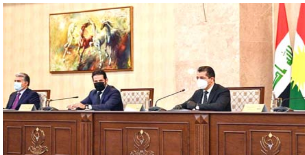
جلسة : مسرور البرزاني يترأس جلسة مجلس الوزراء

إطار موازنة العام الجاري)، ولغت الحياض إلى انه (الاجتماع شهد الصداقة على خطط حكومة الإقليم لتنفيذ مشاريع تنمية المحافظات والمشاريع التي تطلقها الوزارات في المحافظة وتشمل القطاعات البلدية والطاقة والصحة والزراعة والتربية والتعليم للعام الجاري التي يتم تنفيذها بالموارد المتاحة لحكومة الإقليم ويسبلغ إجمالي قدره 349 ملياراً و702 مليون دينار). وتابع أن (هذه التخصصات توزعت بواقع 14 ملياراً و350 مليون دينار محافظة السلمانية 30مليار دينار محافظة حلبجة و128 ملياراً و352