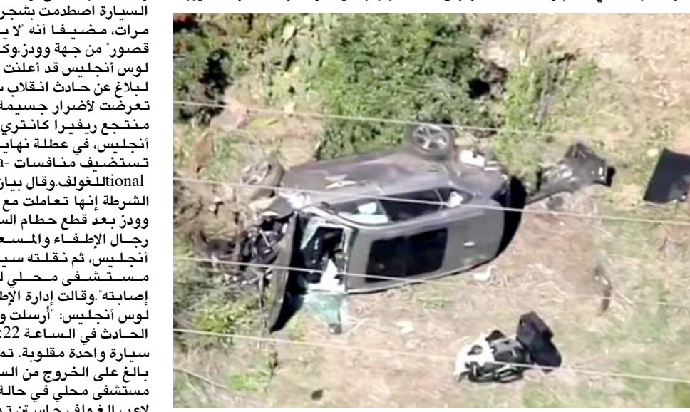
حطام: انتقلت فرق الإنقاذ وودز من حطام السيارة التي انقلبت

حزام الأمان، وكان هادئا وواعيا" عندما أخبره باسمه وأوصاف "من حسن الحظ أن السيد وودز ومنه استطاع الخروج من هذا الحادث" حيا. وقال اليكس فيلانويفا، قائد شرطة لوس أنجليس، إن سيارة وودز "تحطت بالحاجز الفاصل لدرجة أنها استقرت بعيدا على مسافة تبعد مئات الأمتار" ويشير ذلك إلى أنها كانت تسير بسرعة أكبر نسبيا من المعتاد. وأضاف: "على الرغم من ذلك، ونظرا لأن هذه المنطقة تتسم بوجود منحدرات ومنعطفات، فإنها تشهد وقوع نسبة عالية من الحوادث. وهذا أمر شائع" وقال فيلانويفا إن السيارة اصطدمت بشجرة فم تقلبت عدة مرات، مضيفاً أنه "لا يوجد دليل على قصور من جهة وودز" وكانت إدارة شرطة لوس أنجليس قد أعلنت أنها "استجابت لبلاغ عن حادث انقلاب سيارة واحدة... تعرضت لأضرار جسيمة". وكان وودز في منتصف ريفيرا كائنتري كلوب في لوس أنجليس، في عطلة نهاية الأسبوع، التي ستعقد منافسات Genesis Invitational. وقال فريق إدارة شرطة الشرطة إنها تعاملت مع الحادث و أخرج وودز بعد قطع حزام السيارة... بواسطة رجال الإطفاء والمسعفين في لوس أنجليس، ثم نقلته سيارة إسعاف إلى مستشفى محلي للتعامل مع إصابته. وقالت إدارة الإطفاء في مقاطعة لوس أنجليس: "أرسلت وحدات إلى موقع الحادث في الساعة 7:22 وعثرت على سيارة واحدة متسعة. تمت مساعدة رجل بالغ على الخروج من السيارة ونقله إلى مستشفى محلي في حالة خطيرة. وأعرب لاعب الغولف جاستن توماس، المحترف الثالث عالميا وأحد أصدقاء وودز المغربيين،