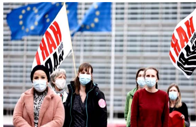
مظاهرة محتجون في برلين على اجراءات الحظر

بها، معربة عن خوفها من أنها قد تؤثر على سلاسل الإمداد، وقال ميشال "علينا اعتماد نهج مشترك القوي على السفر غير الضروري يجب أن يبقى إلا أن الإجراءات يجب أن تكون متناسبة وينبغي ضمان تدفق الخدمات، أما بشأن شهادة التلقيح الأوروبية أكتفى المجتمعون بالدعوة إلى مواصلة نهج مشترك، وقالت فون دير لاين "تتحدى تساقوت علمية، فمن غير المؤكد بعد أن الشخص الملقح يتوقف عن نقل العدوى بعد تلقيه اللقاح.