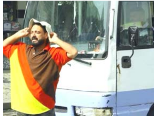
فيلم جديد: فريق عمل (علوش الملاج) في كواليس تصوير الفيلم