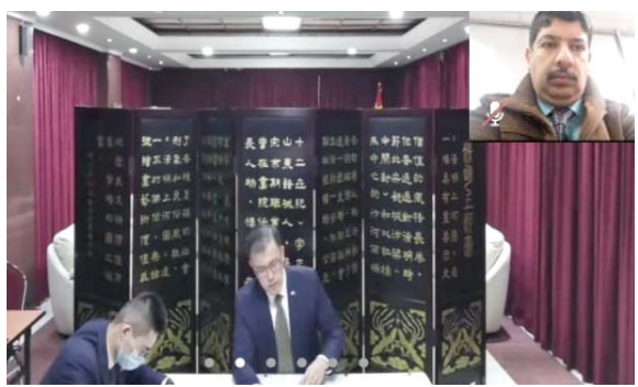
بغداد - ساري تحسين

أكد السفير الصيني في العراق تشانغ تاو دعم العراق لمواجهة الموجة الثانية من جائحة كورونا عبر تزويده بخمسين ألف جرعة ستصل قريباً إلى بغداد بعد مساعدة قدمت إليه في مواجهة الوباء الفيروسي. وحدث تاو خلال مؤتمر صحفي عقده على منصة الكترونية وحضرته (الزمان) أمس (رخص بلاده استخدام العراق ساحة لخصخصة الحسابات الأقليمية والدولية)، مؤكداً دعم الصين لشعب وحكومة العراق في مكافحة الإرهاب وإجراء الانتخابات المبكرة.