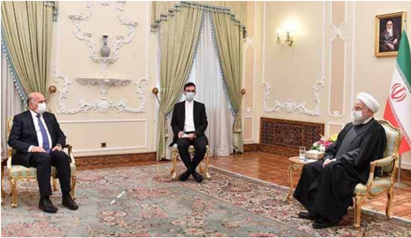
لقاء وزير الخارجية خلال لقائه في طهران الرئيس الإيراني

والعمل على تصنيعها وتصديرها بالرغم من الكثير من المميزات التي يوفرها القانون وبقيا للمصريين الا انها للاسف .