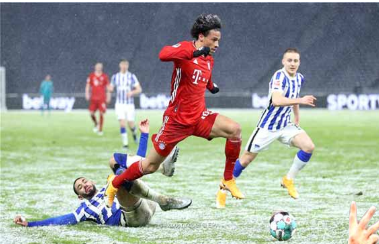
فوز: فريق البايرن يفوز في اخر مواجهاته قبل الذهاب الى قطر

وسجل لوكاكو هدفاً ثالثاً للأنتر، لكن الحكم الغاء بداعي التسلل. وأطلق بيريسيتش تسديدة أرضية قوية، من خارج منطقة الجزاء بقدمه اليسرى، لكن تائق الحارس وأبعدها إلى ركنية. واستمر دراجوفسكي حارس فيورنتينا في تالفه، حيث أنقذ مرماه من فرصة محققة، تمثلت في تسديدة قوية لجالبارديني، لكنه أخطأ في الخروج من مرماه، في الركنية الخالية، ليضع باسوتوني الكرة بجوار القائم.