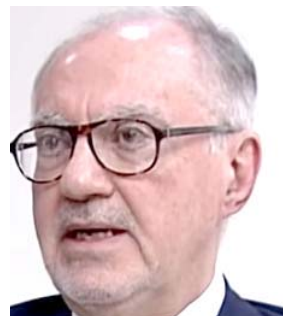
علي علوي النائبية الوزارة بشان تصريحات علوي التي اشار خلالها بتورط كتل سياسية لم

بمسماها في نشر الفساد عبر نافذة بيع العملة في البنك المركزي وقالت اللجنة في بيان مقتضب ان المخاطبة جاءت لغرض تشكيل لجنة فرعية تحقيقية بهذا الموضوع وكشف الحقائق امام الشعب، وكان البرلمان قد قرر استجواب محافظ البنك المركزي مصطفى الخليفة نائبية، فالح الساري، بسبب وجود ملفات بينها فساد مزاد العملة وقالت النافذة عن كخلة الناصر، هدى سجاد ان كتلة نيابية حضرت لاستجواب رئيس هيئة الاعلام والاتصالات