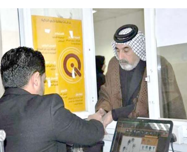
راتب: متقاعد يتسلم راتبه من احد المنافذ

واكدوا في رسالة تلقتها (الزمان) اس ان (العديد من الموظفين مضى على استحقاق ترقيمهم سنوات عدة ولم تقم المالية بتفريعهم وذلك بسبب عدم تنفيذ الوصف الوظيفي بحقهم وهو الاجراء الذي قامت