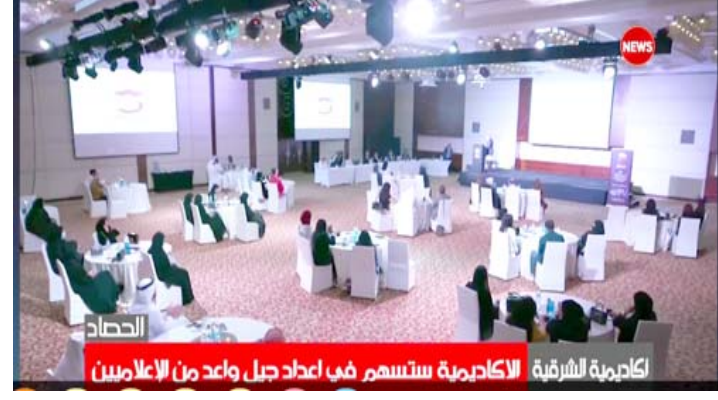
تدريب : مشاهد من الدورة الاولى لأكاديمية (الشرقية) للإعلام