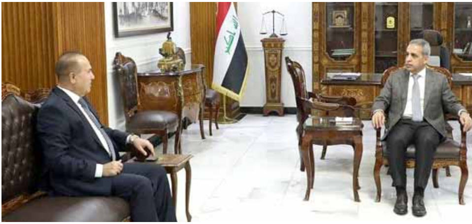
استقبال رئيس مجلس القضاء استقبل رئيس ديوان الوقف السني

بغداد - الزمان بحث رئيس مجلس القضاء الأعلى فائق زيدان مع رئيس ديوان الوقف السني سعد كمبش ، متابعاً الدعاوى التي قدمها الوقف الى المحاكم المختصة بشأن هدر الاموال والعقارات . وقال بيان للمجلس تلقتة (الزمان) امس ان (اللقاء بحث الدعاوى التي قدمها الوقف الى المحاكم المختصة بشأن هدر الاموال والعقارات). واعلنت كمبش الاخبار والتحقيقات الرصافة المختصة بقضايا النزاهة تصديق اقوال مدير عام بالايعراف بعد تقاضيه رشا من احد القاولين، وذكر البيان ان (المتهم الذي يشغل