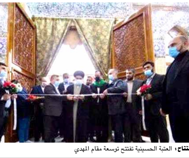
افتتاح العتبة الحسينية فنتحت توسعة مقام المهدي