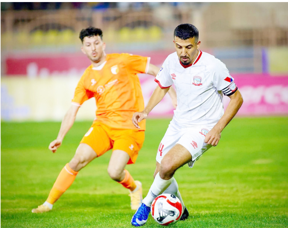
تعادل: مواجهة الكرمة مع زاخو تنتهي بالتعادل في دوري المحترفين