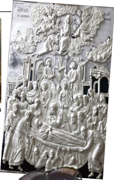
تشكيل : اعمال تشكيلية للفنانة مفيدة الديوب

المدرّب السوري حاضر في دورة أساسيات صناعة شموع الزينة التي أقيمت في قصر الثقافة بدوما بريف دمشق.