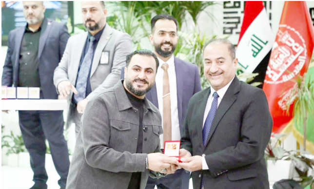
وزارة : جانب من تكريم وزارة الشباب للفائزين

بغداد-الزمان نباية عن وزير الشباب والرياضة أحمد البرقع، حضر المدير العام لإدارة العلاقات والتعاون الدولي حسام حسن حفل تتويج الفائزين في مسابقة خطوة الدولية الثالثة للتصوير الضوئي، التي أقامها قسم الإعلام في الغنية الحسينية المقدسة بمحافظة كربلاء، بمشاركة واسعة لأكثر من خمسين دولة عربية وأوروبية. ونقل حسام حسن تحيات معالي الوزير أحمد البرقع إلى المشاركين والقائمين على هذا المحفل الثقافي والفني، مشيداً باستوى التقدم للأعمال المشاركة، التي عكست البعد الإنساني والمسمة الفنية العالية في توثيق مشاعر زوار الإمام الحسين عليه السلام خلال الزيارات المليونية والمناسبات الدينية المختلفة. كما شارك في توزيع الجوائز على الفائزين. مؤكداً أهمية دعم الفعاليات الثقافية والفنية التي تسهم في إبراز الصورة الحضارية للعراق، وتعزيز قيم الإبداع والتواصل الثقافي مع مختلف دول العالم. نُفذت دائرة الدراسات