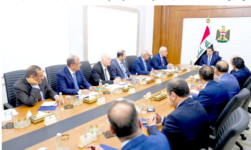
استقبال: رئيس الوزراء يستقبل نخبة من الخبراء وأساتذة الجامعات

وأشار السوداني إلى أن (اللقاء يأتي في إطار حرص الحكومة على توسيع دائرة التشاور واعتماد الرؤى المتخصصة في مناقشة القضايا المالية والاقتصادية والتجارية، بما يسهم مع تقلبات الاقتصاد العالمي وانعكاساتها على الداخل العراقي)، مشدداً على (أهمية