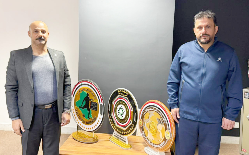
لقاء: مندوب الزمان يلتقي رئيس نادي الزوراء الرياضي

□ ما الذي يميز إدارتكم الحالية عن الإدارات السابقة؟ - هناك فروقات واضحة، أبرزها في سياسة الاستقطابات، والاهتمام بالبنية التحتية، وتفعيل التواصل مع الجماهير، فضلا عن السعي لتحقيق نتائج مستقرة ومستدامة، لا تعتمد على الحلول المؤقتة. □ هل أنتم راضون عن مستوى الفريق هذا الموسم؟ - الفريق ما زال في بداية الموسم، وأن التقييم الحقيقي يجب أن يكون في نهايته، مؤكداً أن التسرع في الأحكام لا يخدم