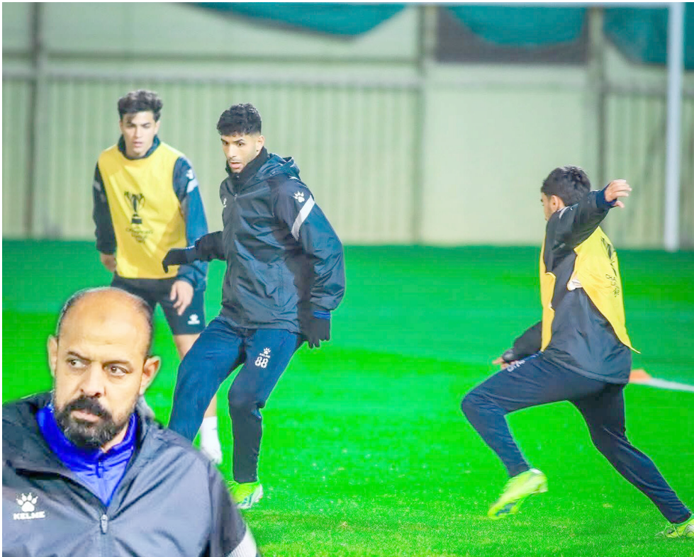
تدريبات : فريق الزوراء يجري تدريباته استعدادا لمواجهة النصر السعودي

الفريق ودعم صفوفه في الانتقالات الشتوية قبل فوات الأوان. الحق فريق النادي الاهلي السعودي ، خسارة مذلة والعراقي في التغلب عليه بخمسة اهداف دون رد في المباراة التي جمعت الفريقين مساء امس الاول الاثني. في ملعب الزوراء ضمن الجولة السادسة