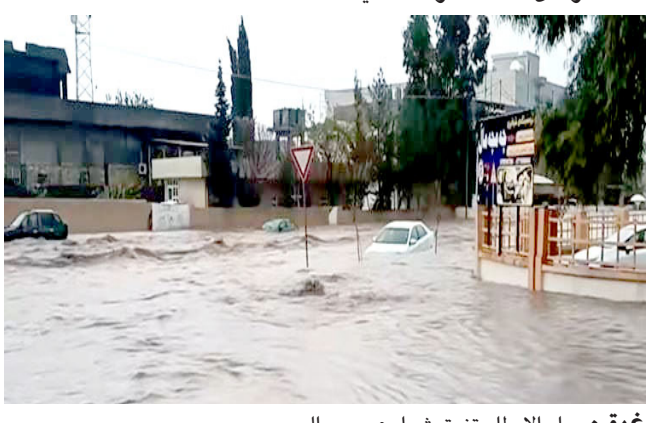
غرق: مياه الامطار تغرق شوارع ججمال