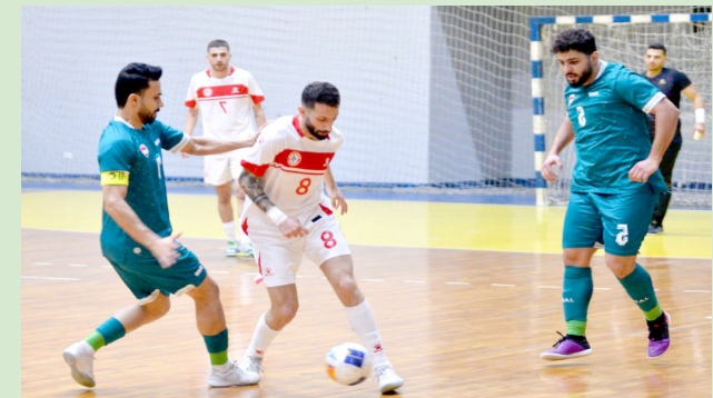
مباراة: منتخب الصالات بكرة القدم في مباراة ودية

معسكره في بيروت بصورة إيجابية، مؤكداً حضوره القوي وطموحه الكبير في تقديم مستويات مميزة خلال نهائيات كأس آسيا لكرة الصالات التي ستقام في إندونيسيا الشهر المقبل.