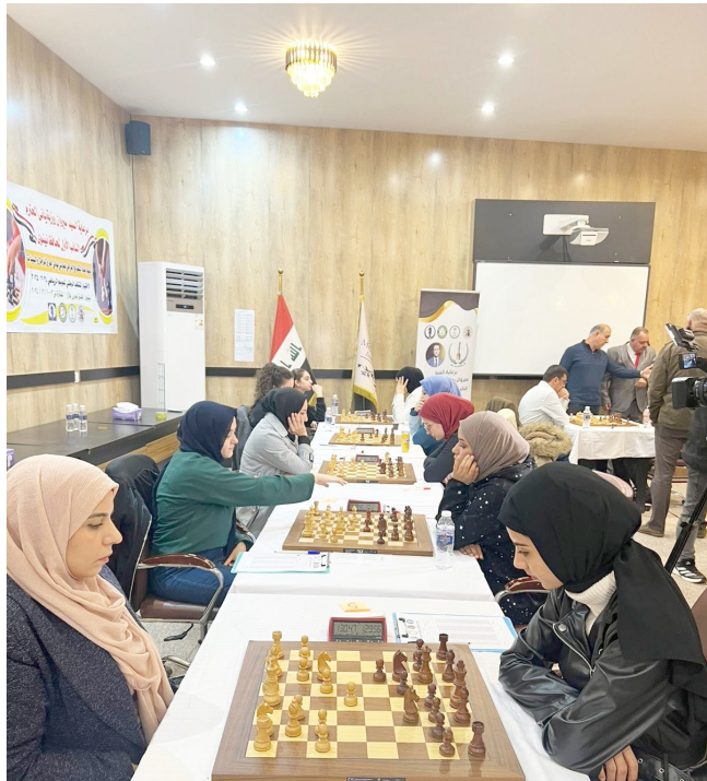
شطرنج: منافسات الشطرنج المحلية في السليمانية