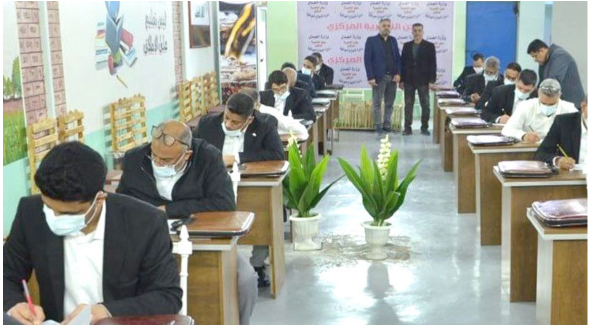
امتحانات : نزلاء السجون يؤدون الامتحانات

التميز للمطالبة بأقصى العقوبات، وسيستمر العمل لكشف مصير الأموال المسروقة وملاحقة الشبكة كاملة، سواء كان المتورطون من داخل الصندوق أو خارجه). ويستعد المحامون للظاهر يوم غد الأربعاء، احتجاجاً على ما وصفوه بالفساد والسرقات المنهجية التي طالت أموال المحامين. وتناقلت مواقع التواصل أمس دعوة للظاهر جاء فيها إنه (بالنظر لخطورة ما يجري ندعو جميع المحامين إلى الحضور المكثف والمشاركة الفاعلة في الظاهرة، والتماسك صفاً واحداً، ورفض سياسة الصمت والتسوية، والتعبد بالفاسدين التي عبثت بأموال النقابة، والمطالبة بكشف الشبكة الكاملة التي يقودها المتهمون بسرقة الأموال، إضافة إلى كشف الالتماس للموظّفين ومصادر الرأء غير المسوغ وبيان حجم المصروفة، على حد وصف الدعوة).