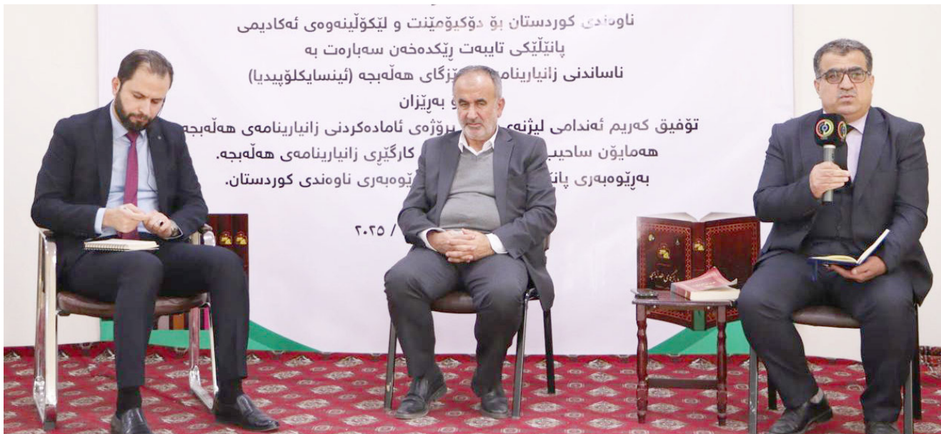
موسوعة. حلقة نقاشية عن فكرة موسوعة حلبجة

غير الحكومية، اللجان والشركات)، اليمن، 692 صفحة (أعمال الخير، المتحدثون باللون، المكرمون، الصحفيون والإعلاميون، الكتاب والمترجمون، الشعراء، الفنانون، الرياضيون، الجراحون والأطباء الشعيبون)، يحتوي على نحو 1200 شخص.