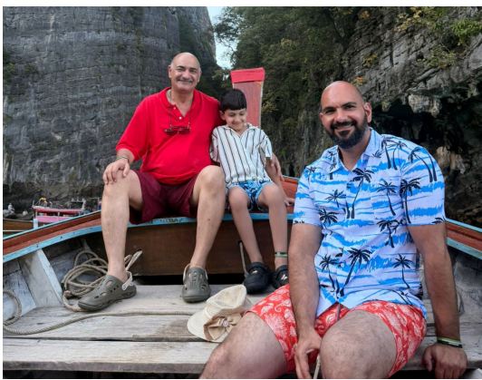
جزيرة: لقطات من رحلة تل القروء وجزيرة القرش