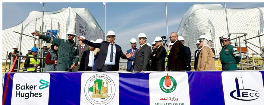
حقول : مشروع استثمار الغاز المصاحب في حقول الناصرية والغراف يدخل مرحلة تنفيذية متقدمة