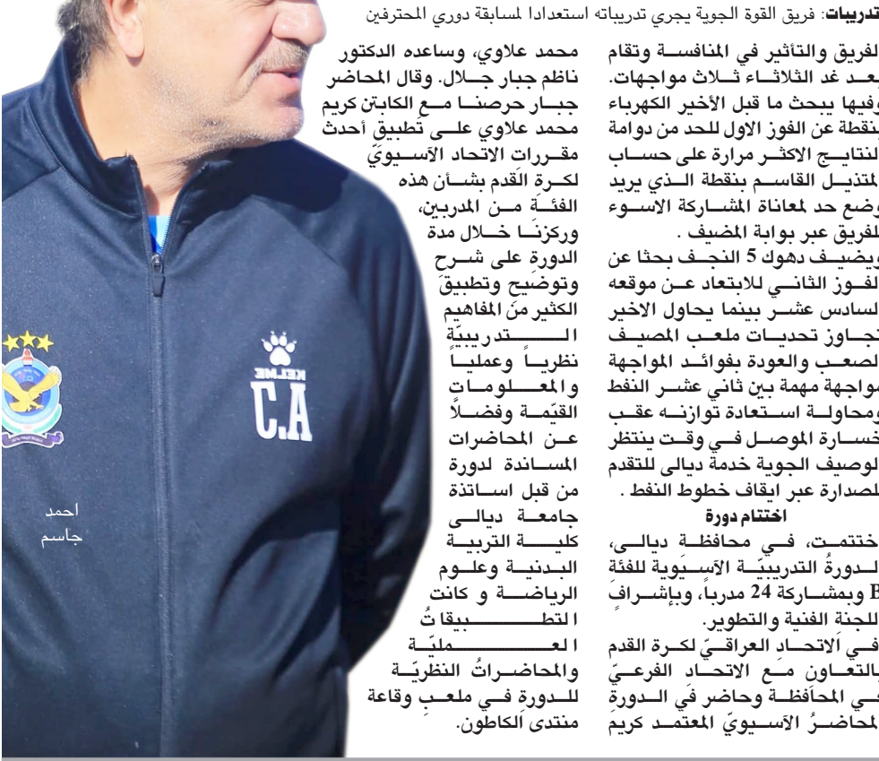
تدريبات: فريق القوة الجوية يجري تدريباته استعدادا لمسابقة دوري المحترفين