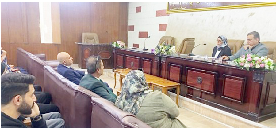
حملة: ورش وندوات ضمن الحملة الوطنية لمكافحة المخدرات

عبر تعزيز الوعي الوقائي بين الطلبة، وتصبح المفاهيم المغلوطة بينهم، فضلا عن كشف الآثار الخفية والخطيرة على القدرات العقلية. وبرزت الحملة كيفية تأثير التعاطي على الفرد والمجتمع. ودعم الجانب التثقيفي للطلبة. بايضاح الضرر