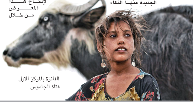
الفائزة بالمركز الاول فتاة الجاموس

بغداد- ياسين ياس افتتحت الجمعية العراقية للتصوير/ المركز العام الخميس الماضي معرضها السنوي 47 على قاعة بغداد في نادي الصيد العراقي بمشاركة نخبة من فنانين بغداد والمحافظات. عن المعرض تحدث لـ(الزمان) رئيس الجمعية العراقية للتصوير رسول جمال المعموري قائلاً (تتشرف الجمعية العراقية للتصوير المركز العام.ان تضع بين ايديكم منجزها 74 والذي يتضمن المعرض الفوتوغرافي السنوي للجمعية والذي حضى بدعم الأمانة العامة للعتبة الحسينية المقدسة، وعدد اللوحات المشاركة 1224 عند الفز المشاركين 80 مصور من بغداد والمحافظات والاعمال اختلفت من خلال اختلاف المحاور الجديدة منها الذكاء