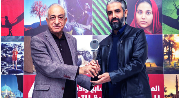
معرض : لقطات من المعرض السنوي للجمعية العراقية للتصوير