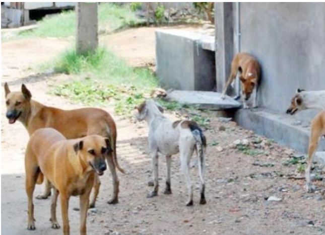
محمية: كلاب سائبة في محمية ديبالى

مع تصاعد أعداد الكلاب داخل الأزقة والأحياء السكنية. وقال مدير بلدية قضاء خانقين مجبل الكروي لـ (الزمان) ، إن (المشروع انطلق من مبدأ احترام حقوق الحيوانات ورفض التعامل القاسي معها، موضحا أن المحمية أُنشئت خارج مدينة خانقين لنقل الكلاب السائبة إليها بدل القضاء عليها).