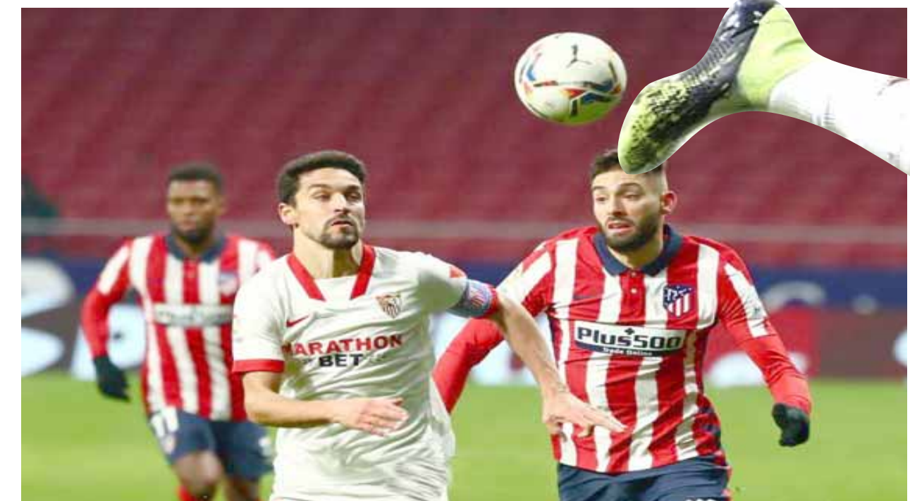
فوز انتليكو مدريد يحقق فوزاً صعباً في مواجهة الليغا

واتى الرد من اليونايدي في الدقيقة 17 بتسديدة من برونو من داخل منطقة الجراء، أمسك بها بوب بسهولة. وكاد مانشستر أن يفتتح التسجيل في الدقيقة 25 بتسديدة مقوسة من مارسيلال من على حدود منطقة الجراء، علت العارضة بقليل. ونجح ماجواير في افتتاح التسجيل في الدقيقة 37 براسية متقنة سكنت الشباك، إلا أن الحكم الغاه لوجود مخالفة على الدفاع الإنجليزي أثناء تسديده على بيترز. واطلق مارسيلال صاروخية من خارج منطقة الجراء في الدقيقة 45 تالت بوب في إبعادهما إلى ركنية، لينتهي الشوط الأول بالتعادل السلبي. ومع بداية الشوط الثاني، مر مارسيلال كره ببنية لكافاني الخالي من الرقابة داخل منطقة الجراء في الدقيقة 52 ليسد الأخير كره ضعيفة أمسك بها بوب بسهولة. وظهر فيرناندز في الشوط الثاني