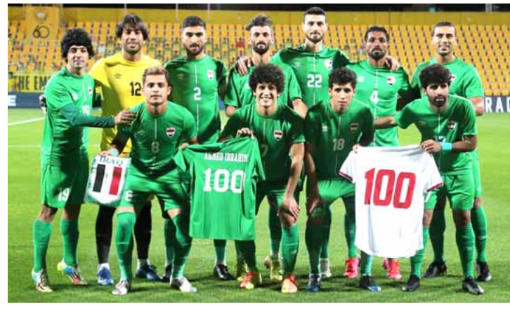
اسود الرافدين تتعادل في ودية الامارات