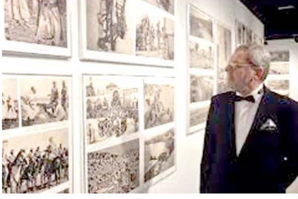
معرض لفتح الله