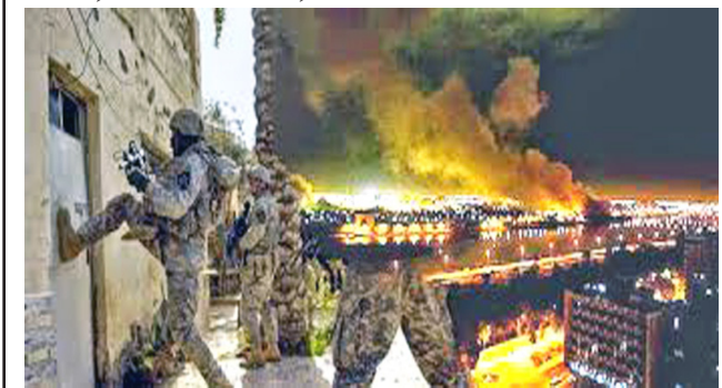
قصف؛ بغداد ابان القصف الأمريكي 2003

وبنائها، ومرة عاشره لإنقاذنا من توغل إيران وتغولها، وما قداصبح وجودهم معنا اليوم ضرورة استراتيجية، ونوعا من الحل في نظر من كانوا يطالبون بطردهم من بلادنا. أما الإيرانيون، فمن واقع خبرتهم في صناعة السجاد بنفس طويل، فقد شرعوا في مساعدتهم الشريرة لتظل شراكتهم في احتلال بلادنا وإخضاع أهلنا قائمة، حتى يمن الله علينا بظهور «المهدي» الذي يأتي ولا يأتي، وعندئذ سوف يكون لكل حادث حديث.