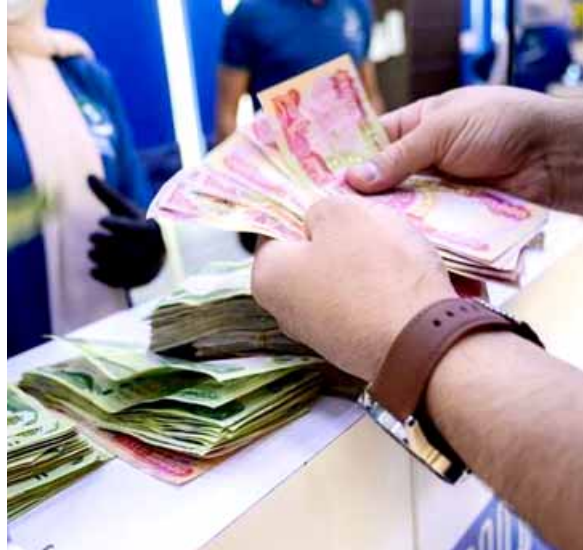
تداول النقد في أحد مكاتب الصيرفة

في ما تقترح الموازنة الحالية (578 مليار دينار)، مطالباً (بضرورة إلغاء فقرات الموازنة الخاصة باستقطاع رواتب الموظفين وفرض الضريبة عليها مع الإبقاء على استقطاع رواتب المديرين) وإشار إلى أن (تقديرات صيانة خلال الأشهر الثمانية لسنة 2020 بلغت 89 مليار دينار