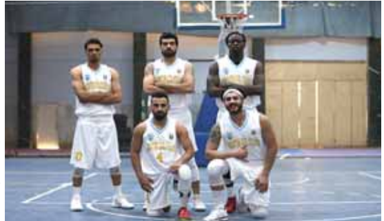
فريق نفط البصرة بكرة السلة

بغداد - الزمان حقق فريقا نفط البصرة والتضامن الفوز، اليوم ضمن منافسات الجولة الثالثة من الدوري السلوي الممتاز. وتغلب نفط البصرة باريحية كبيرة بعدما تجاوز نفط الشمال بفارق 44 نقطة بواقع 98-54.