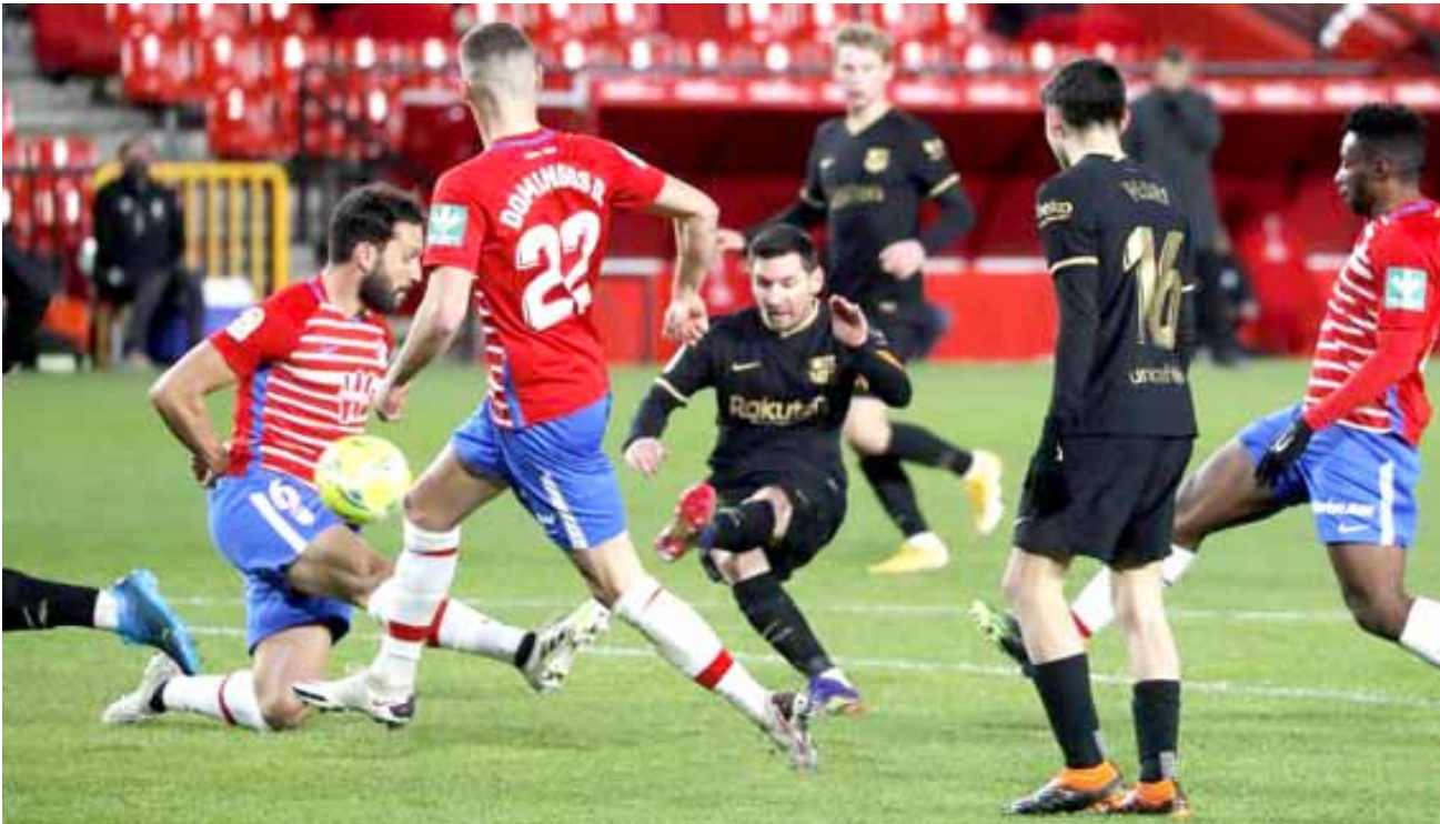
فوز فريق برشلونه يحقق الفوز بقيادة ميسي في الليغا

وكباران كلارك وجمال لاسيليس وبول دوميت. وتواجد على جوليينتون، في مجيل المبرون وجولينتون، في مركز بوسط الملعب كل من جيف هنريك وأيزاك هايدن وشون لونغستاف، وأدى الغملاق أذني كارول دور المهاجم الصريح. وهاجم أرسنال منذ الدقيقة الأولى، عندما شق نيلسون الذي لعب مكان جابريل مارتينيلي لإصابة الأخير في عمليات الإحماء، طريقه في الناحية اليسرى، قبل ان يطلق تسديدة من جانب بابلو ماري في عمق الخط الخلفي، بإسناد من الظهيرين سيدريك سواريس وكيران تيرني. فيما تمركز المصري محمد النني وجو بيلوك في منتصف الملعب، وتحرك الثلاثي نيوكاسل بيبي وويليان وريس نيلسون، خلف المهاجم الصريح بيير إيميريك أوباميانج. في الناحية المقابلة، لجأ مدرب نيوكاسل ستيف بروس إلى طريقة اللعب (1-4-5) حيث تشكل الخط الخلفي من إميل كرافت