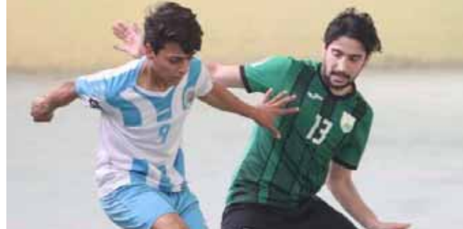
نفط الوسط يحافظ على صدارة دوري الصالات

بغداد- الزمان بفوزه مساء اليوم على الشرقية 6 - 3 في المباراة التي أقيمت بملعب الشرقية لحساب