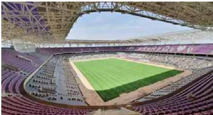
ملعب الحسينية بكرة القدم

ان تاخذ وقتاً طويلاً، وأرجو من الاخ فلاح منفي عودة التواصل معنا من اجل اكمال الملع لكي نفتحته بشكل متكامل واكمل أرجو ان يكون نهاية شهر آذار او بداية شهر نيسان في هذه المدينة العزيزة.