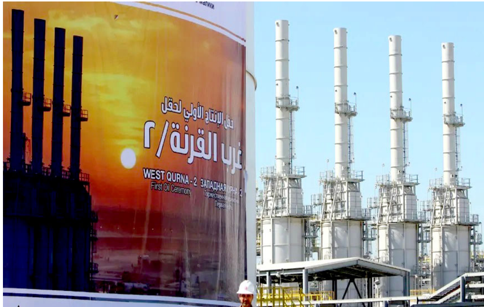
حقل بجانب من حقل غرب القرنه في البصرة