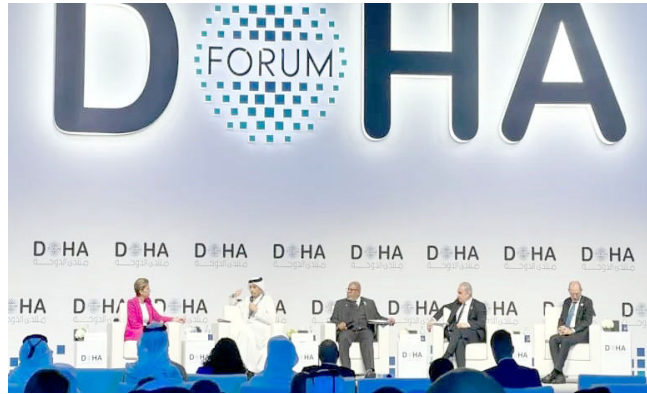
ملتقى : جانب من ملتقى الدوحة

العلاقة، كانت أحداث الكبار تنسج خيوطها من كواليس الجلسات أكثر مما تنسجها على المنصات الرسمية؛ مصافحة عابرة تتحول إلى جسر تفاهم، ونظرة متبادلة تخنصر تاريخا من الخلافات والتحالافات. أزمة الطاقة يجلس إلى جوارك رئيس حكومة سابق، وعلى بعد مقعد وزير خارجية، وفي الممر المقابل خبير الاقتصاد عالمي براجع أرقامه على عجل قبل أن يصعد إلى منبر النقاش حول أزمة الطاقة أو تحولات الأسواق، بينما يتنهدا خريطة مصفرة لعالم مضطرب يبحث عن طاوله واحدة يتحدث عندها العقل بدل ضجيج السلال هناك تحت أضاء الفجاعات الفخمة وشاشاتها كانت الأزمات العربية ضيفا دائما