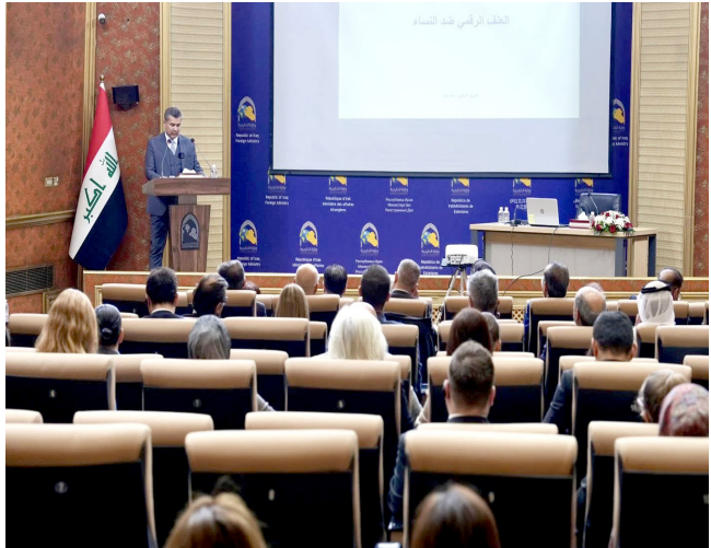
فعالية : جانب من فعاليات اليوم العالمي لحاربة العنف ضد المرأة

بغنوان العنف الرقمي ضد المرأة، (فاعلية الدوائر التخصصية في وزارة الداخلية العتيرة بالأسرة والمطل، ودور الشرطة المجتمعية في حل المشكلات قبل وصولها إلى القضاء، إلى جانب جهود الدوائر الاستخبارية ومديريات حقوق الإنسان).