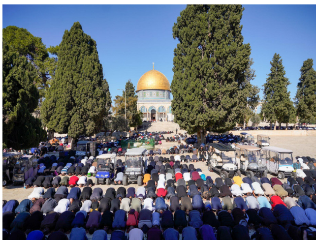
صلاة : فلسطينيون يؤدون الصلاة داخل الحرم القدسي الشريف

رام الله -لارا احمد تشير التقارير الصادرة عن مكتب الأقصى إلى عودة الأجواء الهادئة داخل المسجد، حيث يستعيد المصلون روتينهم اليومي في أداء الصلوات بطريقة طبيعية وكريمة، تعكس حالة من الطمأنينة والكثير ان على المستوى القريب او المتوسط على الأقل ان لم نقل البعيد أيضا . ويعود الهدوء في المسجد وهدوء الناس في صلاة الجمعة، حيث يعمل الآلاف لأداء صلاة الجمعة في أجواء دينية خاصة، تحمل قيمة روحية واجتماعية كبيرة. وهو ندرجي ويلاحظ أنّ هذه العودة التدريجية للهدوء داخل المسجد تأتي في وقت حساس تمر به المنطقة، بعد فترة من التوترات التي شهدها المسجد الأقصى خلال الأشهر الماضية، إلا أن استمرار الأنشطة العبادية بشكل طبيعي يسهم في إعادة الشعور بالاستقرار، ويعزز ارتباط الناس بماكنهم المقدسة، رغم كل الظروف السياسية والأمنية المحيطة. كما تؤكد مصادر محلية أن هذا الهدوء لا يلغي أهمية البقطة