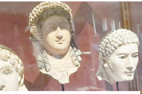
آثار: مجموعة آثار في المتحف القومي المصري