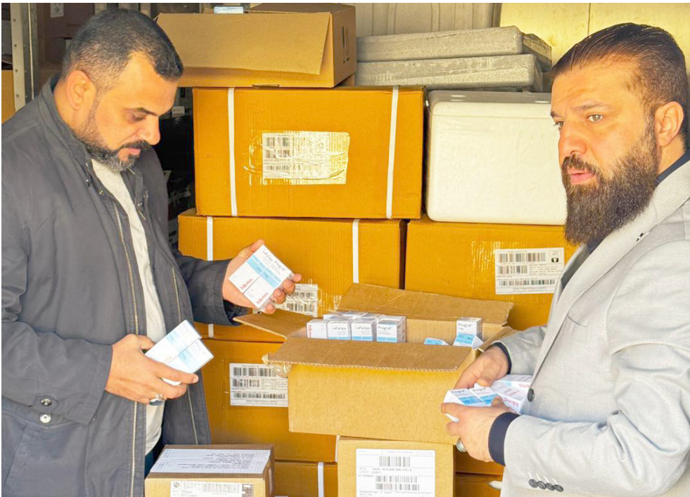
دواء: ميسان تتسلم دفعة من دواء زراعة الكلى

العام، مشيراً إلى (استخراج القطعة المعدنية بنجاح). وأكد المستشفى ان (الطفلة غادرت المستشفى بصحة جيدة. بفضل جهود الملاكات الطبية