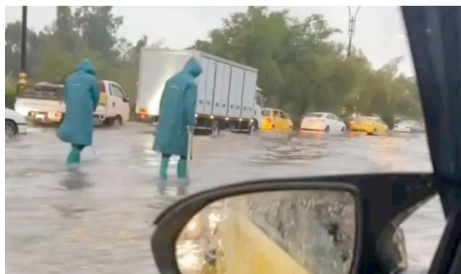
امطار: غرق احياء في الموصل بمياه الامطار