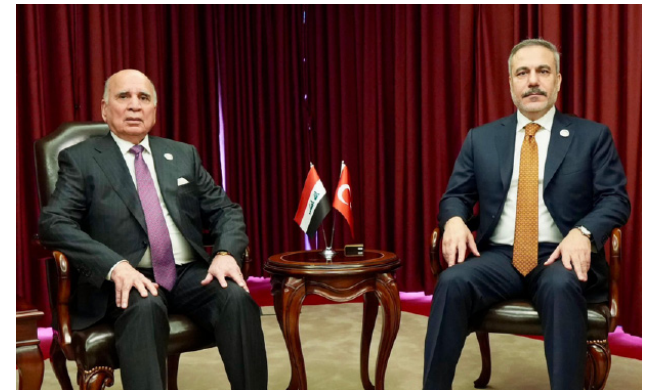
لقاء : وزير الخارجية العراقي يلتقي نظيره التركي

وتنطلق باراك إلى (الوضع الراهن في سوريا)، وشدد على (أهمية التعامل بعدالة مع جميع المكونات السورية ودعم الجهود الساعية إلى إيجاد حلول للوضع وهذا أمر يعود إلى الشعب السوري). وكان باراك، قد انتقد بشدة حملة التدخل الأمريكي