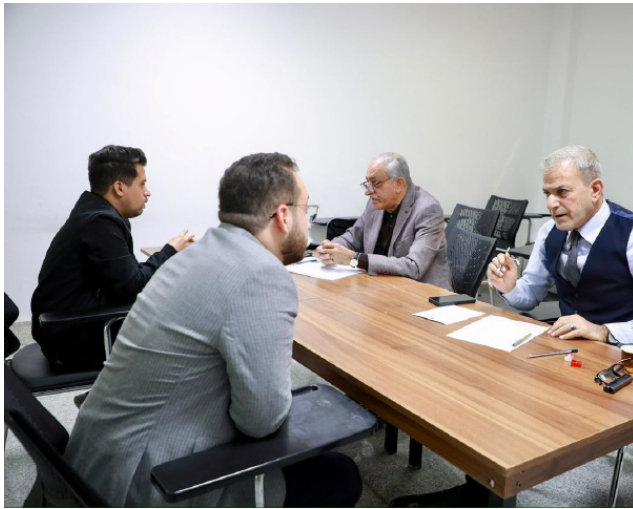
امتحان : طلبة اعلام معهد العلمين خلال اداء الامتحان الشفوي.

استاذ المادة الدراسية . وقد استعملت جميع متطلباتها تمهيدا لدخول الطلبة الامتحان النهائي للفصل الاول الذي يبدأ في العشرين من الشهر الجاري بموجب التقويم الجامعي. وأضاف ان (الواد المشمولة بامتحان الأحد شملت الصحافة الاقتصادية ومناهج البحث الاعلامي واللغة الانكليزية).