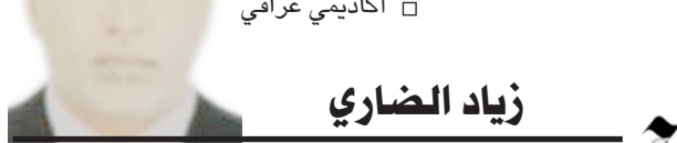
زيد الضاري بغداد

مشاركة: وزير البيئة العراقي يشارك في الاجتماع الوزاري العربي مع البنك الدولي، وتابع ان القسم انتهى من التحضير لبدء تنفيذ الخطة الوطنية الحدثة لضبط وتقييمات الامتثال لتنفيذ اتفاقية ستوكهولم بشأن الملوثات العضوية الثابتة بالتنسيق مع البنك الدولي، والذي يهدف لآلاف مايعادل 3 الاف طن من المواد والزيت الملوثه