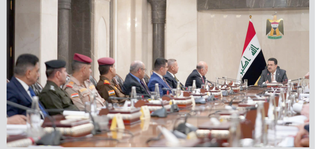
اجتماع: رئيس الوزراء يترأس اجتماع المجلس الوزاري للأمن الوطني

رؤية موحدة مبيناً ان (المجلس بحث كيفية واقع حال المنافذ في كردستان للوصول الى رؤية موحدة بشأن غلق المنافذ والمعابر غير الرسمية عبر تشكيل لجنة مشتركة للبت بالموضوع ورفع توصيات الى مجلس الوزراء)، واذاف، انه (وافق على تعيين 30 ضابطاً