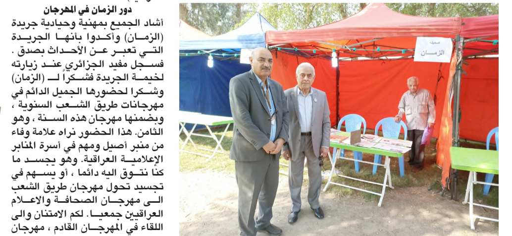
خيمة: مندوب (الزمان) امام خيمة للجريدة في مهرجان طريق الشعب