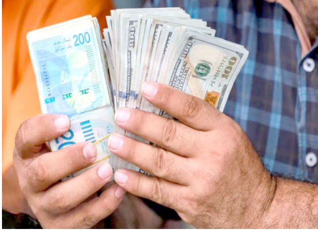
أزمة: استقطاعات الرواتب تتسبب بأزمة إقتصادية في غزة

في المقابل، يطالب الشارع الغزي بهيئة فلسطينية مسؤولة وموحدة تتولى إدارة المرحلة المقبلة، بعيداً عن السلاح والصدام، وقادرة على قيادة عملية إعادة الإعمار بشفافية وكفاءة، وبما يضمن تدفق الدعم الدولي وتحويله إلى مشاريع حقيقية تخفف من معاناة السكان.