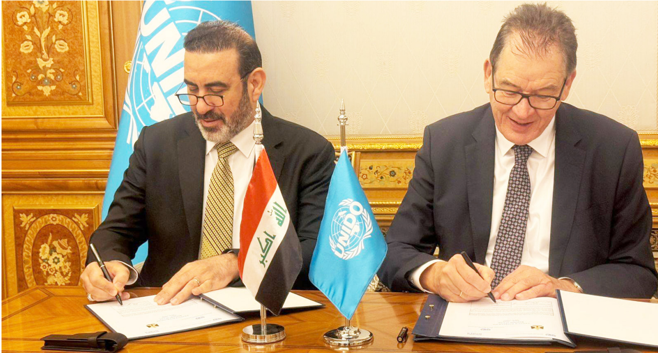
برنامج: مراسم توقيع العراق والامم المتحدة عقد برنامج اليونيدو

بديل ولا تعويض مالي على الرغم من كوننا ليس اصحاب رواتب ولدينا عوائل واغلب العاملين في عدة مهن بهذه المعامل أصبحوا عاطلين عن العمل مما وضعهم الحال في دوامة ادارية وقانونية. مشيرين الى ان (معاملهم نهبت معداتها وهدمت. بحجة غياب مشروع نيو كربلاء الاستماري. الذي تم الغاء لمرور سنتين على عدم تنفيذه ولم نحصل على موقع السوداني. يقضي بتعويضهم قانونيا. في حال لم ينفذ المشروع خلال سنتين). وفقا لما افادوا به. لافتين الي ان (رفع دعاوى الى محكمة كربلاء. لاجراء كشف على تلك المعامل. اذ تم احتساب كل المضار). وتابعوا ان (المحافظة لم توافق على طلبهم نظرا لنقص السيولة المالية. وبالتالي تم رفض المطالب من قبل محافظ كربلاء. سنوات). واكدوا خلال حديثهم (صنور قرار يقضي بتعويضهم لكسه لازال معلقا). بحسب ماذكروا. موضحين انهم (تمكّنوا من استحصل موافقات رسمية. من قبل التنمية الصناعية. ووزارة الصناعة. لان المحافظة لم تجهزم بالنقط. بسبب مشروع نيو كربلاء على تلك الاراضي). واضافوا ان (قرار رئيس الوزراء. محمد شياع