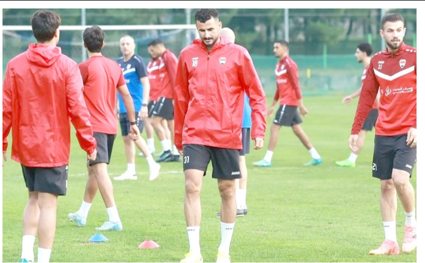
مباراة : جرت أمس مباراة بين المنتخب الوطني ونظيره البحريني ضمن مواجهات بطولة كأس العرب، نتيجة اللقاء على الموقع الإلكتروني لجريدة (الزمان)

منهياً أزمة أشعلت موجة استياء واسعة في الشارع، بعد أن باشر مصرف الرشيد الصرف منذ يوم الاثنين الماضي، ما ضاعف تساؤلات المتقاعدين