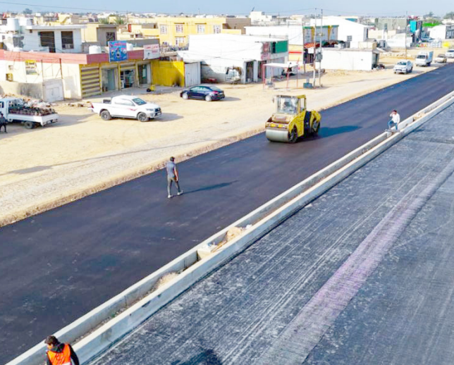
تبليط: عمال خلال تبليط الطريق الرئيسي الرابط بين تقاطع النهروان وطريق بغداد كوت

وأضاف البيان (ملاكات مديرية الطرق والجسور بأشرت بفرش طبقة الإسفلت البائسدر المدمعة بمادة الجيوكريد، بعد اكمال القالب الجانبي والصب الكونكريتي. ليكون الطريق بمسارين للذهاب والإياب). مبيناً ان (المشروع يتضمن مد أنابيب المياه وشبكات الكهرباء، فضلاً عن نصب منظومة إنارة حديثة والعلامات المرورية والكاميرات الجارية). وأكدت محافظة بغداد ان (الطريق يسهم في تخفيف الزحامات والحد من الحوادث المرورية. ماضية في تطوير الطرق الاستراتيجية المتقدمة. بما يواكب أحدث المعايير العمرانية والخدمية لخدمة أهالي