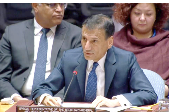
كلمة : ممثل الأمم المتحدة في العراق يلقي كلمته أمام مجلس الأمن

رجّح الممثل الخاص للأمم المتحدة في العراق محمد الحسان خلال إحاطته أمام مجلس الأمن، عدم تأخر تشكيل الحكومة العراقية الجديدة، معرباً عن أمه في حل المسائل العالقة بين حكومتى بغداد وأربيل، وذلك قبيل إنتهاء ولاية يونامي في الحادي والثلاثين من كانون الأول الجاري. وأكد الحسان إن (الإحاطة الحالية تعد الأخيرة قبل إنتهاء مهمة البعثة)، شددًا على أن (مغادرة يونامي لا تعني نهاية التعاون الأممي في العراق بل بداية فصل جديد)، وشدد على القول إن (العراق انتصر على الإرهاب بفضل شعبه والدعم الدولي، ونجح في إقامة انتخابات شفافة بنسبة مشاركة مرتفعة،