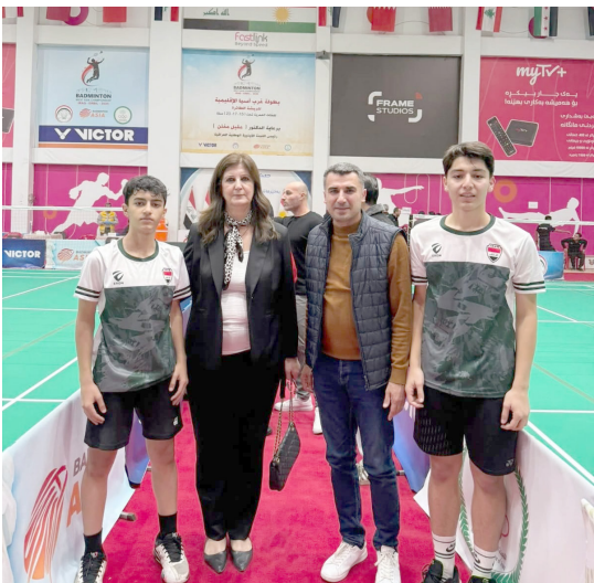
بطولة: اللاعبون المشاركون في بطولة الريشة الطائرة بمدينة اربيل

بغداد- رافد البهري توج المنتخب الوطني بالريشة الطائرة ببطولة غرب اسيا، التي اختتمت منافساتها على ملاعب شادي عين كاوة في محافظة اربيل، وبحفل ختامي رائع، حيث تمكن ابطال العراق من حصد 14 ميدالية ملونة، و بواقع 6 ذهبية و4 ميداليات فضية و4 ميداليات برونزية، بعد ان سطر لاعبيها ان صورة هبيرة ومشرقة للعراق، من خلال تقديمهم المستوى الذي يليق برياضة العراق، وبحصاد كبير ولأول مرة بتاريخ الريشة الطائرة العراقية.