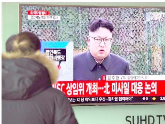
عرض : شاشة تعرض تقريرا عن الزعيم الكوري الشمالي كيم جونج أون في سيئول

وقدمت الوكالة، ان بومبيو الذي يقوم باول جولة له منذ توليه مهامه في يناير، سلم الأمير محمد بن نايف بن عبد العزيز (57 عاما) وزير الداخلية منذ 2012 الميدالية مساء السبت، في الرياض.