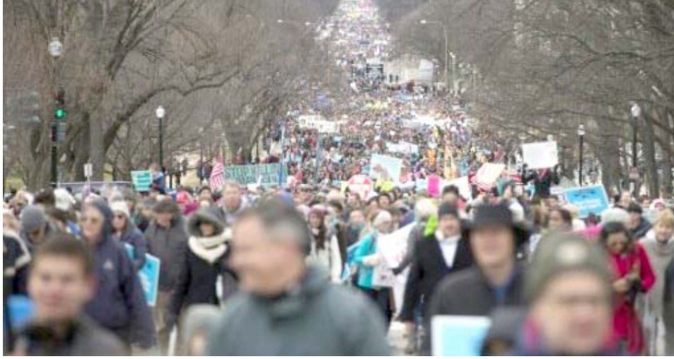
تظاهرات، جانب من التظاهرات التي عمت الولايات المتحدة مناهضة للإجهاض

والمهاجرين والاقليات - بما في ذلك الحق بالإجهاض. وبعد اسبوع نظم المناهضون للإجهاض مسيرة سنوية وصفت بانها اكبر تظاهرة من هذا النوع في العالم، وتحدث فيها نائب الرئيس مايك بنس وهو معارض للإجهاض. ويعتبر التهديد الحالي بوقف التمويل عن جمعية تنظيم الأسرة الطلقة الاولى في المعركة ضد الاجهاض. وإذا ما تم التصديق على تعيين مرشح ترامب، نيل غورساتش رئيسا للمحكمة العليا، وهو قاض معروف بأنه من مناصري حق الحياة، فإن غالبية من القضاة المحافظين قد يهدون دستورية حق الإجهاض بحد ذاته.