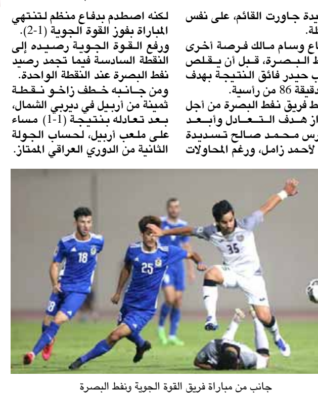
جانب من مباراة فريق القوة الجوية ونفط البصرة