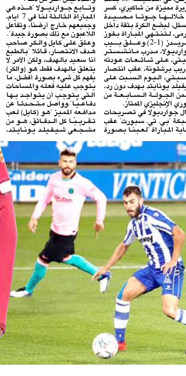
تعادل؛ مباراة برشلونة مع فريق الأفييس تنتهي بالتعادل