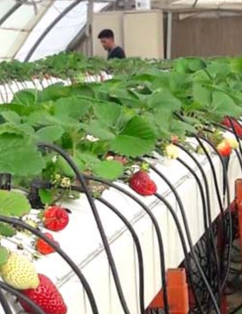
فراولة : مزرعة نموذجية لانتاج الفراولة في ديالى