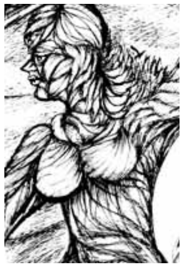
الشعراء اولاً، الشعراء اولاً، الشعراء اولاً هكذا تصدح نبضات القلوب لانهم مصابيح الحب في سماء الحياة يتحدون زمن كورونا الملعون الذي اغلق كل الطرق للعبور، ويحصد الارواح البريئة كالحروب ، يصنع الشعراء من كلمات قصائدهم شموع لاضاءة الدروب، وتفتح نوافذ الحرية لكل انسان وتمضي عربة الحياة مسرعة كالغزال، لترسم الطريق الجديد للأجيال، أنه روح الشعر الذي يوحد

بين القلوب، ويصنع للمشاق اجنحة السور لكي تسبح فوق الجبال والبحار لتصل الى مدينة الحب كالطيور، هذه هي رسالة الشعراء وطن يتغنى بقصائد الانبياء .