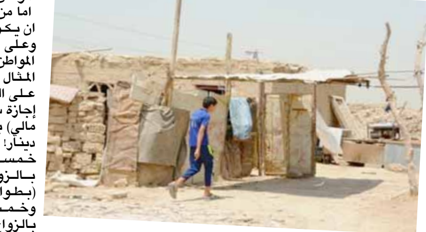
أحد المنازل المتجاوزة

الموضوع ادناه بعث به المواطن اباد علي من بغداد/ الدورة يتناول فيه اراء شخصية عن كل الخدمات التي يحتاجها المواطنون ويبتدئ المواطن موضوعه قائلاً لا يريد المواطن اكثر من بعض الاشياء البسيطة بالنسبة للدولة المستحيلة على الناس ومن هذه