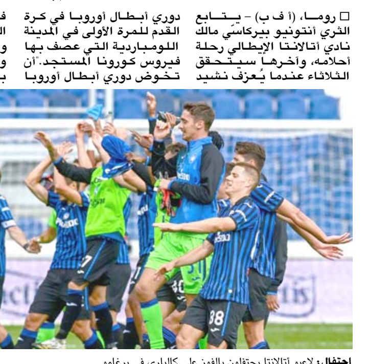
إحتفال: لاعبو أتلانتا يحتفلون بالفوز على كالياري في برغامو

□ روما، (أ ف ب) - يتتبع الثري أنتونيو بيركاسي مالك نادي أتلانتا الإيطالي رحلة أحلامه، وأخرها سيحقق الخلفاء عندما يعزف نشيد دوري أبطال أوروبا في المدينة اللومباردية التي عصف بها فيروس كورونا المستجد. أن تخوض دوري أبطال أوروبا