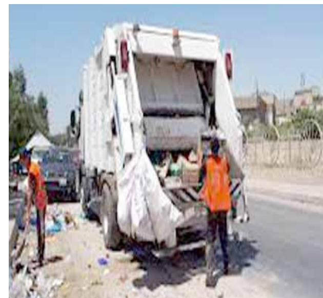
عمال النظافة يمارسون مهنتهم

شاعت لي الظروف ان اذهب الى اكثر من محافظة هذا العام لوجود اقارب لي يسكنون في بعض المحافظات اضافة الى زيارة اسنائي الساكنين في محافظتين والحقيقة انني لاحظت ان كل المحافظات تشترك في صفة واحدة هي القذارة وعدم النظافة..