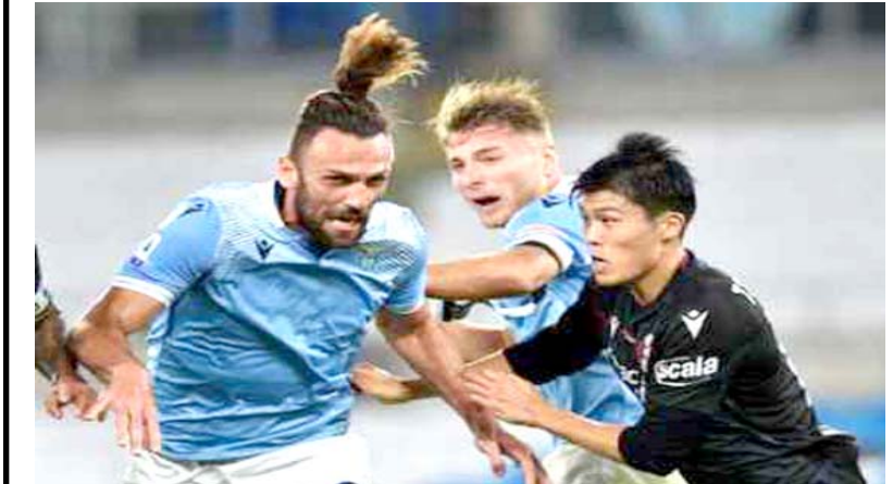
في الصورة: لاعبو لاتسيو يلعبون ضد بوروسيا دورتموند في دوري أبطال أوروبا

□ بروج (بلجيكا)، (أ ف ب) - حل لاتسيو الإيطالي في بلجيكا لخوض مباراة أمس الأربعاء ضد بروج في دوري أبطال أوروبا، بفريق ناقص العدد غاب عنه هدفه تشيرو إيموبيلي بسبب الإصابة باصابات بفيروس كورونا المستجد. وقال مدرب لاتسيو سيموني إنزاغني في ملعب بيان بريديل عشية لقاء بروج في الجولة الثانية من منافسات المجموعة السادسة (نحن هنا) 16 (أعيا) وغدا سيصدر النادي بيانا قبل المباراة بناء على وضع "كوفيد-19" في الفريق). ولم يذكر إنزاغني أسماء اللاعبين الذين لم يسافروا مع الفريق إلى بروج، لكن وسائل الإعلام الإيطالية ذكرت أن إيموبيلي والإسباني لويس الرينو ومانويل لاتزاري والبرازيلي لوكاس ليغا والهولندي ديفان أندرسون من بينهم.