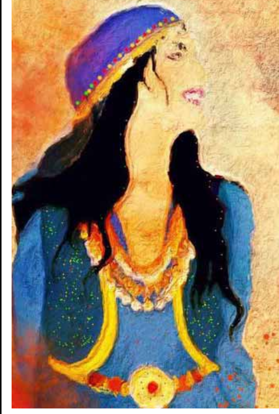
الشعراء اولاً، الشعراء اولاً، الشعراء اولاً هكذا تصدح نبضات القلوب لانهم مصابيح الحب في سماء الحياة يتحدون زمن كورونا الملعون الذي اغلق كل الطرق للعبور، ويحصد الارواح البريئة كالحروب ، يصنع الشعراء من كلمات قصائدهم شموع لاضاءة الدروب، وتفتح نوافذ الحرية لكل انسان وتمضي عربة الحياة مسرعة كالغزال، لترسم الطريق الجديد للأجيال، أنه روح الشعر الذي يوحد