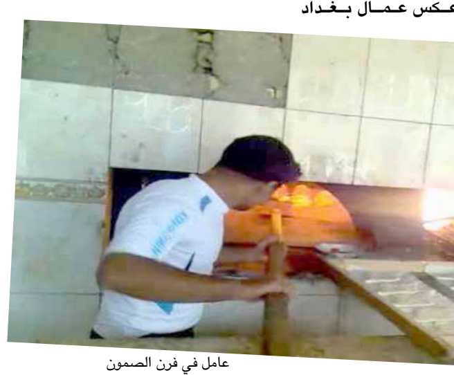
عامل في فرن الصمون

العمل يتواصل بين فترة واخرى اي غير مستمر طيلة الوقت.. كما يوجد موزع للصمون على المطاعم وما دام عمل الافران صعب جدا فان اجوره جيدة ونحن نعمل والحمد لله في كل هذه الاعمال وان هذا العمل لا تختب في العمل بفرن واحد بل تنتقل كل فترة من فرن لآخر والسبب الرئيس هو صعوبة العمل وطويلة في ساعات العمل والمبيت في الفرن او المجهز ميكرا للعمل والعيش في الافران مهمة صعبة حيث ان على العامل ان يننام