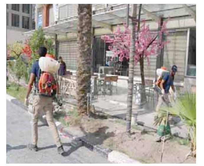
مكافحة الحشرات والقوارض

اوشك الصيف على نهايته دون ان تقوم الجهات المختصة بواجباتها في مكافحة الحشرات والقوارض التي