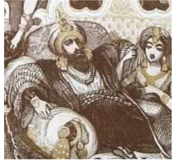
أفعلتمم الآن سر الوصف ل(كلب الروم)؟

تعلمون أيها الناس - وإني لأراکم نسيتموه- أنه في دستورنا بند ينص أنه ( كيفما تكن يول عليك) . وإذا .. لما كان ملك الروم زعيما لإمم نبذت لسان بيان لكتاب من السماء عزيز ومهيمن وأسحخت رقص السنة الكلاب الالهة . إذا ،فاولنكم هم امم الكلاب الالهة .ولابد لهم من زعيم من جنسهم؛ كلب باسط ذراعيه على دفتي العرش بليته. فلا تلوموني - يابني آخر نطقة للمكان وحظفة للزمان - ولاترموني