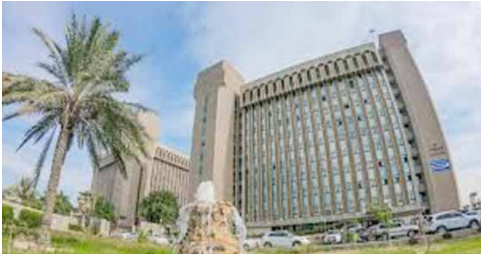
وزارة التعليم العالي والبحث العلمي

تفاجئت بقرار اللجنة المحجف بعدم الموافقة على الاعتراف بالشهادة وتحويل جميع معاملات البورد الاردني الى المجلس العراقي لاجراء امتحان؟! انا عندما قدمت قدمت وفق التعاون الحاصل بين البورد العربي والبورد الاردني والمعمول به في السنوات السابقة والزلاء السابقون الذين قدموا على البورد الاردني كلهم يعرفون بهذا الشئ واخذت عدم ممانعه من البورد العربي ووزارة الصحة العراقية والمستشفى التي اعمل بها وحتى شهادة البورد الاردني فهيه مصدقه من قبل القنصلية العراقية والدائرة الثقافية العراقية طبعاً المعروف ان القنصلية لاتختم وتصديق على شي الا اذا معترف به من قبل العراق والمفاجئة الاكبر عندما ذهبت البارحة للبورد العربي اكتشفت ان البورد العربي لايعرف اي شئ من هذه القرارات !!! ولم يبلغه احد !! طيب انا وبقية الزملاء من باقي الافرع من حملة شهادة البورد الاردني !!! انا قدمت عندما كان معترف فيه في العراق لماذا هذا الظلم جميعكم