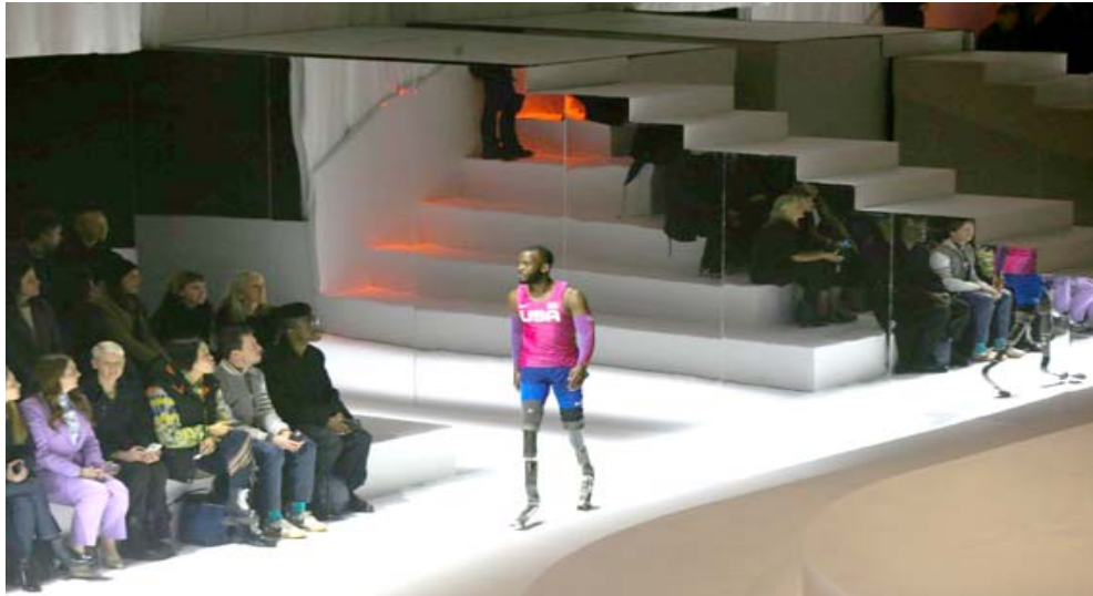
عرض: العداء البارالمبي الأمريكي بلايك ليبر خلال عرض للادوات الرياضية لشركة تاكي في دورة الملباد طوكيو

منصات التتويج أو في الميدان، في حكم بطال الرياضيين المتكشفت إلا إذا أظهر الجميع كايبرنيك بسبب احتجاجه الرائج، ما جعله والرياضيين الذين احتضروا بحركته موضع إدانة المحافظين، بمن فيهم الرئيس الأميركي دونالد ترامبولكن في حزيران/يونيو،