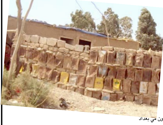
سكان مجاوزون في بغداد

توصيله بالشبكة في شارع بورسعيد). من جانبه، قال مدير قسم طرق الكرخ في دائرة المشاريع التابعة للامانة حسين موسى ان (الدائرة نفذت بالتعاون مع إحدى الشركات المحلية اعمال اكساء الطريق الحولي المستحدث خلف علوة الرشيد على شكل حرف يو ويبدأ قبيل العلوة بنحو 200 متر ومن ثم يتحول خلفها