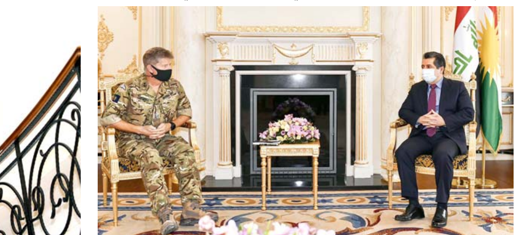
لقاء رئيس حكومة إقليم كردستان خلال لقائه وفد قوات التحالف