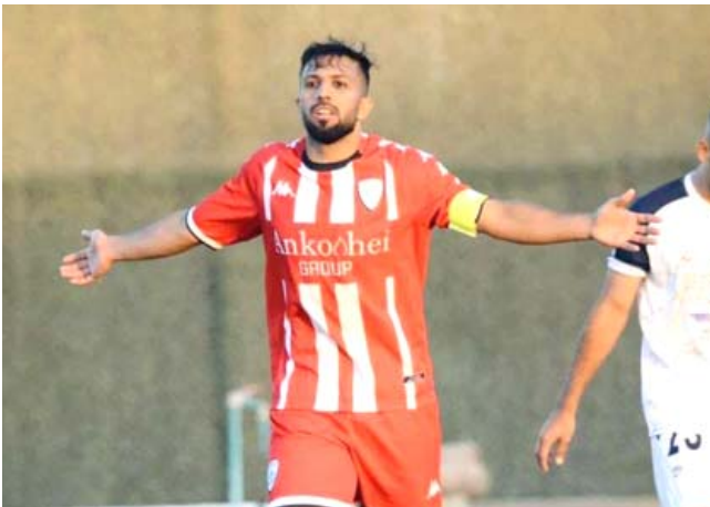
مشهد من مباراة النجف والديوانية