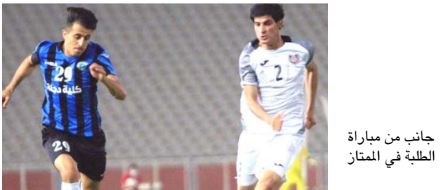
جانب من مباراة الطلبة في الممتاز