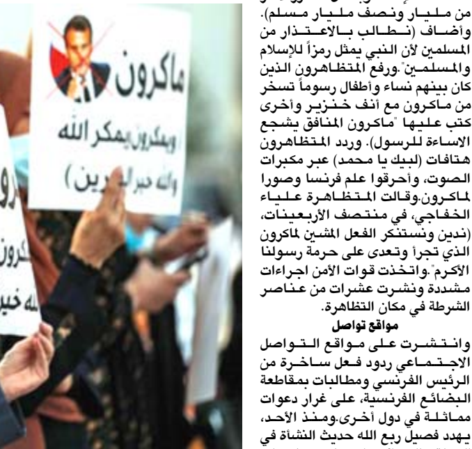
تفديله : تظاهرات وحملات إعلامية تندد بمواقف الرئيس الفرنسي