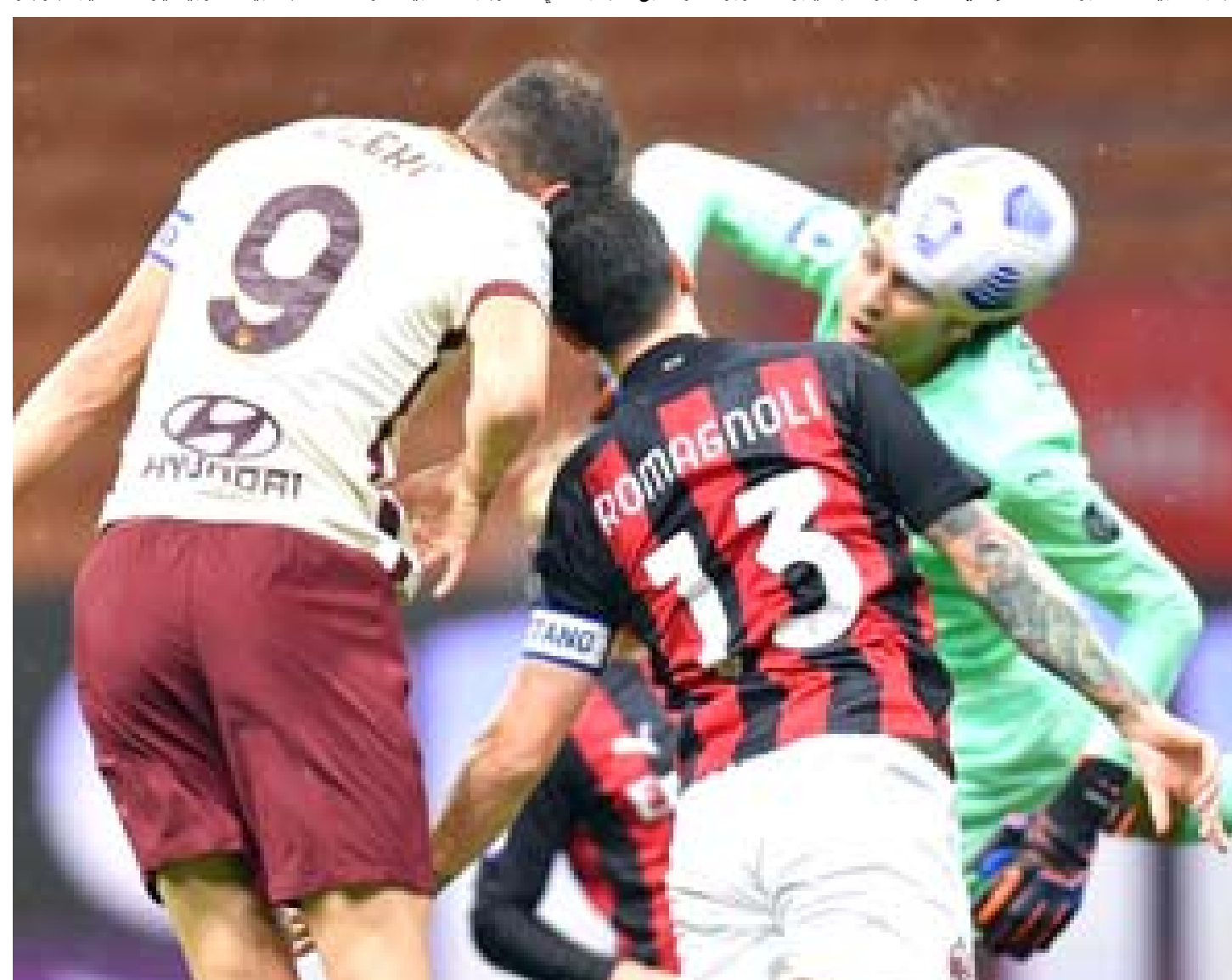
تعادل: روما يقف في وجه ميلان ويجبره على التعادل