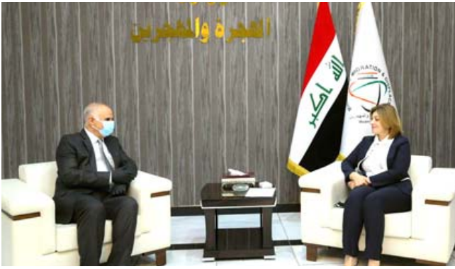
استقبال: وزيرة الهجرة تستقبل السفير الفلسطيني في بغداد