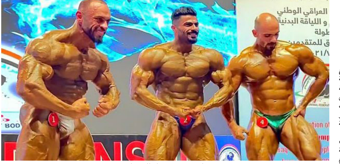
لاعبي منتخب بناء الاجسام