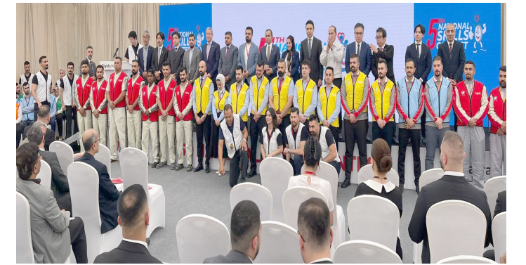
شباب عراقيون شباب في دورة مهارات لتعليم صيانة السيارات