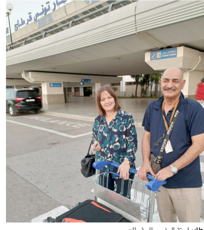
مطار : استقبال في مطار قرطاج

المواطن التونسي والسياح هي الجلوس في الحانات والمقاهي والمطاعم والضحك والتسلية والمتعة وكان ليس هناك شيء يحدث أمامهم، هذا هو سر تونس والقوة الخفية للتجربة التونسية وكفاءة الإدارة الشرطة تحمي