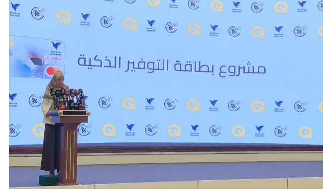
كلمة : مدير الشركة تلقي كلمة

بغداد - ابتهاج العربي اطلقت وزيرة الاتصالات هيام الياسري مشروع بطاقة التوفير الذكية، للحد من عمليات الإختلاس والتلاعب . وقالت خلال اطلاق مشروع بطاقة امس ان (البريد في العراق منسني، وبات من تكريات من الماضي)، مبينة ان (الوزارة تسعى الى تطوير وتعزيز هذا الملف واعادته الى الواقع الاجتماعي)، ووضحت الياسري، ان (الشركة العامة للبريد والتوفير، ويدعم من هيئة الراي في الوزارة، تتابع الإنجازات المتحققة في قطاع البريد والتوفير، منها اطلاق مشروع بطاقة التوفير الذكية، باسناد الشركات المحلية الداعمة)، مشيرة الى (اهميتها هذا المشروع في مجال مكافحة الفساد، والحد من حالات الإختلاس والتزوير والفساد في ملف التوفير، في اطار التعامل الورقي)، واكدت الياسري، ان (التعامل الإلكتروني لينة