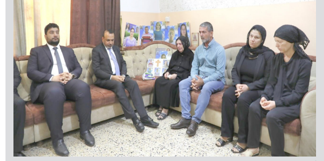
زيارة وزير العمل يزور عائلة منكوبة

بغداد - الزمان قدم وزير العمل والشؤون الاجتماعية، احمد الاسدي، التعازي الى اهالي ضحايا حريق الحمدانية في نيوى، وذلك خلال لقائه مع اطران يونشان حنا، مؤكداً تلبية احتياجات عائلة منكوبة وشمولها براتب الحماية الاجتماعية، والمعين المتفرغ، وقال بيان تلقته (الزمان) امس، ان الاسدي وجه بضروة الالتزام بشروط واجراءات السلامة المهنية في الابنية كافة، معوزاً القسم والصحة والسلامة المهني بتعاينة مستمرة لضمان وجود اجراءات السلامة في مناطق القضاء، مبيناً ان (الوزارة تستعمل الاسر المستحقة من ذوي ضحايا الحريق براتب الحماية الاجتماعية، وتضمينها في الدفاعة السادسة، التي جانب شمول التياضي من اسر الضحايا، وفي الدور الايوباعية براتب الاعانة او المعين المتفرغ)، و اضاف انه (سيتم شمول الراغبين من عائلات الضحايا بالفقروض الصغيرة وتشجيعهم على