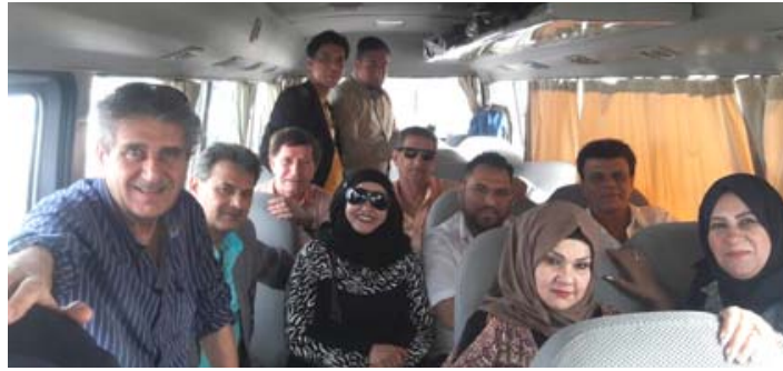
وزارة الثقافة العراقية الذكرى 50 جويل