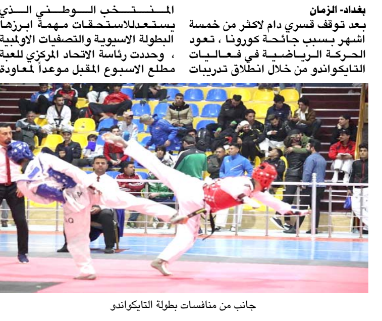
جانب من منافسات بطولة تايكواندو

بغداد- الزمان بعد توقف قسري دام لأكثر من خمسة أشهر بسبب جائحة كورونا ، تعود الحركة الرياضية في فعاليات تايكواندو من خلال انطلاق تدريبات المنتخب الوطني الذي يستعد للاستحقاقات المهمة أبرزها البطولة الآسيوية والتصفيات الأولمبية ، وحدث رئاسة الاتحاد المركزي للعبة مطلع الاسبوع المقبل موعداً لمعاودة