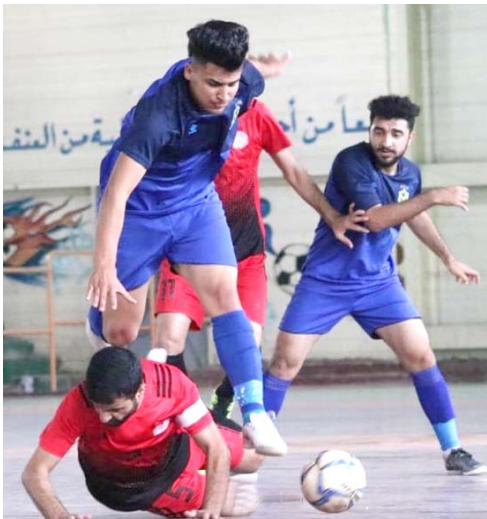
احدى منافسات كرة الصالات

بالمشاركة في دوري 2020-2021 الذي حدد له منتصف شهر تشرين الثاني المقبل موعداً لإطلاقه، إن تكون على علم بمسود بداية المسابقة التي ستكون مختلفة عن المواسم السابقة.