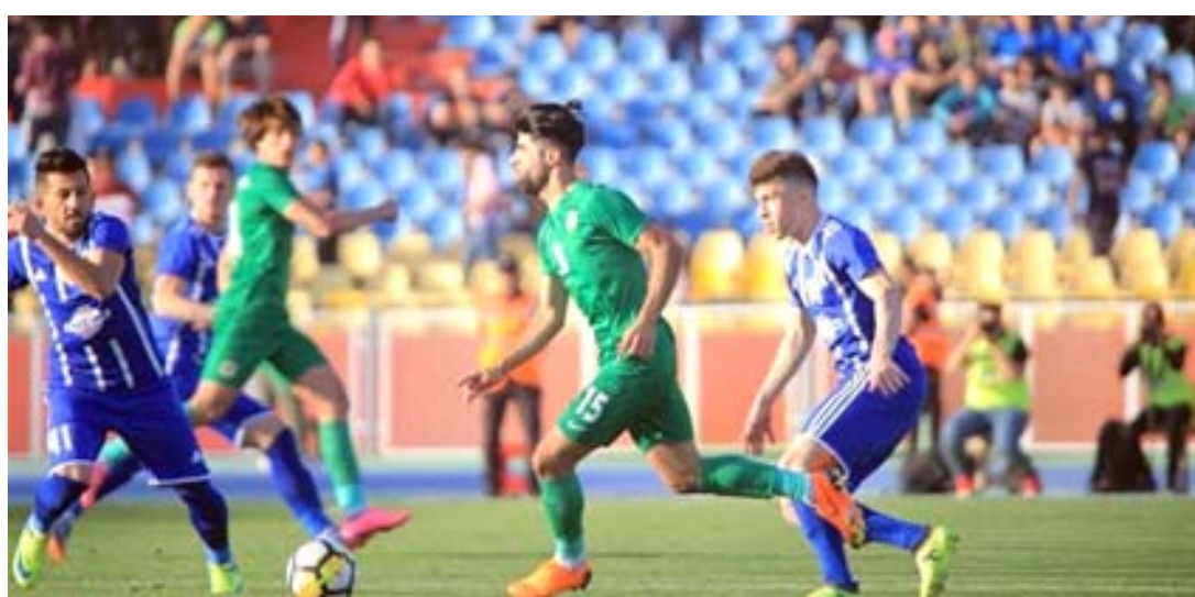
انطلاق: توصيات أمنية قبل انطلاق الدوري الممتاز