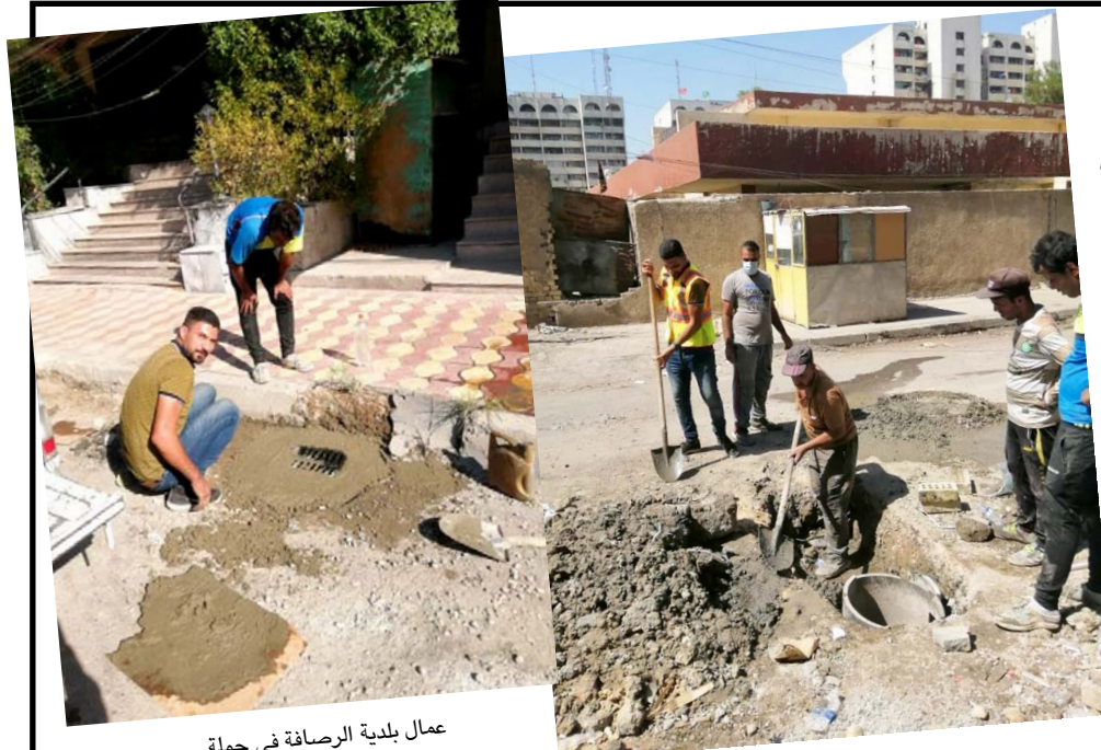
عمال بلدية الرصافة في حملة

وعدهه مثالا للمسؤول البلدي المخلص منهل العمارة من قبل الملاكات البلدية وسيتم تغريم صاحبها). وضاف (بخدمتمك لاي عنوان ضمن قاطع مركز الرصافة ولاي مناشدة) ورحب سكنة الاهالي دوما وؤدي واجبنا بكل امانة.