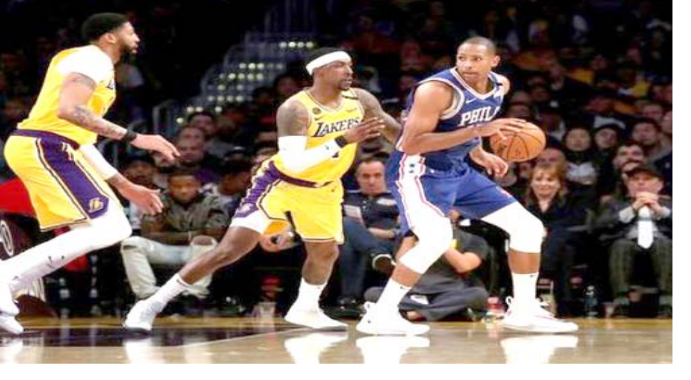
سلة: مباراة في دوري السلة الأمريكي

□ (رويترز) - وافق لاعبو دوري كرة السلة الأمريكي للمحترفين يوم الخميس على استكمال الموسم بعد أن أجبروا الرابطة على تأجيل مباريات بالأدوار الإقصائية احتجاجاً على الظلم العنصري ووحشية الشرطة. وقال الرئيس الأمريكي دونالد ترامب يوم الخميس إن دوري كرة السلة الأمريكي للمحترفين بات يشبه "منظمة سياسية" بعد مقاطعة مليوني باكر لمباراة في الأدوار الإقصائية تضامناً مع المحتجين على إطلاق الشرطة النار على جي كوكوب بليك وهو رجل أسود في مدينة كينوشا في ولاية ويسكونسن مقر الفريق وعبر مايك