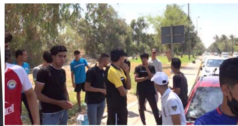
فئات: مطالبات من قبل لاعبي الفئات العمرية تقدم لاتحاد الكرة