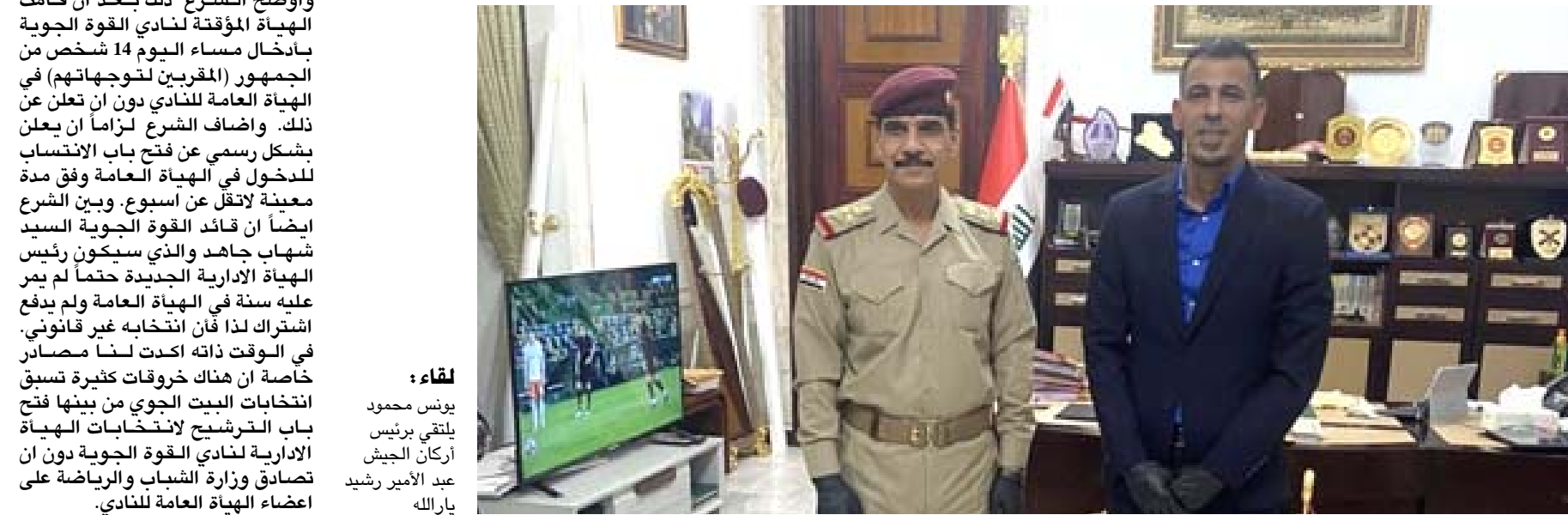
لقاء: يوش محمود يلتقي برئيس أركان الجيش عبد الأمير رشيد يارالله

بغداد- الزمان تتطلب مساندة. وقال محمود تشریفنا اليوم بزيارة رئيس أركان الجيش الفريق أول قوات خاصة الركن محمود، ان هبة المؤسسة العسكرية