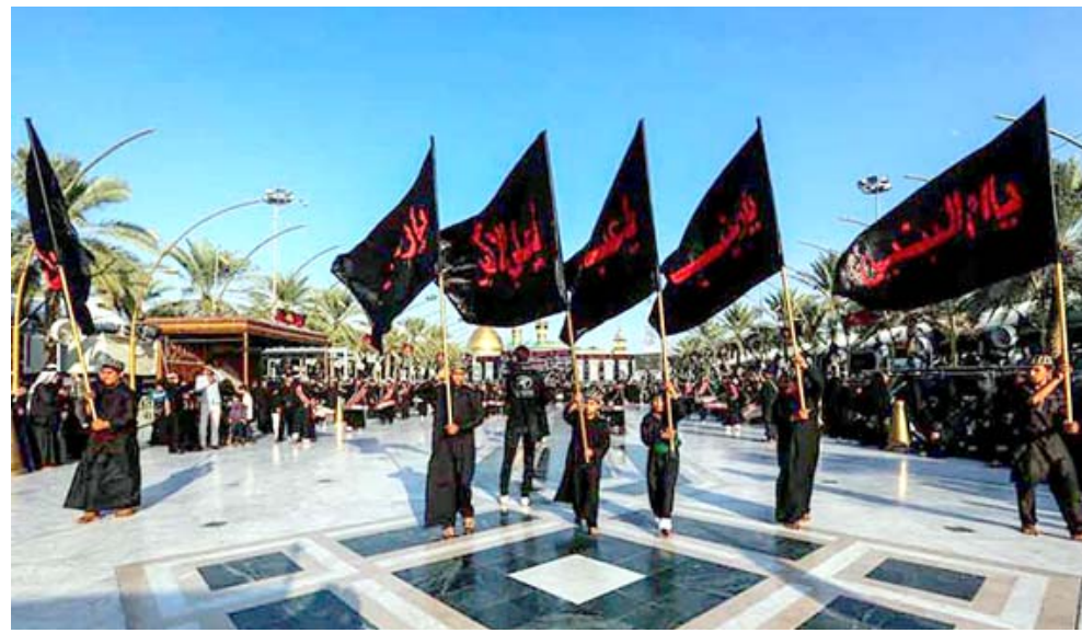
مواكب حسينية في كربلاء