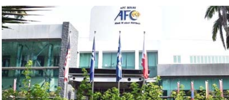
مقر الاتحاد الآسيوي بكرة القدم