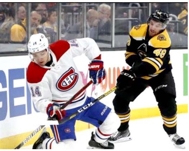
مباراة في هوكي الجليد

□ تورونتو (رويترز) - قالت رابطة دوري هوكي الجليد الأمريكية الشمالية إنها أجلت مباريات يومي الخميس والجمعة لتنضم إلى احتجاجات بطولات أخرى على إطلاق الشرطة النار على رجل أسود في ويسكونسن يوم الأحد الماضي. ويطبق القرار على ثمانية فرق متبقية في الأدوار الإقصائية إذ كان من المفترض أن يلعب فينلانديا فالرين ضد نيويورك ايلاندرز وفانكوفر كانوكس ضد فيجاس جولدن نايتس يوم الخميس وستتأجل مواجهة بوسطن بروينز ضد تامبا باي لايتنينج وكولورادو افالانش ضد دالاس ستارز يوم الجمعة. وأشارت الرابطة إلى أن المباريات ستعقد بدءاً من السبت. وقالت رابطة الدوري في بيان مشترك مع رابطة لاعبي الدوري "رابطة دوري هوكي الجليد ورابطة لاعبي دوري هوكي الجليد يدركان أنه ما زال هناك الكثير من العمل في مدينتي تورونتو وإدمونتون فيما تم إطلاق النار على بليك سبع مرات من مدى قريب في