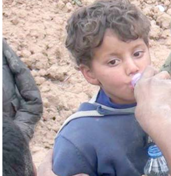
أغاثة : مقاتل من الحشد الشعبي يجيش بالباك، لدى مشاهدته طفلاً نارحاً من الموصل يطلب الماء من شدة العطش