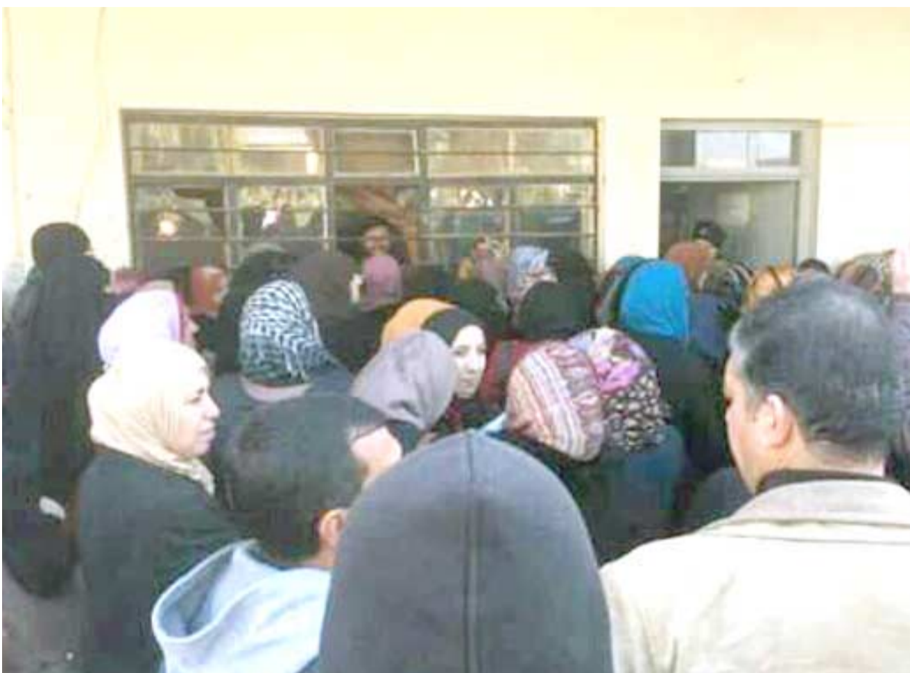
مستحقات: عدد من موظفي دوائر الدولة اثناء استلامهم المستحقات الشهرية

المذكورة وتعرقل جهودهم للاستمرار بالتعلم في المراحل اللاحقة خصوصا وان رسوبهم في هذه المرحلة بات امرا مؤكدا بسبب عدم قدرتهم على مواكبة المناهج التي طالها التغيير في فترة ابتعادهم عن الدراسة خلال العامين السابقين ..