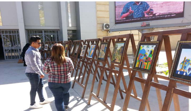
جانب من المعرض