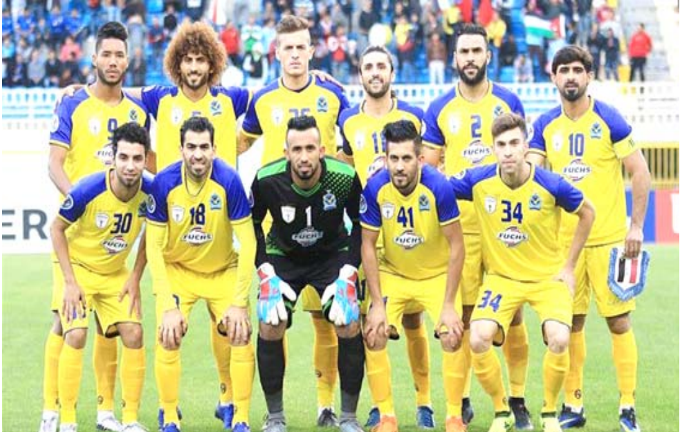
تعاقدات فريق القوة الجوية يحمي لاعبيه من مفاتحات الاندية الأخرى عبر تجديد تعاقداتهم

التفزيونية الضمن باهظا بعدما كان الجميع متطلعا لابل طامعا بالبقاء ففترة احرر ولان لجان الاتحاد كانت وراء الذي حصل لانها لم تمتلك القدرة في إدارة الأمور حيث لجنة الانضباط وعلى اللجنة الطبيعية المنتظر منها العمل المطلوب بعيدا عما يشاع ويغار من أمور ولوانها تخضع لخلافات شخصية كن اللجنة امام الاختبار الحقيقي من حيث اتمام استلامها لعدنة الشراخ الرياضي ولانها اتت عبر تدخلات شخصية وليس من خلال عن طريق اخر لكننها امام مسؤولية في التغيير الذي جزت الاتحادات من تحقيقه ولانها جميعا عمل تنفي ظروف غاية في الصعوبة منذ عام 2003 ولليوم بما في ذلك اللجنة الطبيعية التي بالكاد تقدر ان تعقد اجتماعا لها لكن هذا لا يمنع من تقديم ما يتظرها من عمل كبير وعليها التعلم من درس الانتخبات الاخيرة والذي حصل فيها وكانت السبب في الخيء بها امام إصدار وتميرير نظام الداخلي امام الانتخبات المغلقة ومهم ان تكون مفتوحة للجميع لكن حصرا من يجد في نفسه القدرة على العمل في رياضة العراق لكر كرة القدم واخذت الرياضة المحلية ولازال البعض لايقهم غير ذلك لان كرة القدم دوما في المقدمة والامر يتكرر مرة اخرى للهيئة العامة وكيف ستدبر الامور الاهم في النقط بالمركز الرابع.