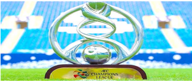
الشرطة يمثل العراق في الدوري الآسيوي

الرياض - الزمان محمد بن سلمان للمحترفين، وشملت الإصابات الأخرى إداريين وفنيين وكان الاتحاد قد قرر في وقت سابق استئناف مسابقاته الكروية في الرابع من أغسطس/ آب المقبل بعد توقف المنافسات منذ مارس/ آذار الماضي.