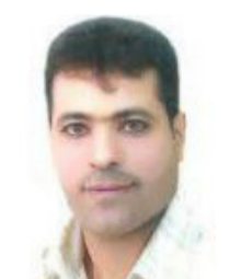
حيدر صبي بغداد

السبب والمسبب ومن ثم العذر للقيام بمحو حماس من الوجود واحلال منظمة فتح محلها . بقي هناك سيناريو آخر وهو مائل بحضوره القوي ويكمن في الإبقاء على حماس وبقاء القطاع وان طال الدمار فيه ما سيتردد عن ال 70 ، دعم وستنتهي العمليات العسكرية الإسرائيلية وبواسطة مصرية بنهاية المطاف ليتوجه بعدها الطرفان إلى ملف تبادل الأسرى ، وهذا كله لن يتحقق وحال دخول حزب الله او الفصائل الموالية ليران في سورية الحرب مع إسرائيل هنا وبخصم ظاهرة توسع الجبهات ، فان منطقة الشرق الاوسط ستتغير فيها قواعد اللعبة ولن يكون بالإمكان التنبؤ بما ستؤول اليه المنطقة من عواقب وخيمة ، لكن ان الخزمت ايران وانزعتها الحذر وهذا مرجح فحماس باقية والقطاع ، والقضية الفلسطينية دون حل وهي لن تحل مالم تحل الدولتين وحتى تحقيق ذاك سنستغل نحصى اعداد القتلى من الجانبين ونحن نقف على شواهد من الدمار الذي احال من بلدات غزة الى اطلال ، ونقف طويلا امام طوفان الدم الذي اغرق مستوطنات الغلاف لنرى مشاهد المستوطنين ودورهم النهوية ونكريات عواظهم التي تنكبها العيون بدموع توبهم من دم .