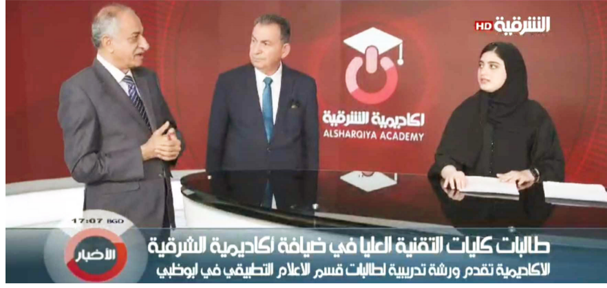
ورشه : لقطات من ورشة تدريبية اقامتها اكاديمية الشرقية للاعلام