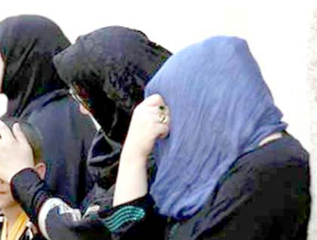
أرامل: ازدياد عدد الأرامل في العراق خلال السنوات الأخيرة

صر اليوم الدولي للأرامل (23 حزيران) دون أن يخسر انتباه الكثيرين وخاصة المسؤولين في العراق