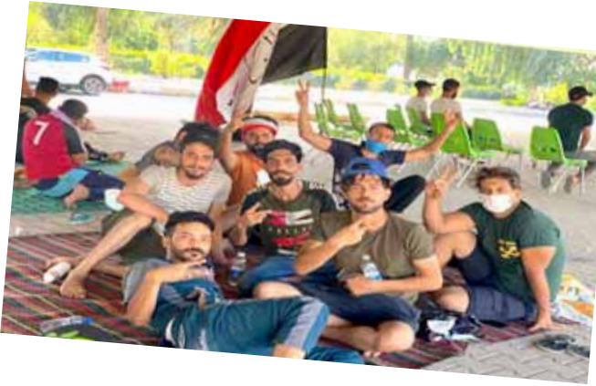
المعتصمون يلوذون بجسر تقاطع دمشق من أشعة الشمس