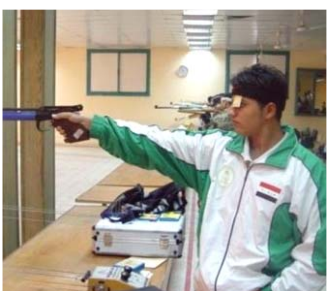
جانب من إحدى سباقات الرماية

بغداد- الزمان حصد الاتحاد العراقي المركزي للموعد النهائي لإجتماعه غير العادي بعد تاجيله أكثر من مرة بسبب الظروف الراهنة. وذكر الاتحاد في بيان صحفي تماشيا مع الظروف الراهنة وبعد أن أعلنت اللجنة العليا للصحة والسلامة الوطنية الخاصة بمكافحة فيروس كورونا في العراق، رفع حظر التجوال المفروض منذ أكثر من شهر، في فترة النهار خلال شهر رمضان من الساعة 6 صباحا وإلى الساعة 6 مساءً، قررت الجمعية العمومية من الندية والاتحادات الفرعية الداعية الى الاجتماع غير العادي للاتحاد العراقي المركزي للرماية والذي كان من المقرر إجتماعه في اسس الاربعة ، قررت تأجيل هذا الاجتماع الى موعد قريب حددته الهيئة العمومية يوم الثلاثاء القادم الموافق 28 / 4 / 2020 على قاعة الشعب الاولمبية لكرة السلة. وأضاف ان الجمعية العمومية للرماية الاولمبية قد أرسلت إشعاراً بموعد عقد هذا الاجتماع الى الاتحاديين الدوليين والآسيويين والرماية وكذلك الاتحاد العربي. وأكد الاتحاد، على جميع أعضاء الجمعية العمومية الأخذ بعين الاعتبار الحرص الصحي الكامل من ارتداء الكمامة والكفوف للوقاية الاحترازية حفاظا على الصحة العامة.