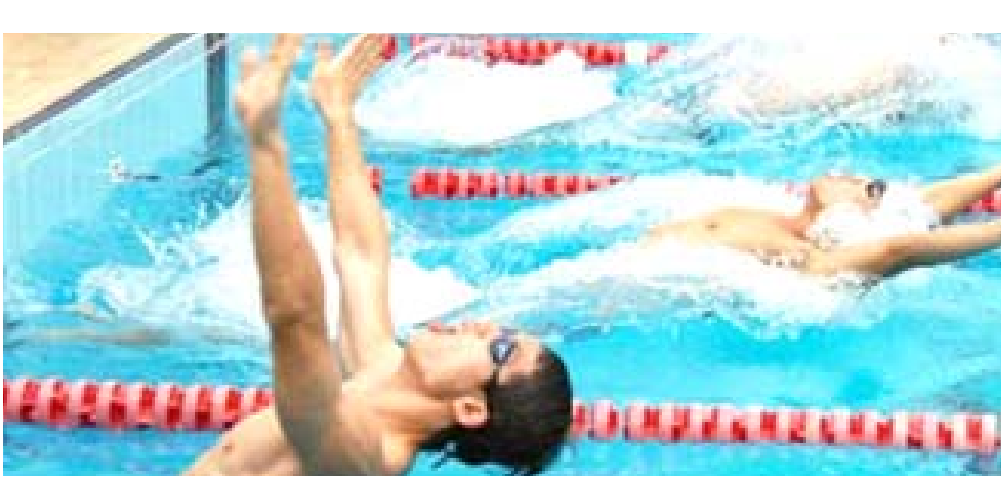
لقطة لمنافسات السباحة الحولية للفتات العمرية