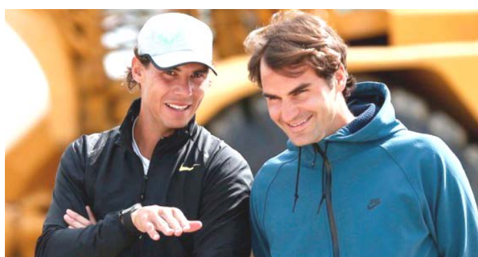
بقية الخبر على موقع (الزمن)

مدير- (أ ف ب): أعرب النجم الإسباني رافايل نادال أمس عن إحباطه من كون لاعبي كرة المضرب لا يزالون غير قادرين على ممارسة رياضتهم بسبب فيروس كورونا المستجد، في حين كشف غريمه السويسري روجيه فيدرر عن سعادته بتعافيه من عملية جراحية في الركبة. ومددت الحكومة الإسبانية العزل التام في البلاد حتى التاسع من أيار/مايو المقبل، حيث جميع السكان محصورين في منازلهم باستثناء عدد قليل يعمل في قطاعات محددة، تاركة نادال في حيرة من سبب عدم قدرته على التدريب. وقال الماتادور الإسباني في بث