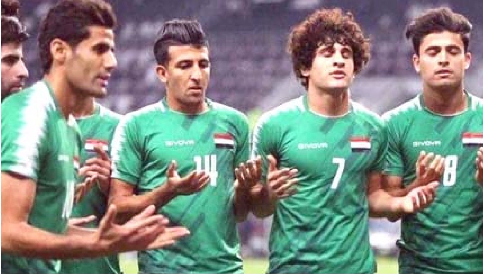
طموح: يسعى الشارع الرياضي إلى مواصلة نجاحات أسود الرافدين عند عودة المنافسات من جديد

ملعب البصرة تغلب به على هونغ كونغ مع تقديرنا لإنجازات الرياضيين الآخرين. مواصلة المشوار صحيح إن الحديث اليوم عن كرة القدم متوقّف بسبب وباء كورونا لكن الحدث الكروي العراقي الذي حققه المنتخب رغم ظروف المشاركة بعدما شكّلت النتائج الإهتمام عند الجميع في أن يتمكن المنتخب بالفرق بالاتجاه الصحيح عندما تمكن تخطي خمس مباريات من دون خسارة وهذا مؤشر جيد على تفاعل الفريق مع المباريات والتعامل معها بتركيز بعدما لعب اقوي مبارياته خارج ملعبه حينما تعاد مع البحرين بهدف تحقيق النتيجة الأفضل والأكبر على منتخب إيران بهدفين لواحد وكذلك الفوز على كمبوديا بأربعة أهداف قبل أن يخوض لقاء واحدا في