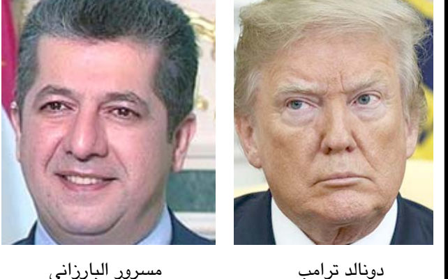
مسرور البارزاني دونالد ترامب

بغداد - الزمان تلقى رئيس الجمهورية برهم صالح السبت برقية تهنئة من الرئيس الولايات المتحد الأمريكي دونالد ترامب بمناسبة اعياد النوروز. وبحسب بيان رئاسي تلقته (الزمان) اسمن فقد اعرب الرئيس الأمريكي، في برقيته، عن تهنائه بمناسبة اعياد نوروز، متمنياً للشعب العراقي الاستقرار والسلم، مشيراً الى ان البلدين حققا تقدماً في محاربة عصابات داعش الإرهابية. وأكد ترامب (رغبة بلاده في بناء