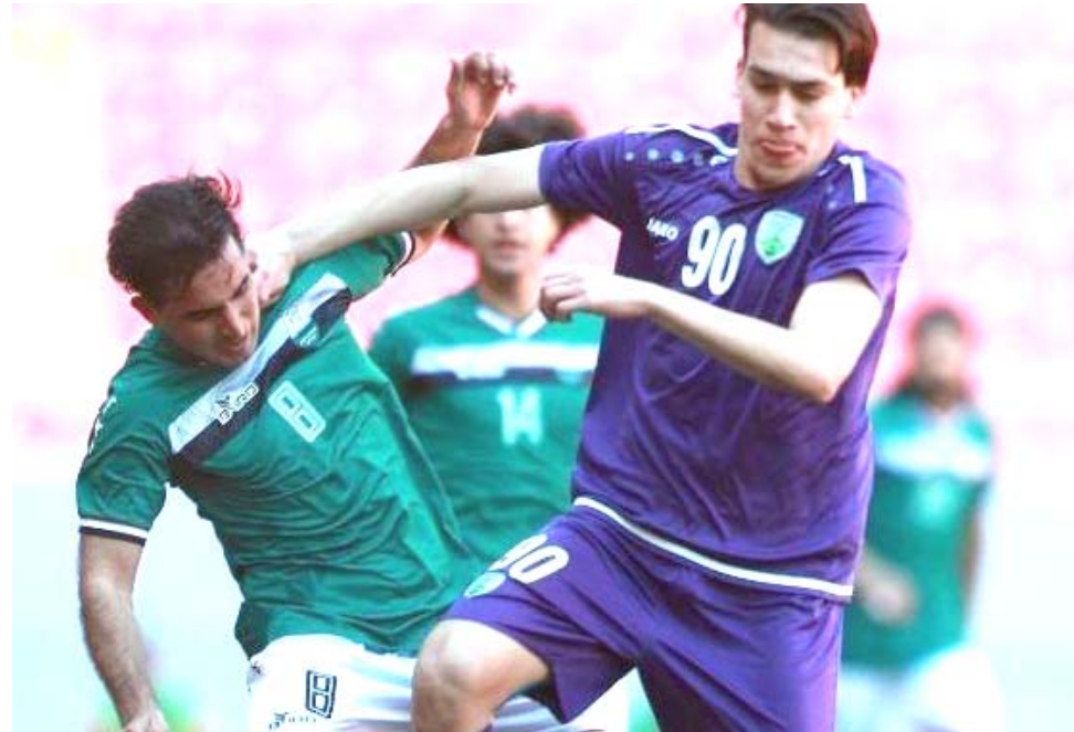
جانب من إحدى مواجهات الممتاز

مواصلة الشوار خيار استكمال الدوري قد يكون حاضرا كفكرة في حال تم القضاء على فيروس كورونا او محاصره في غضون اسابيع من إيقاف المنافسة. ومن الممكن ان تستكمل منافسات