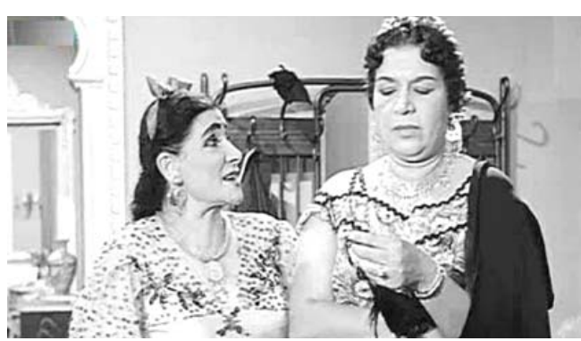
ماري منبب في مشهد تمثيلي

اشتهرت الفنانة ماري منبب بانها أقوى حماة في مصر، جسدت دور الحماة والام ببراعة لا يفوقها فيها احد، و عرفها الجمهور من خلال المسرح والسينما حتى بات يعرفها بمجرد سماع صوتها دون ان يراها،